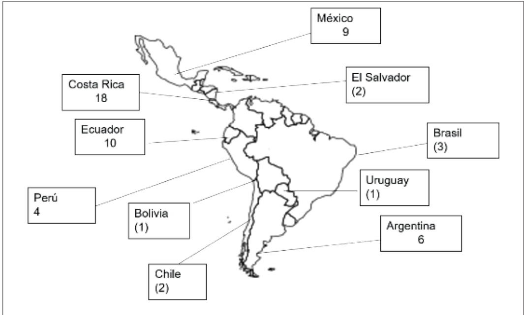
Imagen 2: Casos de éxito de Turismo Comunitario en América Latina