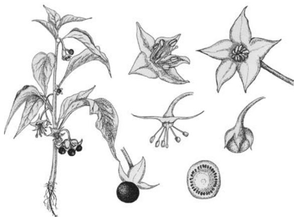
Figura 1. Dibujo de las partes constituyentes de una planta de Jaltomata procumbens (Cav.) J. L. Gentry forma erguida, recolectada en San Lorenzo Tlacotepec Municipio de Atlacomulco, Estado de México, México. 2006.

Jaltomata procumbens es una planta arbustiva (Figura 1) con tallo succulento de color verde; hojas simples con borde liso; flores de color verde blanquecino o amarillo pálido; el fruto es una baya de color negro con semillas pequeñas (Centurión et al. 2000; Davis y Bye 1982). Se distribuye por la República Mexicana sobre todo en climas templados y húmedos (Tovar 2005).