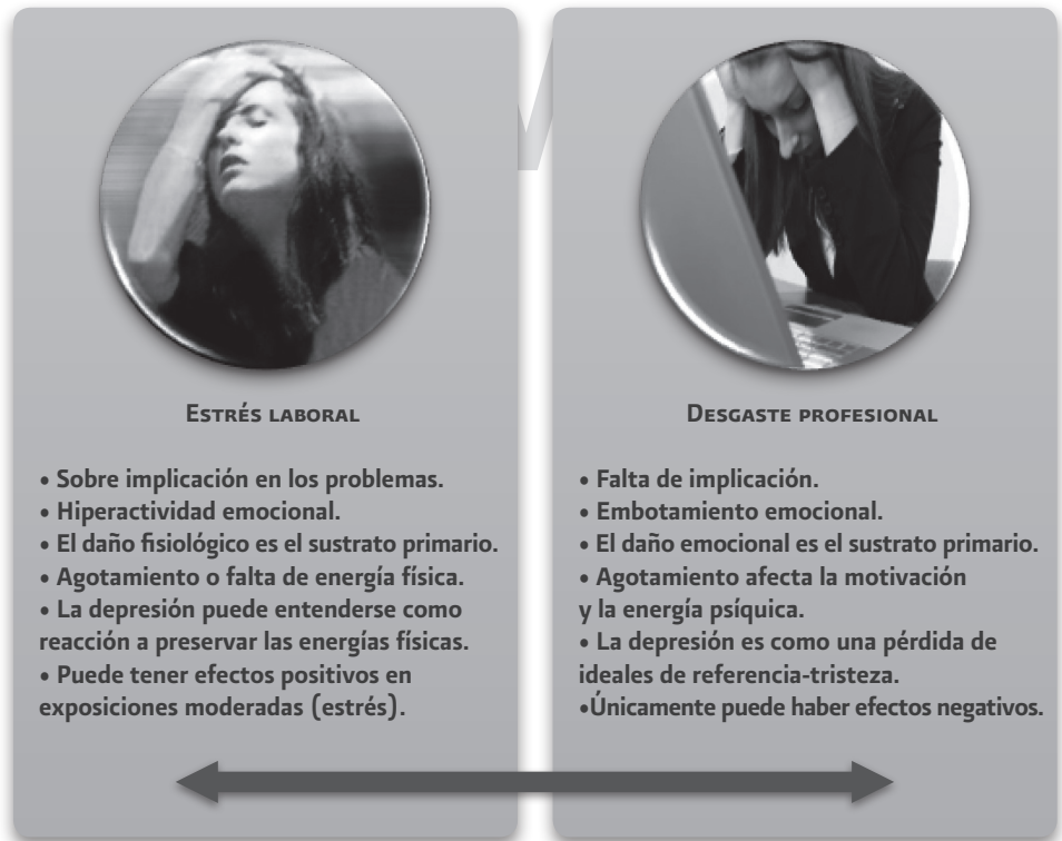
Figura 1. Diferencias entre estrés laboral y desgaste profesional.