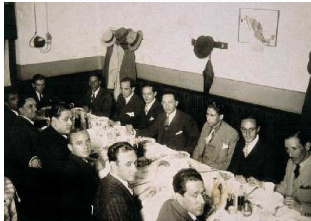
Roberto Montenegro, Salvador Novo, Carlos Pellicer, Xavier Villaurrutia, ca. 1930.

La reforma agraria se había iniciado con el decreto del 6 de enero de 1915, que ofrecía restituir las tierras de las que se había despojado a los pueblos, o bien dotarlos si carecían de ellas. El artículo 27 de la Constitución de 1917 impuso el dominio de la nación sobre el suelo y el subsuelo. Varias leyes posteriores reglamentaron la entrega de la tierra a los campesinos. La formación de ejidos, con sus respectivas dotaciones de terrenos, era facultad del presidente de la República. Mediante una resolución presidencial, un núcleo de campesinos de una localidad recibía tierras, aguas y bosques, recursos que no podían venderse ni hipotecarse, aunque sí heredarse. Los ejidos contaban con sus propias autoridades, lo que dividió y en oca-