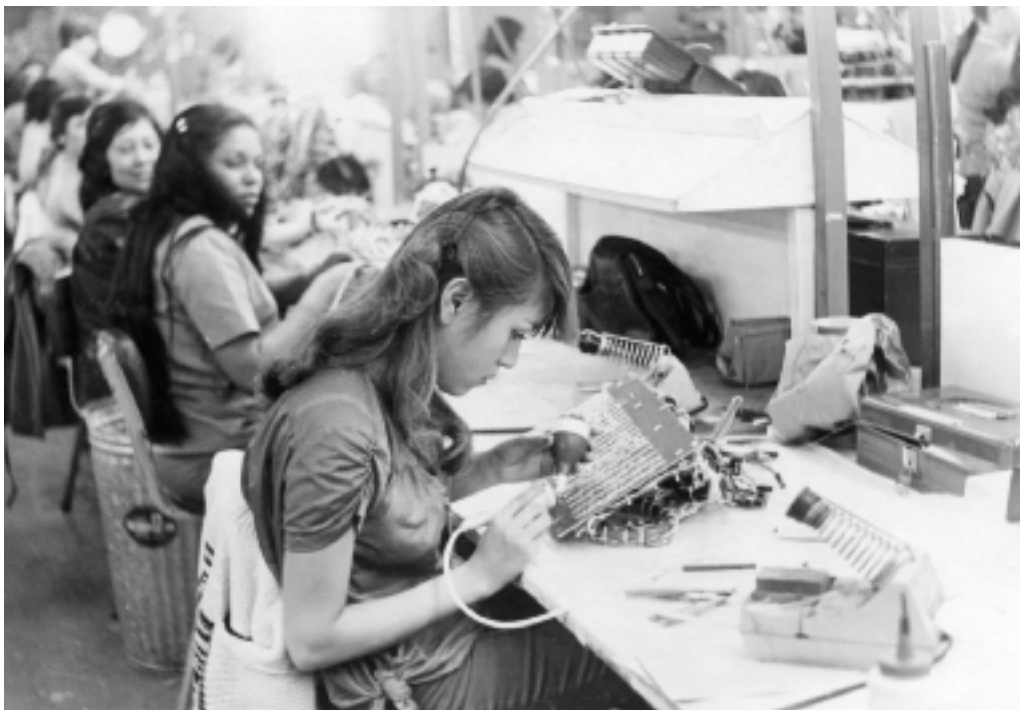
Las mujeres trabajan en plantas maquiladoras, ca. 1986.

do General sobre Aranceles Aduaneros y Comercio (GATT por sus siglas en inglés) fue la confirmación de ese viraje fundamental en la conducción económica del país. En un contexto de prosperidad de la economía norteamericana, la industria maquiladora, aquella que importa insumos y componentes, los arma en el país pero sólo a condición de exportarlos, entró en una etapa de auge; lo mismo ocurrió con las empresas automotrices que abrieron nuevas plantas en Aguascalientes, Sonora, Chihuahua y Coahuila. Muchas fábricas de la ciudad de México empezaron a cerrar o a mudarse a otros lugares. Esa ciudad, el mejor símbolo del proyecto modernizador impulsado por el Estado, comenzó a ver disminuida su riqueza económica.