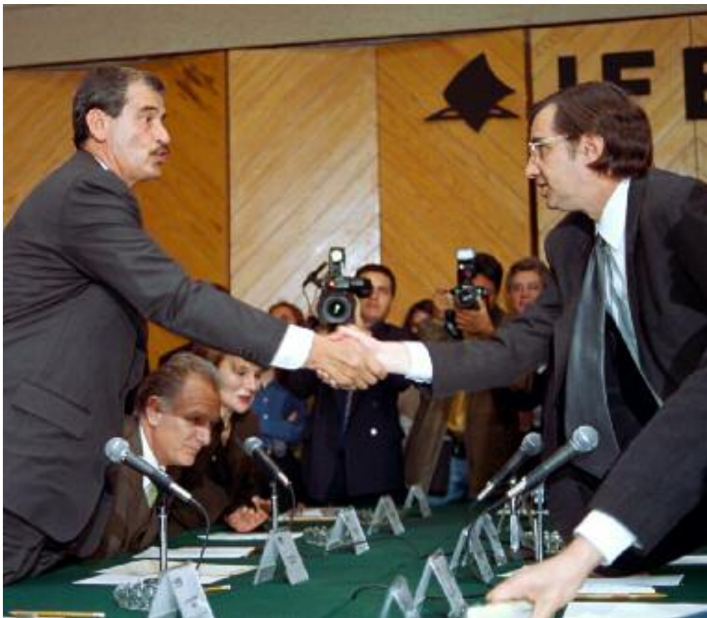
José Woldenberg y Vicente Fox en el momento de registrarse a la candidatura a la presidencia, 9 de enero de 2000.

a mediados de la década de 1980 alimentaron la crisis del arreglo político del país construido desde 1929. Si a principios de la década de 1930 México vivía sumido en una depresión económica mundial y en una grave inestabilidad interna, en el año 2000 reorganizaba su sistema político en paz y en un contexto de dificultades económicas quizá no tan graves como las de 1929 pero sí más prolongadas. Una de las ganancias más claras de la sociedad mexicana en este lapso fue precisamente su fortalecimiento hacia el final de siglo, lo que explica el cambio político del año 2000. Pero es claro que a esa sociedad más activa y fuerte le queda aún mucho camino por andar para lograr un cambio más amplio y profundo.