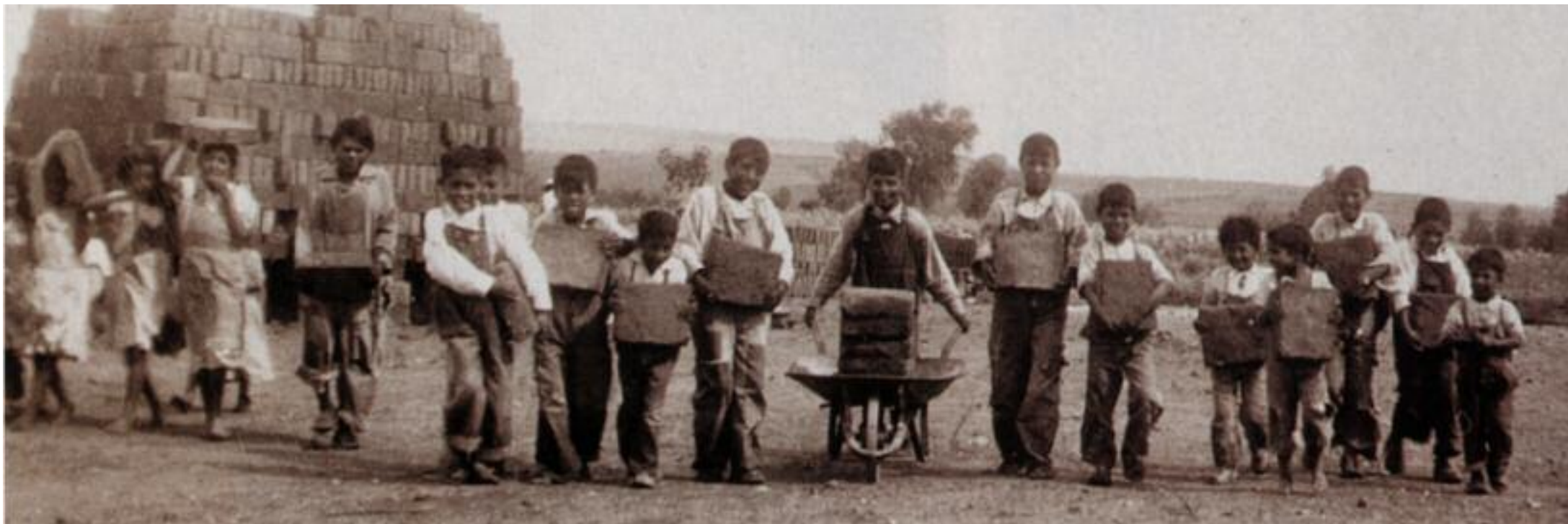
Escuela rural federal en Guanajuato, ca. 1935

tricidad (CFE), creada desde 1933, con el propósito de hacer frente a la creciente demanda de energía que las compañías eléctricas extranjeras no parecían interesadas en atender. En 1937 el gobierno federal inició la construcción de tres grandes presas: La Angostura en Sonora, Palmito en Durango y El Azúcar o Marte R. Gómez en Tamaulipas. El propósito de esas magnas obras era ampliar la superficie irrigada en el norte del país. Frente a la Universidad Nacional, que había ganado su autonomía en 1929 y que impugnaba las políticas gubernamentales, se creó el Instituto Politécnico Nacional (IPN) en ese mismo año de 1937 para diversificar la formación de los cuadros técnicos que requerían la industrialización y la expansión de la obra pública. El gobierno promovió también la construcción de infraestructura urbana (agua potable, alcantarillado, mercados) con el fin de mejorar las condiciones de vida de los habitantes de varias ciudades.