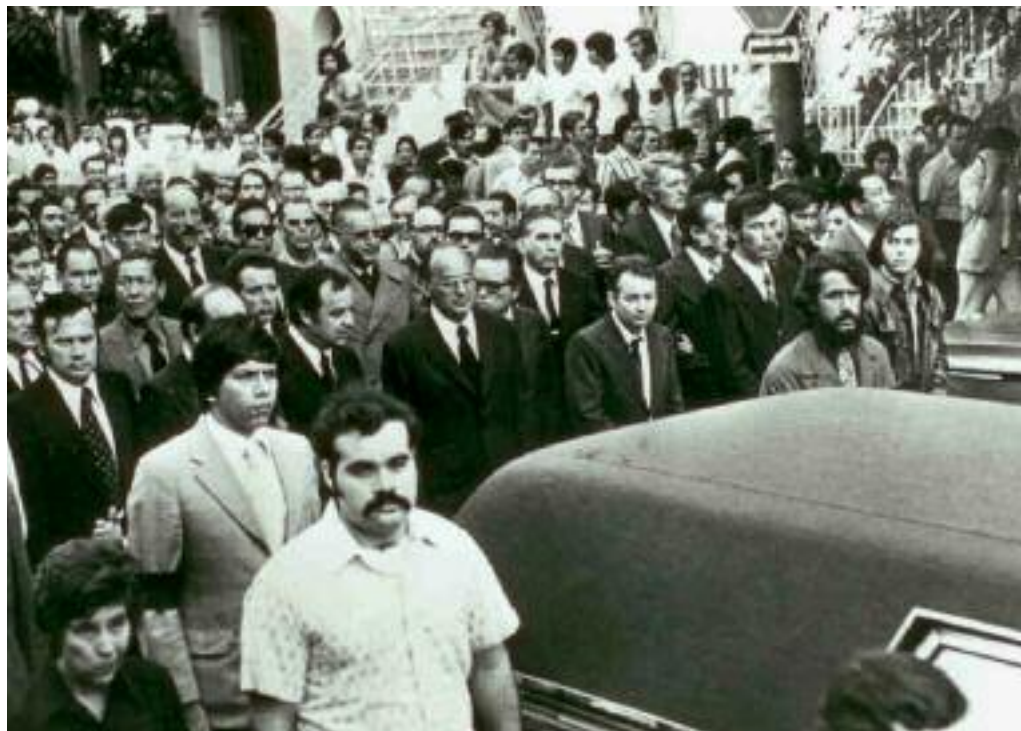
Luis Echeverría al salir del funeral del empresario Eugenio Garza Sada, septiembre de 1973.

ba un sector agropecuario exhausto e incapaz de respaldar la industrialización. Cada vez era mayor la diferencia entre lo que exportaba el país y lo que importaba. Es lo que se llama déficit de la balanza comercial. Por otro lado, el ahorro interno ya no era suficiente para financiar la expansión económica. Comparado con otros países, el Estado mexicano era muy pobre. Como los empresarios tampoco se mostraban interesados en arriesgar sus capitales, la situación fue tornándose cada vez más grave. Aunque el presidente Echeverría intentó hacer una reforma fiscal para recaudar más impuestos, los empresarios se opusieron de manera rotunda. Ante ese fracaso, otro indicio de la debilidad presidencial, el gobierno mexicano decidió pedir préstamos externos para mantener e incluso elevar el gasto público. El déficit de las finanzas públicas, o la diferencia entre ingresos y egresos, no dejaba de aumentar. Así comenzó a acumularse una carga que pesaría sobre las generaciones siguientes.