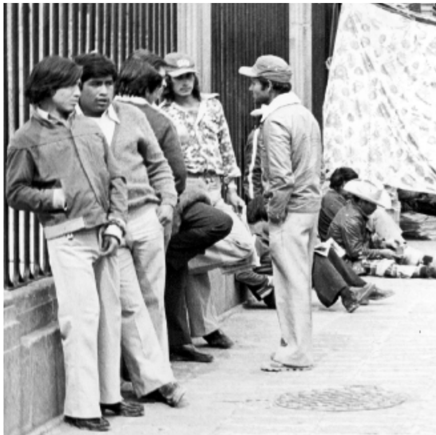
Desempleados en la ciudad de México, ca. 1982.

por el Banco Mundial y el Fondo Monetario Internacional para superar la crisis de 1982, el gasto y las inversiones públicas disminuyeron de modo significativo (por ejemplo, un tercio del gasto corriente en 1983) y se inició la venta de numerosas empresas paraestatales. Había que reducir a toda costa el déficit de las finanzas públicas. Ante el repunte inflacionario y las medidas de contención, los salarios cayeron vertiginosamente. Un problema antiguo asumió entonces modalidades dramáticas: el desempleo. Muchas familias comprendieron que tenían que vérselas por sí mismas. El resultado fue el crecimiento del autoempleo: cientos y luego miles de vendedores ambulantes se instalaron en banquetas, plazas, calles. En otras familias algunos varones decidieron emigrar a Estados Unidos de manera