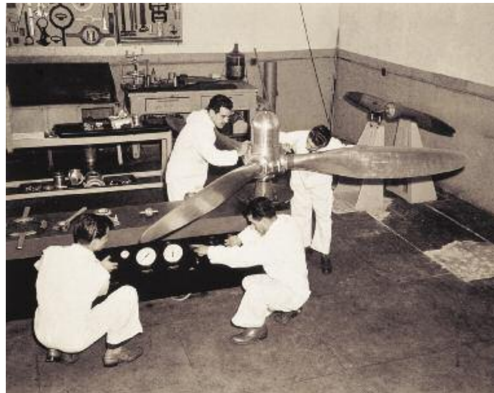
Trabajadores del taller de hélices de la Compañía Mexicana de Aviación, ca. 1950.

Después de 1940, además, la población se movilizó quizá como nunca antes en la historia del país, sobre todo del campo a la ciudad. Las localidades urbanas ofrecían mejores salarios y servicios públicos. Ya para 1960, según el censo de ese año, la mayor parte de los mexicanos vivía en las ciudades (en localidades mayores de 2500 habitantes). Ello era un indicador del cambio social que ocurría en el país y en casi todo el mundo por esas mismas fechas. La humanidad dejaba atrás el ámbito agrario. Entre 1930 y 1970 la población mexicana