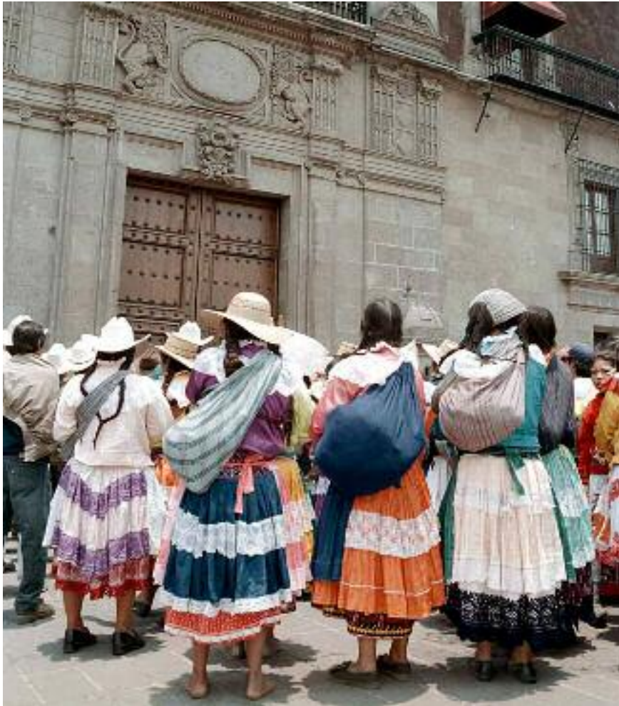
Mujeres indígenas de diferentes comunidades mexiquenses presentaron pruebas de las acciones que el PRI llevó a cabo en el Estado de México para inducir el voto, 17 de mayo de 2000.

plena al Instituto Federal Electoral (IFE). Por primera vez desde 1946 el gobierno federal no tenía el control de las elecciones, que pasaba ahora a manos de ciudadanos sin partido. El nuevo IFE expresaba el agotamiento del viejo arreglo político basado en la hegemonía del PRI y su vinculación con el presidente de la República; también dejaba ver la decisión clara de crear uno nuevo, acorde con las exigencias de una ciudadanía cada vez más activa. Lo mismo indicaban las reformas que dieron lugar a la elección del jefe de gobierno del Distrito Federal, una de las