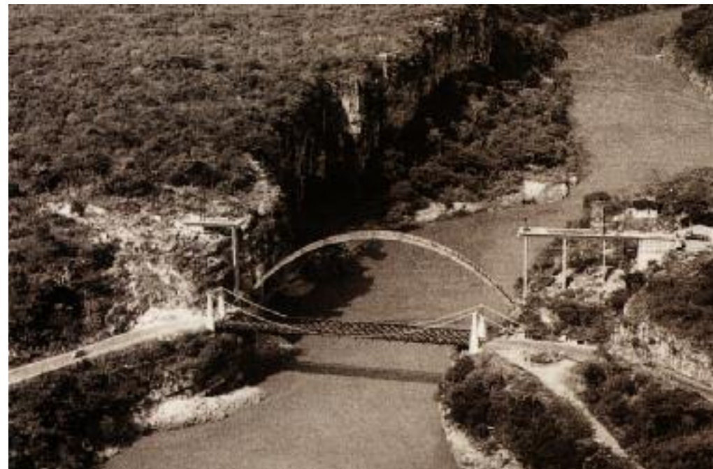
Boca del Cañón del Sumidero, con el antiguo puente Belisario Domínguez y la obra falsa del nuevo, ca. 1954. Fundación ICA. Páginas siguientes: Vista aérea de Ciudad Universitaria , 23 de enero 1954. Fundación ICA.

En esa febril transformación social había sectores inconformes. El crecimiento económico beneficiaba sólo a una parte de la población, principalmente la de las ciudades, mientras que en el campo mostraba rezagos. A la vez que se expandía la clase media, en las ciudades empezaron a formarse enormes