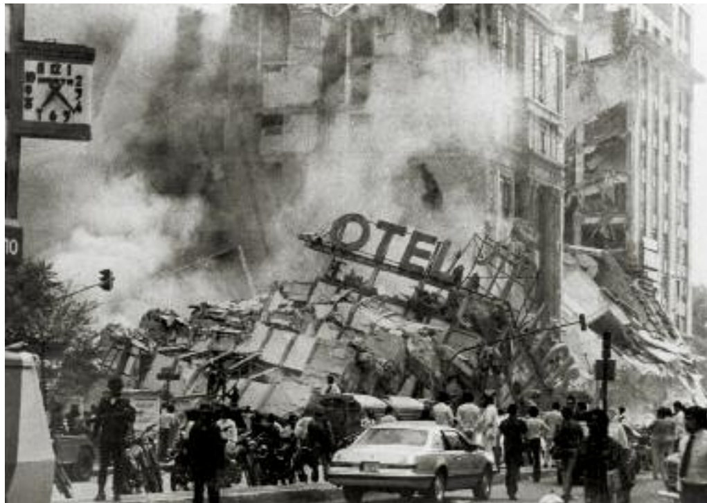
Hotel Regis, ciudad de México, Francisco Daniel, 19 de septiembre de 1985.

marchas y huelgas de hambre. No es que antes no hubiera ese tipo de actos de protesta, pero ahora ocurrían con mayor frecuencia y eran protagonizados no sólo por obreros y campesinos empobrecidos, sino también por sectores empresariales y de la clase media urbana y agraria.