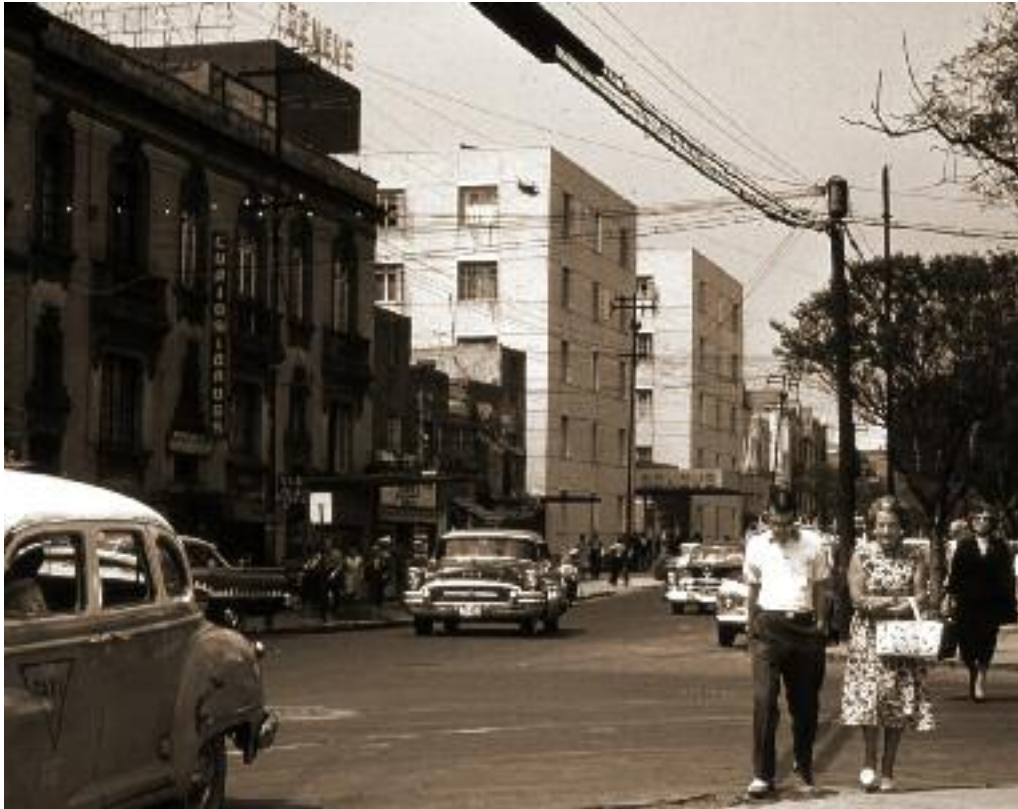
Calles de Londres y Génova en la ciudad de México, ca. 1950.

jubilación. Lo mismo puede decirse de los burócratas federales. En 1925 se creó la Dirección de Pensiones, que en 1959 se transformó en el Instituto de Seguridad y Servicios Sociales para los Trabajadores del Estado (ISSSTE).