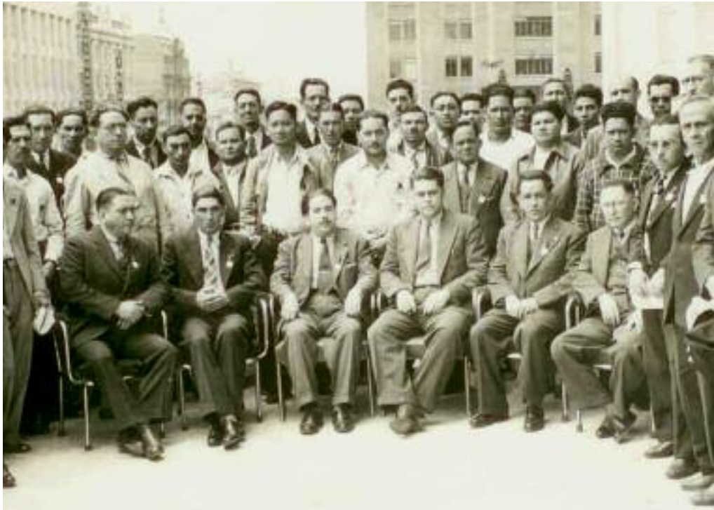
Fidel Velázquez, líder de la CTM, ca. 1941.

control gubernamental sobre la clase obrera. Otra forma de favorecer la industrialización fue mediante la regulación de los precios de los alimentos en las ciudades. Para tal fin se crearon varias instituciones, como el Comité Regulador del Mercado de las Subsistencias en 1938, la Compañía Exportadora e Importadora Mexicana, en 1949, y más tarde, en 1961, la Compañía Nacional de Subsistencias Populares (Conasupo).