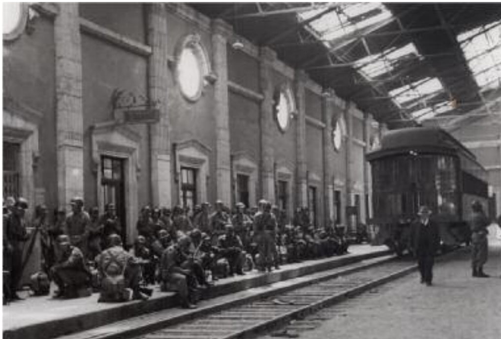
El ejército tomó las instalaciones de los ferrocarriles ocupadas anteriormente por huelguistas, 1959.

torales que mostraban un incipiente desgaste de los métodos autoritarios del partido oficial y en general del gobierno federal. En 1959 una gran huelga ferrocarrilera fue reprimida por el ejército; varios de sus dirigentes, entre ellos Demetrio Vallejo, fueron a dar a la cárcel acusados del delito de disolución social y allí permanecieron durante años. A tono con las ideas que predominaban en Estados Unidos y México en esos años por el enfrentamiento con la Unión Soviética (la llamada guerra fría), los ferrocarrileros fueron acusados de comunistas. En 1962 el ejército acribilló al líder campesino independiente Rubén Jaramillo y a su familia.