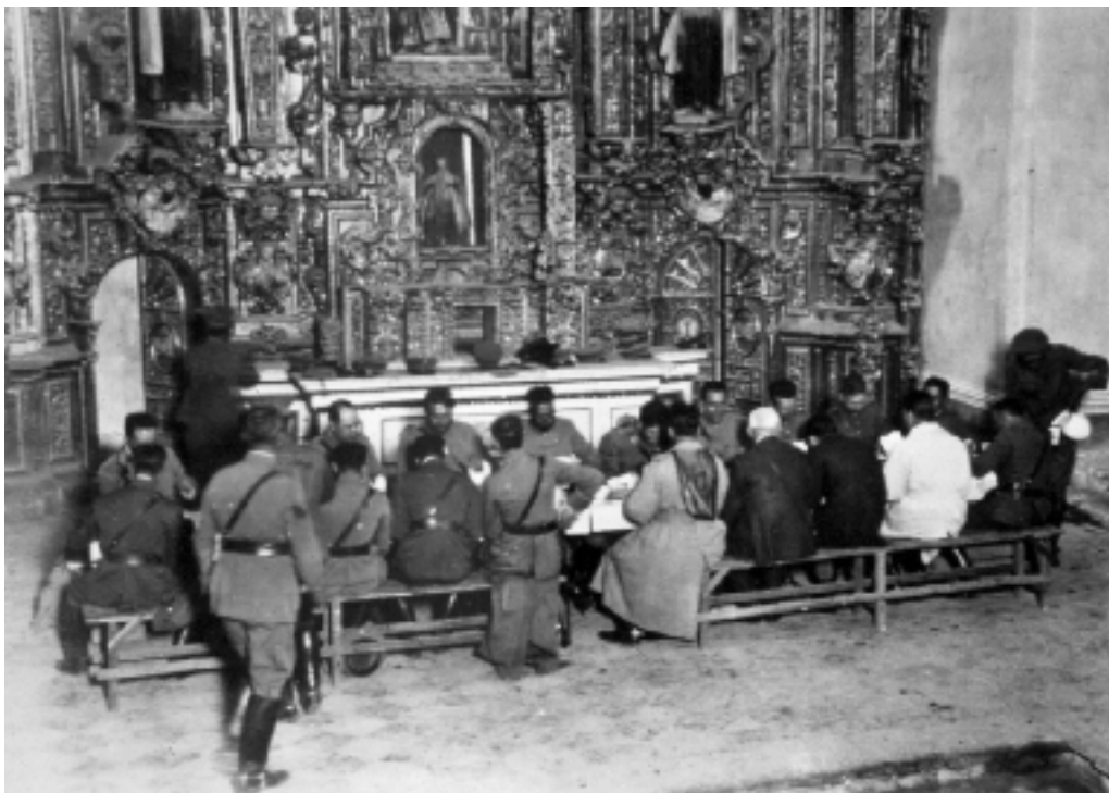
El general Joaquín Amaro y un grupo de oficiales federales comiendo frente al altar de una iglesia, ca. 1928.

más del esfuerzo por formar un Estado fuerte. Como principal ingrediente, éste debía contar con un centro político capaz de ejercer autoridad plena sobre los diversos grupos sociales dispersos a lo largo del territorio nacional. El centro sería el gobierno federal, encabezado por el presidente de la República. Durante el siglo XIX los grupos gobernantes habían fallado en la consecución de ese objetivo político. Si a lo largo del periodo porfiriano el gobierno federal había logrado acrecentar su fuerza, la Revolución de 1910 la había debilitado y fragmentado en gran medida. ¿Cómo construir un núcleo político fuerte, capaz de evitar rebeliones como la de Agua Prieta de 1920, la delahuertista de 1923-1924, la escobarista de 1929 y de inhibir el fortalecimiento de caudillos y caciques en las distintas regiones del país?