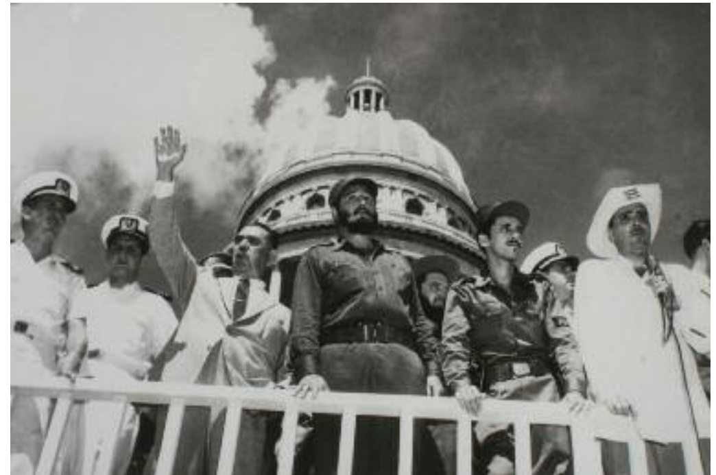
Lázaro Cárdenas con Fidel Castro en La Habana, 26 de julio de 1959.

Este clima de gran inconformidad se vio alimentado por la Revolución cubana. Guerrilleros encabezados por Fidel Castro tomaron el poder en enero de 1959, derrocando al dictador Fulgencio Batista. La tensión con el gobierno estadounidense fue agravándose hasta que en 1961 Castro se declaró marxista-leninista. Esa experiencia revolucionaria nutrió los ideales