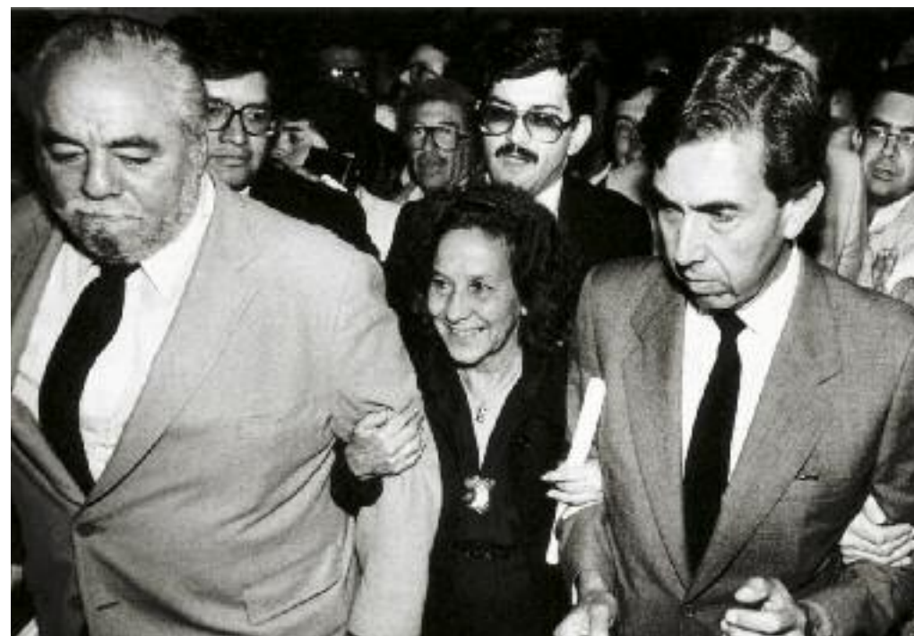
De izquierda a derecha: Manuel Clouthier, Rosario Ibarra de Piedra y Cuauhtémoc Cárdenas

En estas condiciones y con una inflación de casi 160% en 1987 se inició la campaña para las elecciones presidenciales de 1988. De una división del PRI surgió la Corriente Democrática encabezada por Cuauhtémoc Cárdenas, hijo del ex presidente Lázaro Cárdenas, quien había sido militante del partido oficial