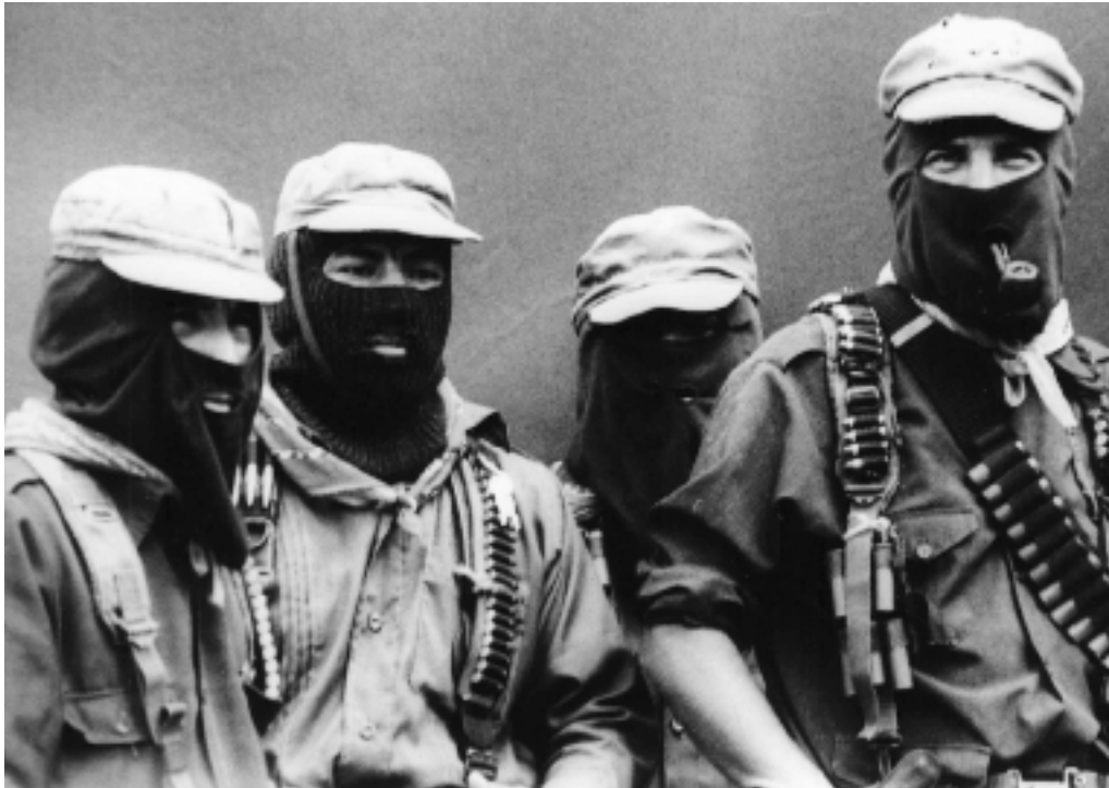
La Comandancia General del EZLN durante la inauguración de la Convención Nacional Democrática, 1994.

el 1 de enero de 1994. Todo parecía ir sobre ruedas, pero 1994 fue un año de sorpresas.