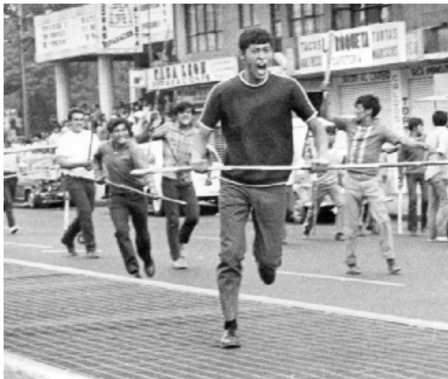
Marcha estudiantil en la ciudad de México reprimida por el grupo paramilitar llamado "Halcones", Armando Salgado, 10 de junio de 1971. Archivo Procesofoto.

durante décadas, es ilustrativa de ese control informativo. Otro episodio de represión de estudiantes, ocurrido el 10 de junio de 1971 en la ciudad de México, ratificó la distancia entre los opositores e inconformes y el Estado surgido de la Revolución de 1910.