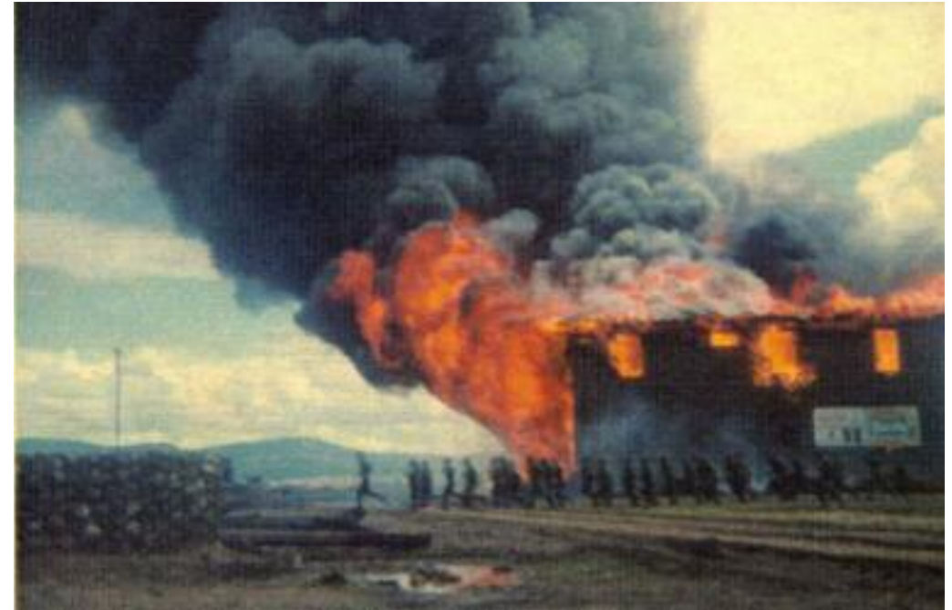
Quema del cuartel de Ciudad Madera, Chihuahua, por miembros del ejército después del asalto de la guerrilla encabezada por Pablo Gómez y Arturo Gámiz, 23 de septiembre de 1965. Comité Primeros Vientos.

Pero sin duda el acontecimiento clave en los desajustes del arreglo político nacional fue el movimiento estudiantil de 1968, un año de grandes protestas de jóvenes en diversos lugares del mundo. Ese movimiento, y sobre todo su desenlace en la matanza del 2 de octubre en Tlatelolco, mostró la distancia