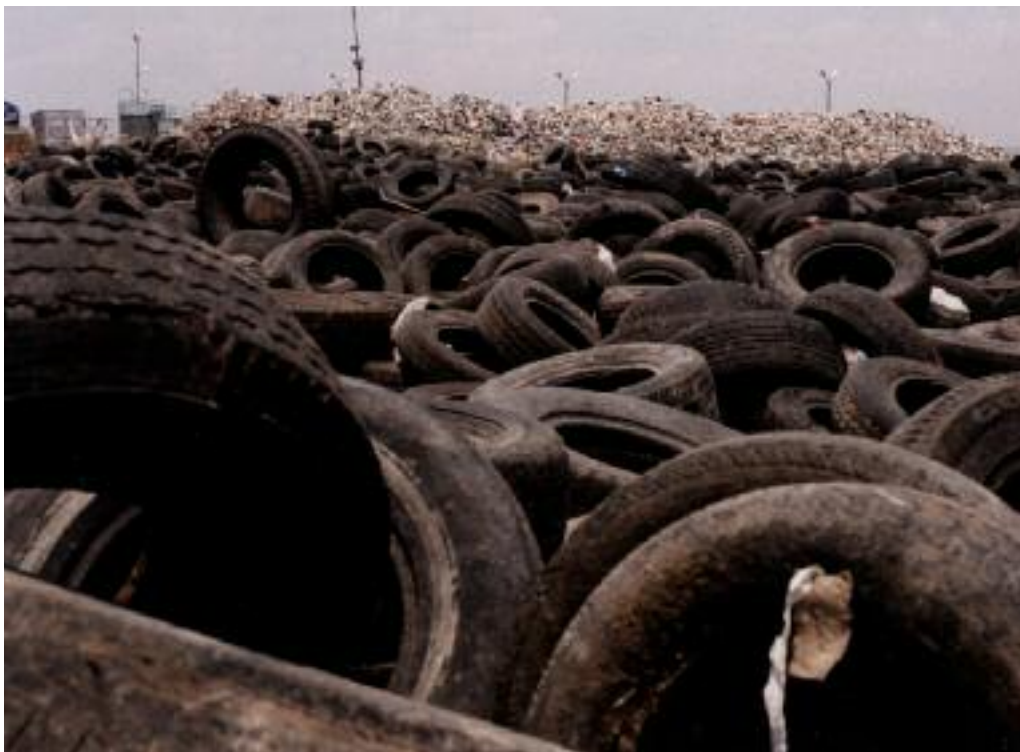
Desechos de llantas causantes de daños al medio ambiente, ca. 1980.

sostenida del precio del barril, quizá hasta setenta dólares. Todo podría pagarse.