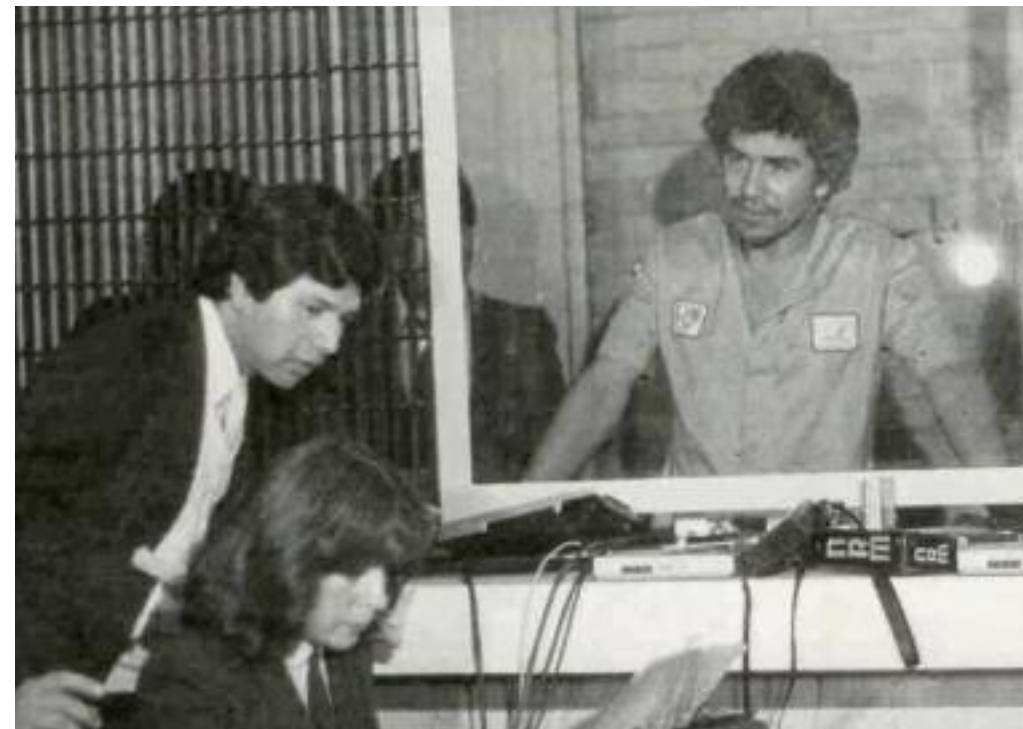
Rafael Caro Quintero, en el Reclusorio Norte de la ciudad de México, 1985.

Los temblores del 19 y 20 de septiembre de 1985 sacudieron buena parte del centro-oeste del país. En la ciudad de México los muertos se contaron por miles. La respuesta del gobierno fue débil y tardía. En cambio, la reacción de los vecinos fue masiva. El contraste entre la debilidad gubernamental y la fortaleza de la sociedad no pasó inadvertido. Parecía que el gobierno, atribulado por la economía, carecía de capacidad de maniobra. Esa misma impresión se tenía en otro terreno, porque las actividades del narcotráfico empezaron a volverse asunto más y más cotidiano. Durante las décadas de 1980 y 1990 ese negocio se extendió a causa del creciente consumo