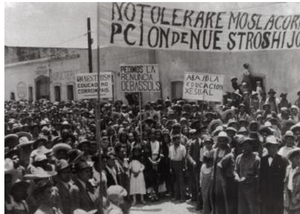
Manifestación contra la educación sexual y en la que se pide la renuncia de Narciso Bassols en la ciudad de México, ca. 1933, © SINAFO-Fototeca Nacional.

En el contexto de movilizaciones de obreros y campesinos en buena parte del territorio, nació la Confederación de Trabajadores de México (CTM) en 1936, cuya ideología reivindicaba la lucha de clases. Su dirigente, Vicente Lombardo Toledano, se convirtió en un cercano aliado del gobierno cardenista. Dos años más tarde nació la Confederación Nacional Campesina (CNC), con el profesor Graciano Sánchez a la cabeza. La intención de Cárdenas era organizar a las clases trabajadoras y vincularlas