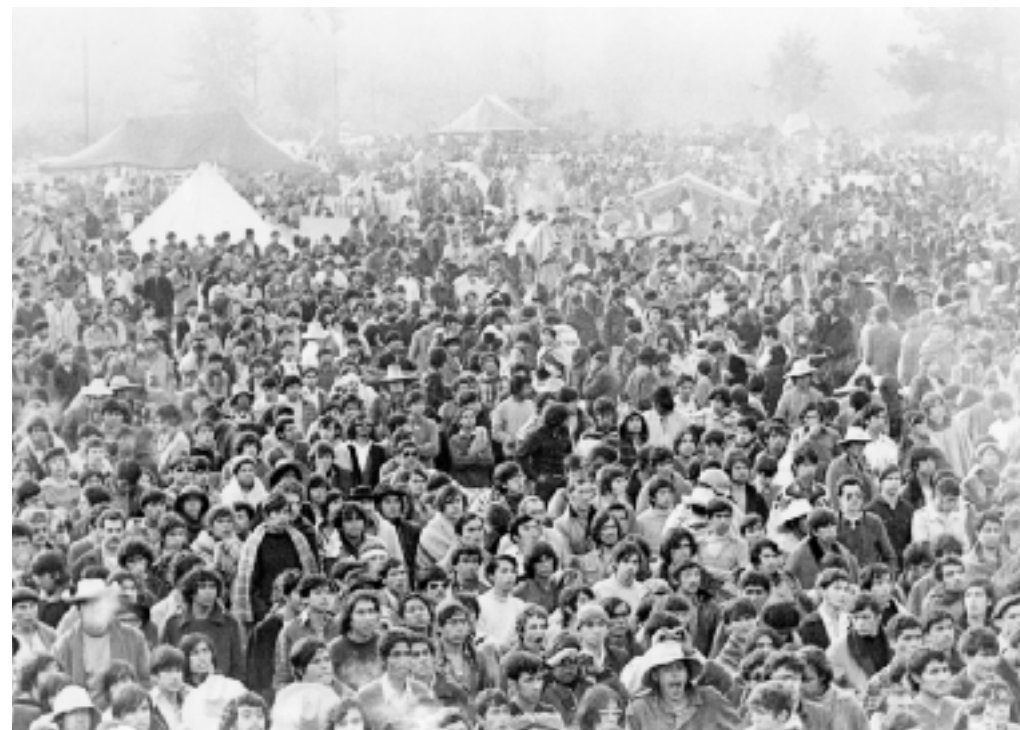
Concierto de Avándaro

En México, durante los mandatos de los presidentes Luis Echeverría (1970-1976) y José López Portillo (1976-1982), ambos oriundos de la capital, el gobierno intentó atraer a los grupos inconformes por medio de amnistías, apertura de nuevos centros de educación superior (como la Universidad Autóno-