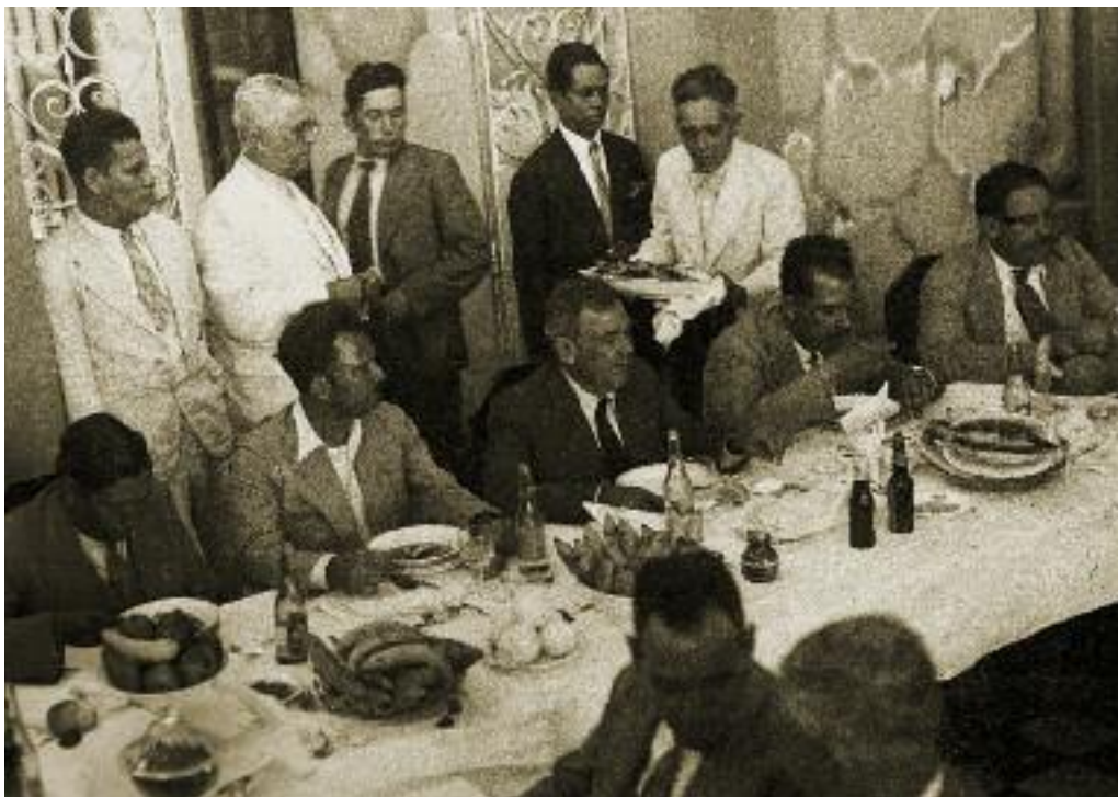
Banquete en el que participaron Saturnino Cedillo, Tomás Garrido, Plutarco Elías Calles y Lázaro Cárdenas en Tabasco, ca. 1932.

Durango y Coahuila; el valle del Yaqui, al sur de Sonora; el valle de Mexicali, en Baja California, y la zona henequenera de Yucatán.