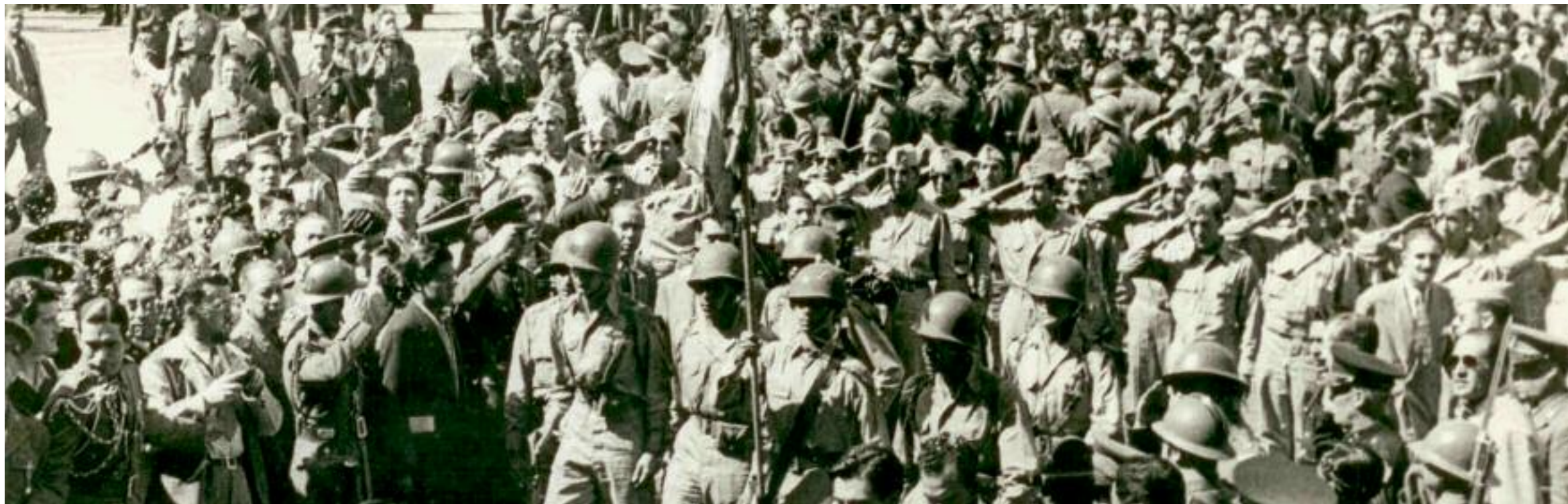
Escuadrón 201 en la Plaza de Armas, 1946. Archivo Fotográfico El Universal. Páginas siguientes: Braceros, Hermanos Mayo, ca. 1945. Archivo Cuartoscuro.

viética). Fue entonces cuando se impuso el servicio militar obligatorio.