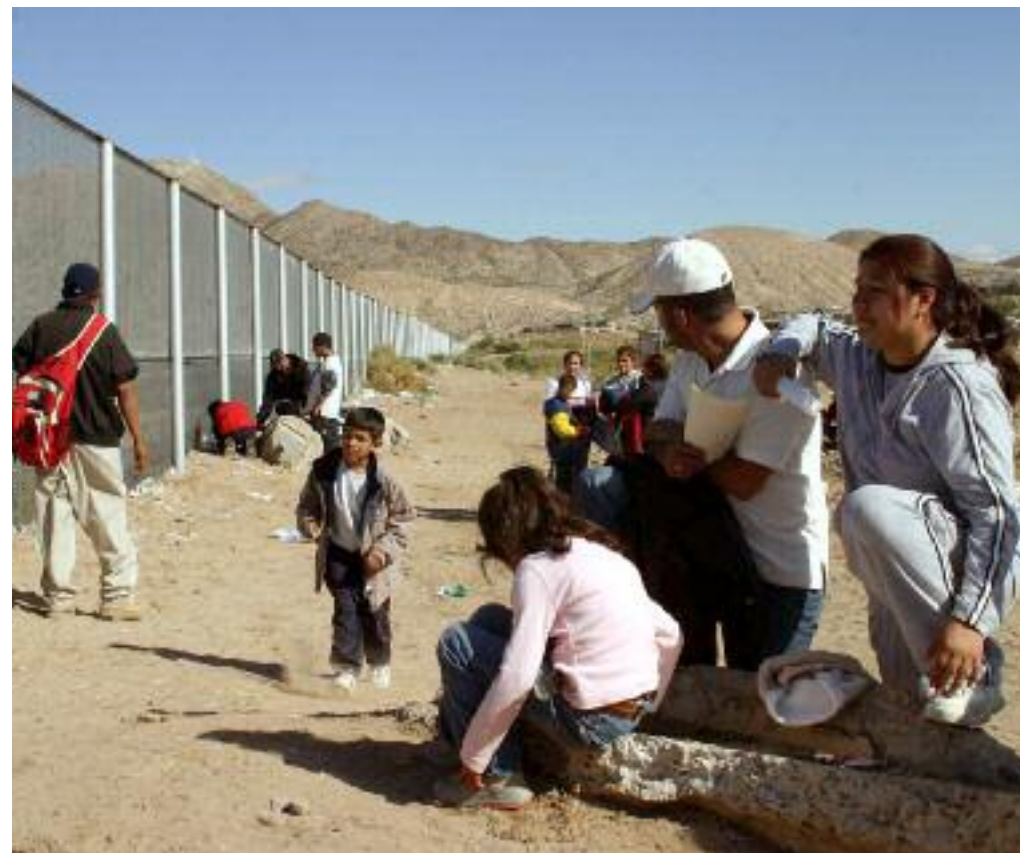
Familia en espera de cruzar la frontera hacia los Estados Unidos, Ciudad Juárez, Chihuahua, J. Guadalupe Pérez, 2000. Archivo Cuartoscuro.

Hacia el fin del siglo XX tres cuartas partes de la población vivían en las ciudades, pero al mismo tiempo el resto se dispersaba en un número asombroso de pequeñas localidades rurales. Las mujeres, que cada vez tenían menos hijos (el promedio descendió de 6.1 en 1974 a 2.5 en 1999), se habían sumado de manera masiva al mercado de trabajo. El analfabetismo había descendido de 45% en 1960 a 9.5% en el año 2000. Los protestantes, organizados en distintas iglesias, eran cada vez más numerosos, sobre todo en el Sureste. Los divorcios y el número de hogares encabezados por mujeres aumentaron. En otro terreno, en el de la opinión pública, la apertura de los medios de comunicación, la competencia entre ellos y la independencia respecto a las posturas gubernamentales reforzaron la participación de ciudadanos en diversos campos, como la defensa de