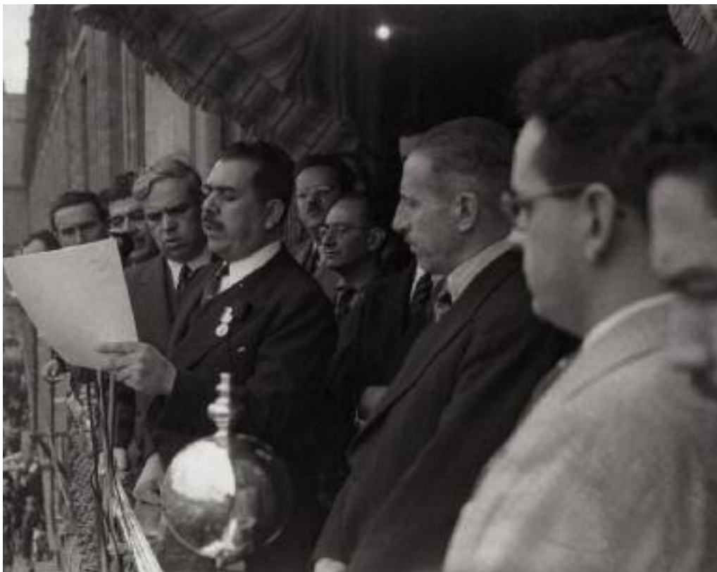
Lectura del decreto de expropiación de la industria petrolera en el Zócalo capitalino, 18 de marzo de 1938.

propiación nació la empresa Petróleos Mexicanos (Pemex), cuya fragilidad inicial obligó al gobierno a subsidiarla de distintas maneras.