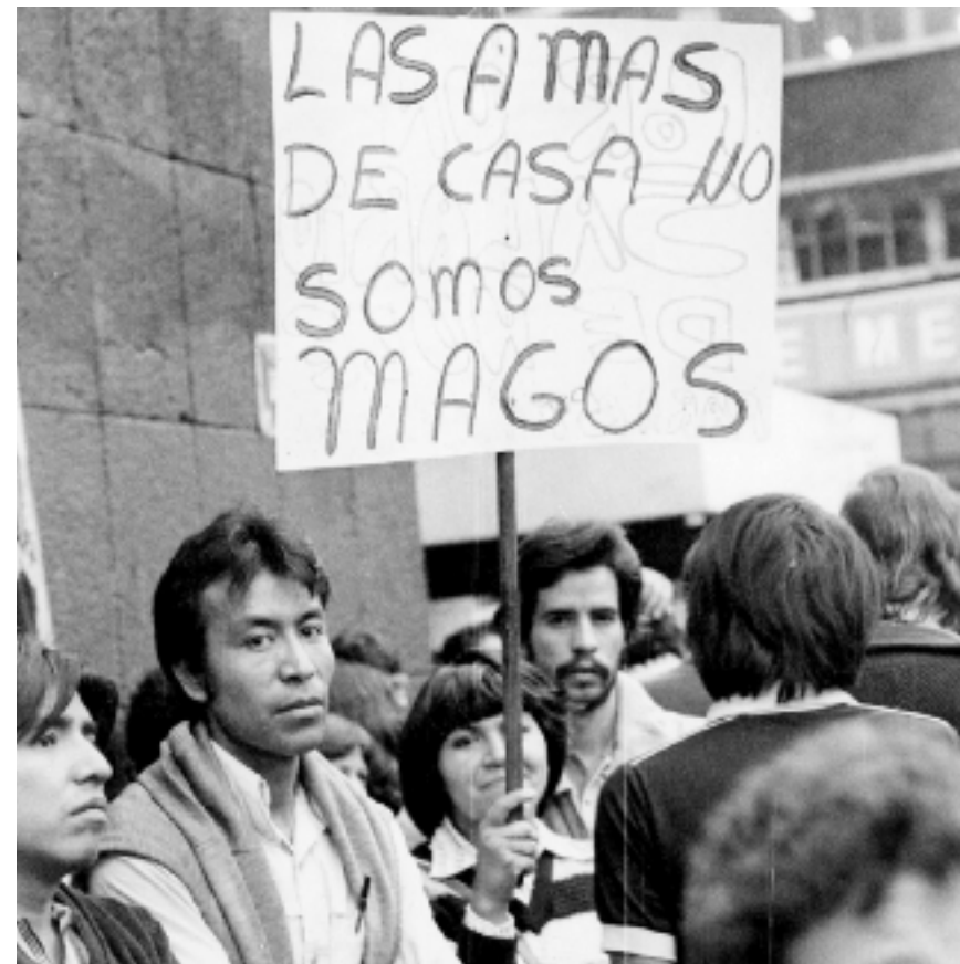
Manifestación contra el alza de precios, ca. 1982.

por el Banco Mundial y el Fondo Monetario Internacional para superar la crisis de 1982, el gasto y las inversiones públicas disminuyeron de modo significativo (por ejemplo, un tercio del gasto corriente en 1983) y se inició la venta de numerosas empresas paraestatales. Había que reducir a toda costa el déficit de las finanzas públicas. Ante el repunte inflacionario y las medidas de contención, los salarios cayeron vertiginosamente. Un problema antiguo asumió entonces modalidades dramáticas: el desempleo. Muchas familias comprendieron que tenían que vérselas por sí mismas. El resultado fue el crecimiento del autoempleo: cientos y luego miles de vendedores ambulantes se instalaron en banquetas, plazas, calles. En otras familias algunos varones decidieron emigrar a Estados Unidos de manera