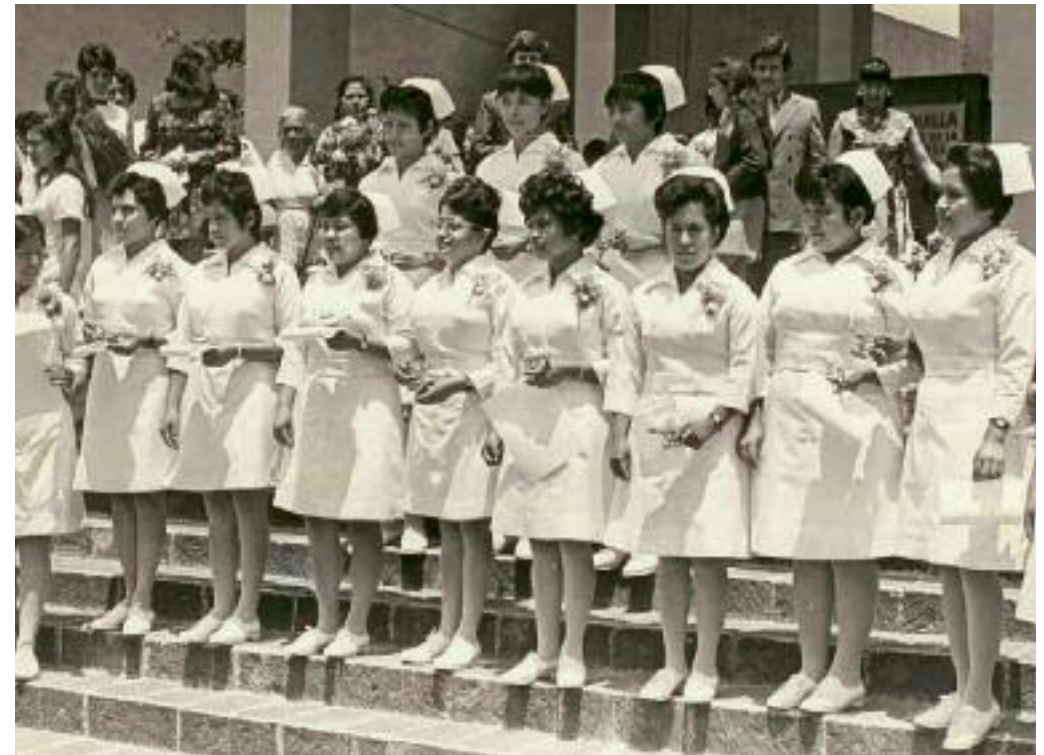
Estudiantes de enfermería del Hospital del ISSSTE, ca. 1963.

Crecimiento económico y estabilidad política eran los signos más destacados del país en estos años. Al gobierno del mexicano Adolfo López Mateos (1958-1964) le correspondió organizar en 1960 los festejos del 50 aniversario de la Revolución de 1910. La clase gobernante se mostraba orgullosa de sus logros en la conducción de la nación. Podía presumir de avances en materia de salud, educación e infraestructura, y de fortalecimiento de la ciudadanía gracias al otorgamiento del derecho al voto a las mujeres en 1953. En el tema de salud, por ejemplo, la mortalidad infantil se había reducido de manera drástica, de veintisiete a doce por cada mil habitantes. Ya no era tan común como antes que las familias perdieran hijos. Los asegurados del IMSS sumaban cuatro millones y el ISSSTE daba cobertura a otros 500 000. El analfabetismo se había reducido de 62% en 1930 a 45% en 1960. La superficie irrigada gracias a inversiones del Estado sumaba 1.4 millones de hectáreas. Desde 1950 podía recorrerse el territorio nacional por vía terrestre, de la frontera con Guatemala, en Chiapas, a Ciudad Juárez, Chihuahua. La producción de petróleo casi se había triplicado desde 1938 y la generación de energía era siete veces mayor