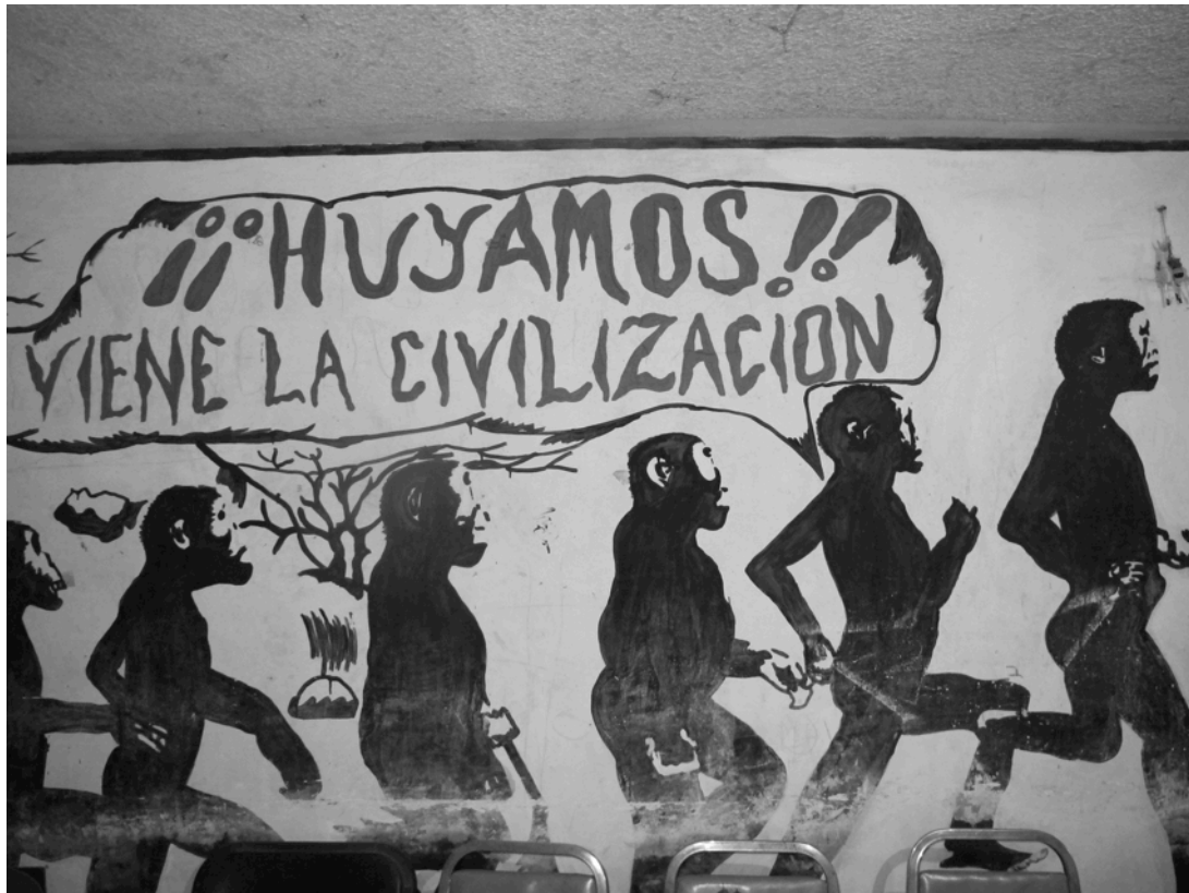
Mural con crítica social.

Se trata de una experiencia más horizontal que vertical, porque incluye a la población y a sus actores más dinámicos quienes tienen el control sobre su realización y difusión, más que pasar como audiencias pasivas, su papel es el de catalizadores de información y iniciativas para su producción;