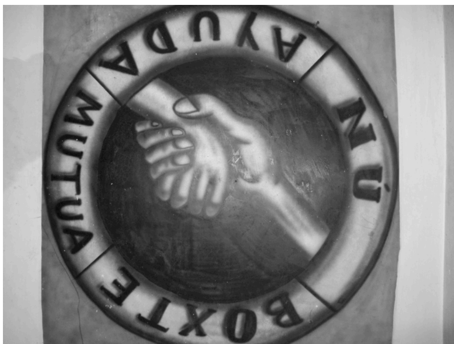
El escudo de Ayuda Mutura. Material del autor.

Con la ayuda de la beca solicitada al Instituto Mexiquense de Cultura se espera producir y realizar un video documental como continuación del proyecto Rebeldes del Maguey apoyado en 2014 y nuevamente ser distribuido entre aquellos participantes e interesados en la problemática social y cultural de los jóvenes punk que originalmente se han apropiado de una subcultura y reintegrado en sus tradiciones comunitarias la lógica y apuesta musical y colectiva del proyecto contracultural: ¡Hazlo tú mismo!