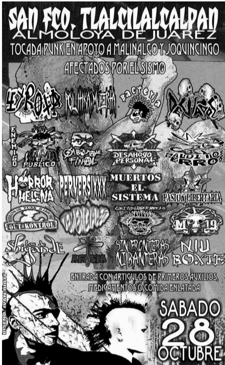
Cartel de una tocada fuera del guetto.

participantes en contra de los poderes morales, políticos y culturales instituidos. Su base ha sido la marginalidad y la resistencia en espacios limítrofes y vecinales como en la ciudad capital del Estado de México.