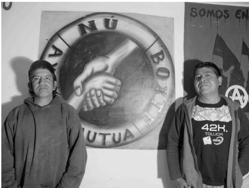
Integrantes de Ayuda Mutua. Material del autor.

funciones comunitarias o los espacios de la vida académica común (aulas y congresos) y aparecer en festivales o tiempos televisivos que rastrean su vitalidad.