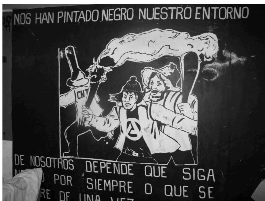
Uno de los murales en casa de Lukas Robles.

investigador del Departamento de Estudios Culturales del Colegio de la Frontera Norte 3 .