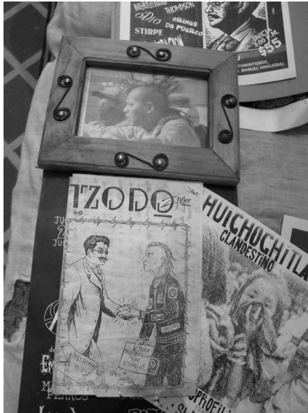
Los carteles y fanzines medios de comunicación de esta subcultura.