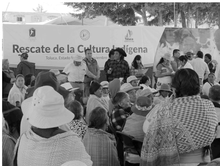
Un evento cultural organizado por autoridades locales.

instituciones educativas y de desarrollo social. La exclusión y prohibición de mantener viva la respectiva etnia, ha podido encontrar un enclave de defensa identitaria en la espontaneidad del punk otomí. A decir de los miembros del antes llamado Batalla Negativa: “lo hacemos para decir que aquí estamos todavía, que no hemos muerto”.