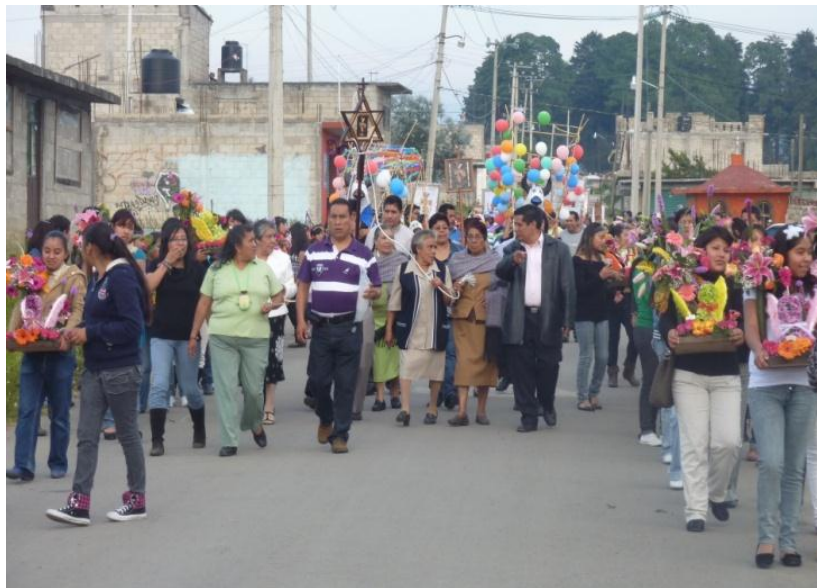
RHB, trabajo de campo 2017