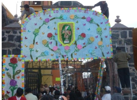
RHB, trabajo de campo 2017