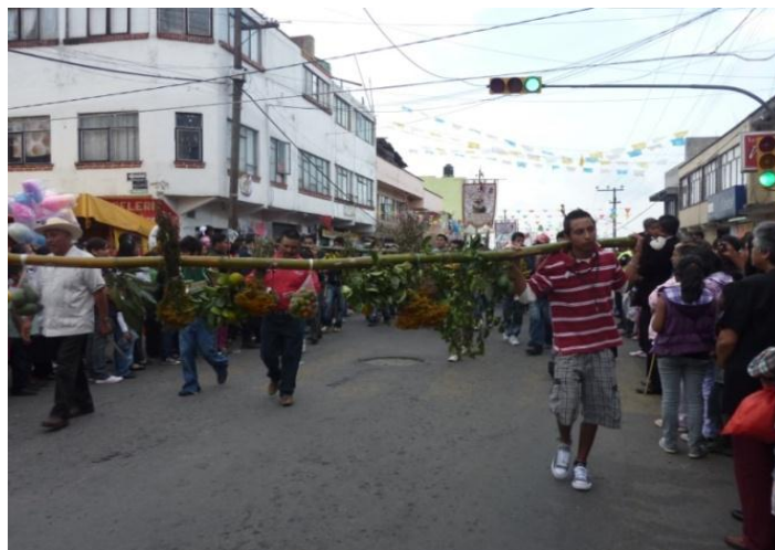
RHB, trabajo de campo 2017