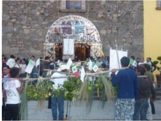
RHB, trabajo de campo 2017