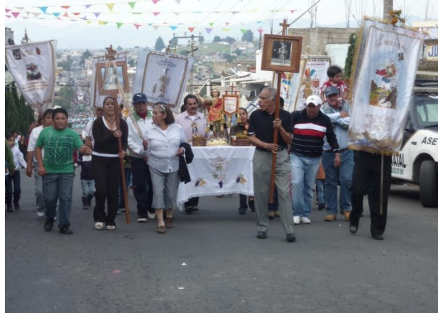
RHB, trabajo de campo 2017