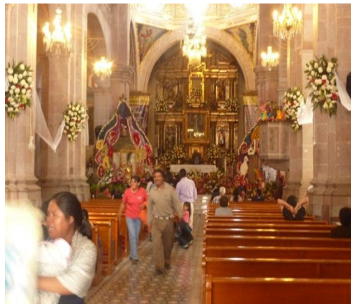
RHB, trabajo de campo 2017