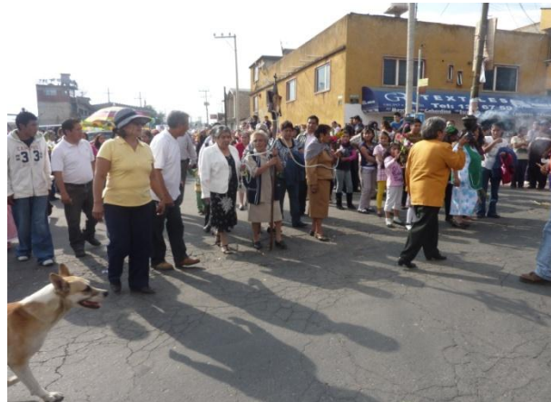
Foto 13. Salida del paseo

La repartición de la fruta se efectúa en el paseo pero de igual forma se realiza dentro del templo, esta repartición se hace solo a la gente de este lugar, la fruta que reparten en el paseo es para le gente que viene de fuera y también a la gente local, de esta manera es como la fruta obtenida por el ritual de estos dos municipios se hace, esta fruta es algo que se ha ido fomentando por las tradiciones que aún no han desaparecido en este lugar.