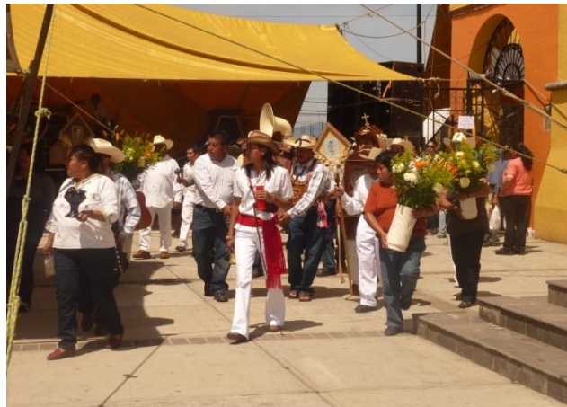
RHB, trabajo de campo 2017