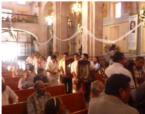
RHB, trabajo de campo 2017