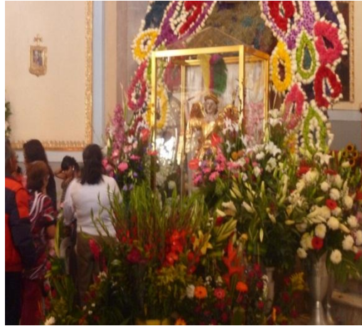
RHB, trabajo de campo 2015