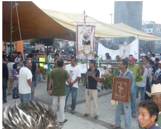
RHB, trabajo de campo 2017