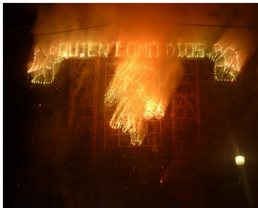
Foto 4. Castillo a veneración a San Miguel Arcángel

Uno de los grupos, son los encargados de recolectar el dinero para la compra del castillo y se conforma por 5 personas de la misma comunidad, para veneración a la imagen, este grupo tiene la finalidad de pasar a cada una de las casas a pedir la donación para la compra de dicho espectáculo, El grupo está conformado por voluntarios que se enlistan para poder hacer la colecta, permite identificar cuáles son las personas que apoyaron y las que no apoyaron, el castillo es algo fundamental de la fiesta ya que la gente cuenta que, “si no hay castillo el patrón San Miguel Arcángel puede que se moleste, por la falta de fuegos pirotécnicos” cada año la estructura de los castillos se pone como algo representativo o como gratitud por parte de la gente.