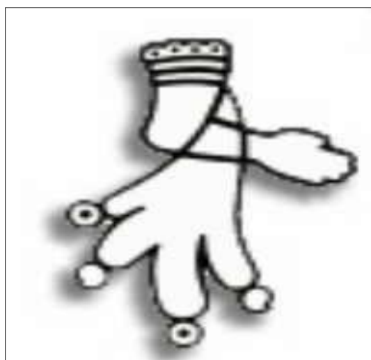
Imagen 1, Glifo de Almoloya del Río