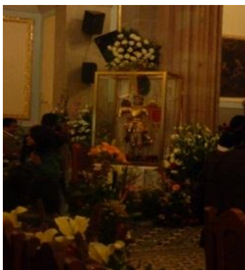
RHB, trabajo de campo 2015