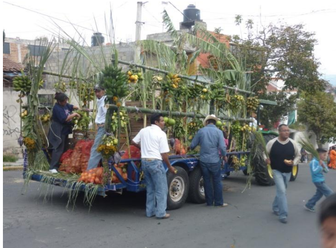
RHB, trabajo de campo 2017