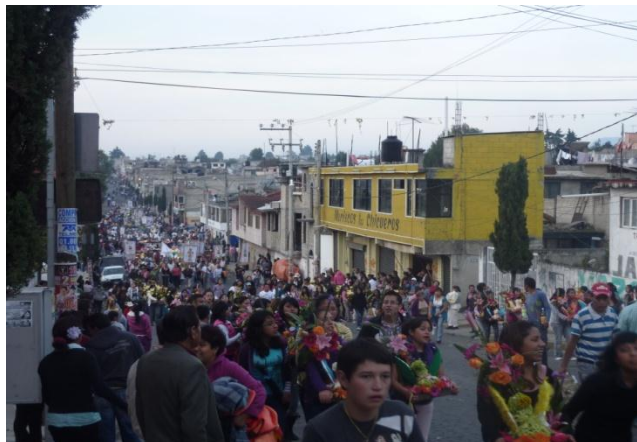
Foto 14. Recorrido del paseo