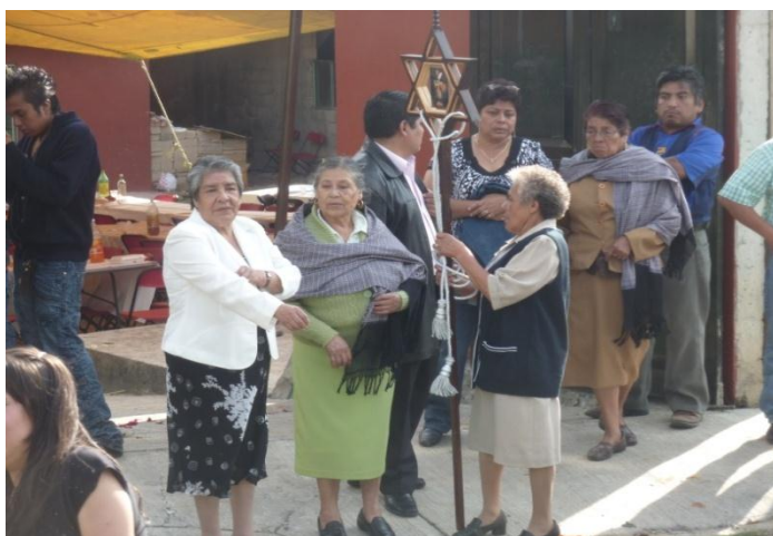
RHB, trabajo de campo 2017