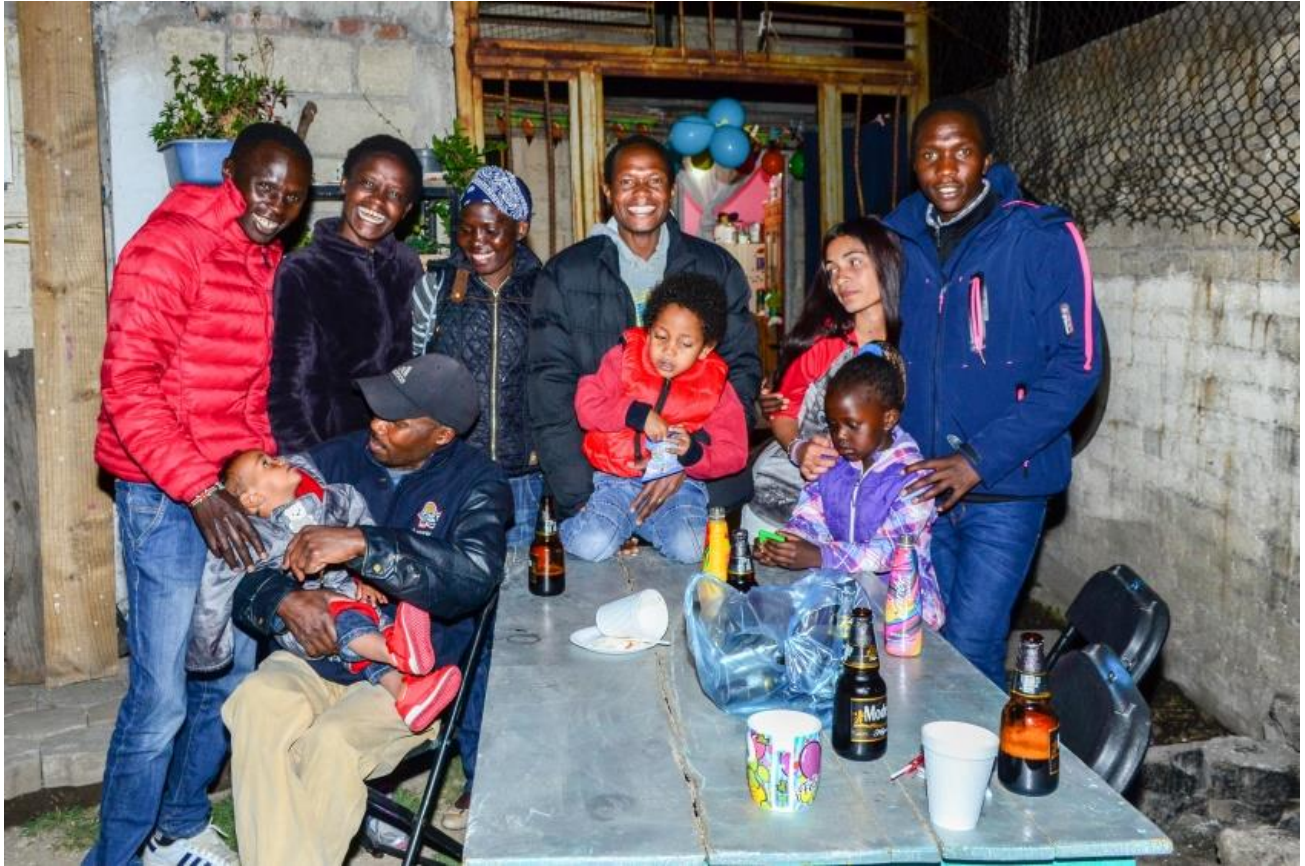
Por el cumpleaños del pequeño Kipchoge algunos kenianos se reunieron para celebrar.

En Toluca existe una comunidad que poco a poco ha ido creciendo y a pesar de no vivir juntos, todos viven cerca del parque alameda 2000 y otro cerca del parque Sierra Morelos, cada quién sabe perfectamente donde vive cada uno, y pese a que no todos se llevan bien, cuando saben de algún problema se hace una reunión para exponer el tema donde cada uno coopera con dinero, y este dinero se le envía al afectado ya sea que este dentro del país o si es necesario se envía hasta Kenia.