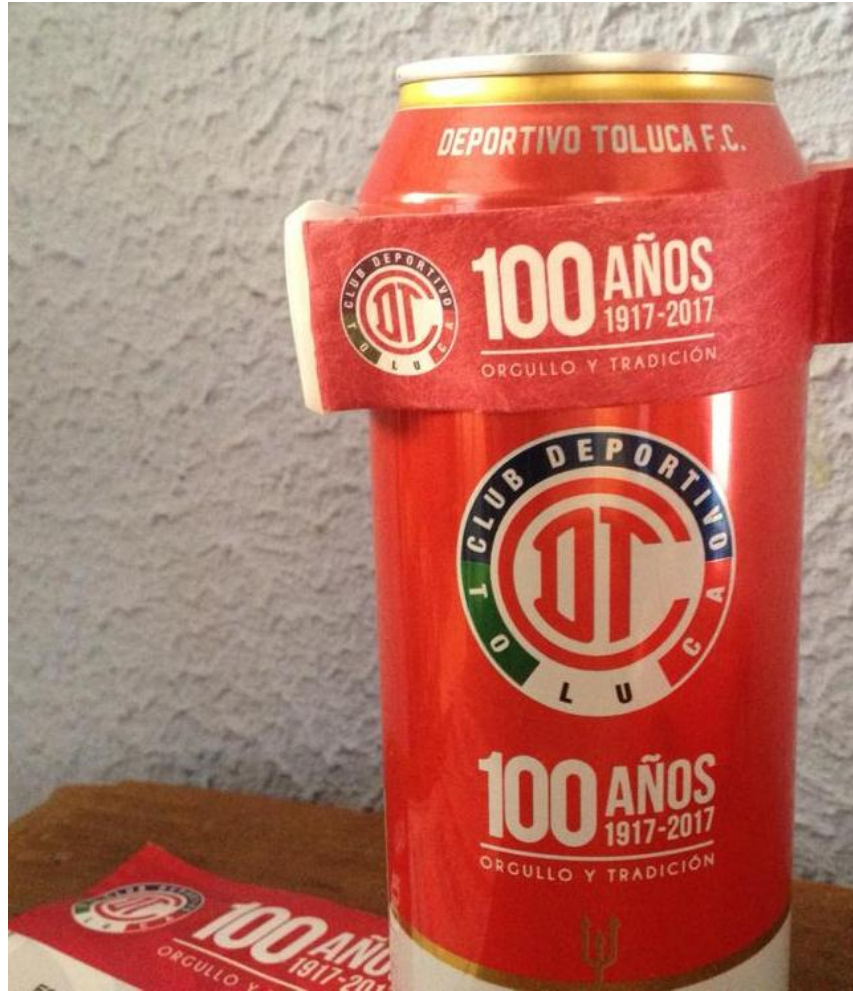
Título: Orgullo y Tradición.