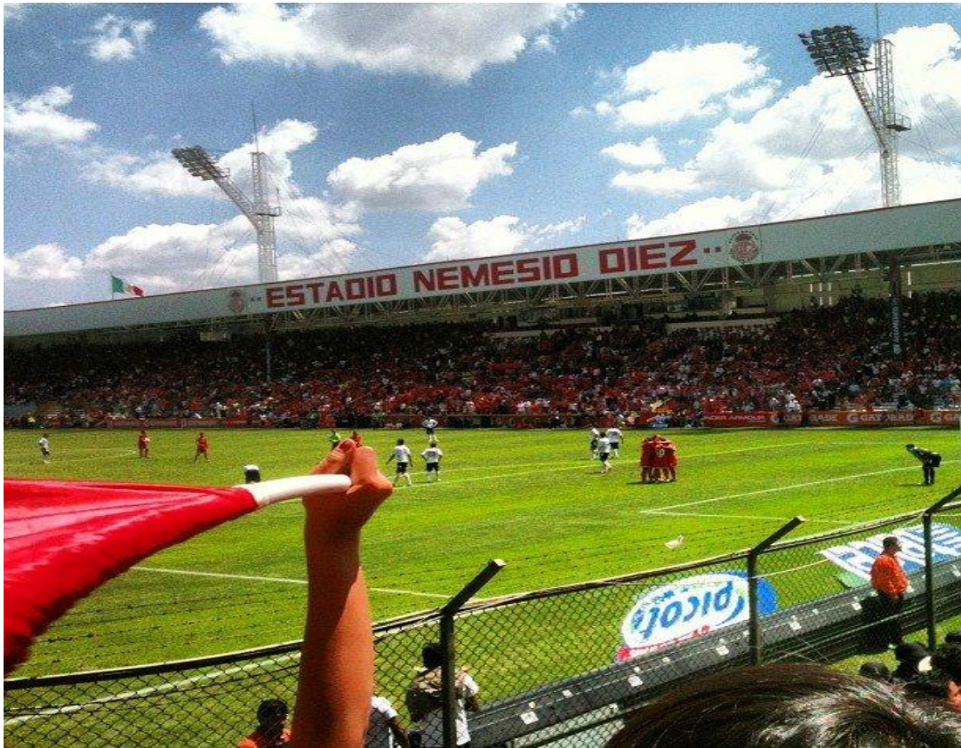
Foto: Banderas desde el Nemesio Diez.

Respecto a los símbolos; trapos, playeras, telones, banderas, mosaicos etc. Son una parte fundamental, ya que a través de esto, se puede ir creando un sentido de pertenencia y por ende una identidad de acuerdo a esa cuestión de una generalidad; es decir el partir de una individualidad o sea un cierto apego o gusto por algo, lo cual si es algo concurrido, algo público, se puede apropiar de distintas formas y una cantidad importante de seguidores, dependiendo el arraigo o apego que se genere, será la forma de cómo se sienta identificada la gente, o como puede pertenecer a esa generalidad, estando activa del todo dentro de, o no queriendo pertenecer del todo. Los telones y mosaicos a pesar de que muchas veces son actividades que ha organizado, desde la pinta, hasta la muestra, La Banda del Rojo, algunas veces lo dejan en manos de la demás afición, la hacen participe de estas acciones que bien tienen un sentido de pertenencia e identidad en común, el factor del futbol y el hecho de irle al Toluca.