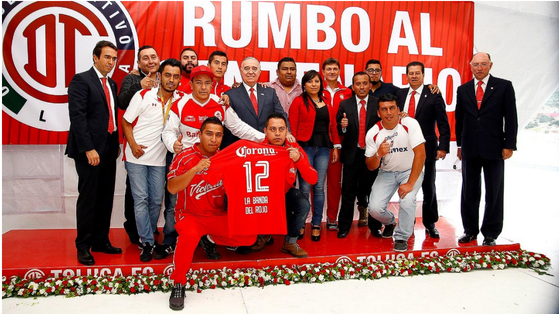
Título: jugador número 12

mexicanas y en ocasiones reconocidas por los jugadores y directiva –véase en la siguiente imagen