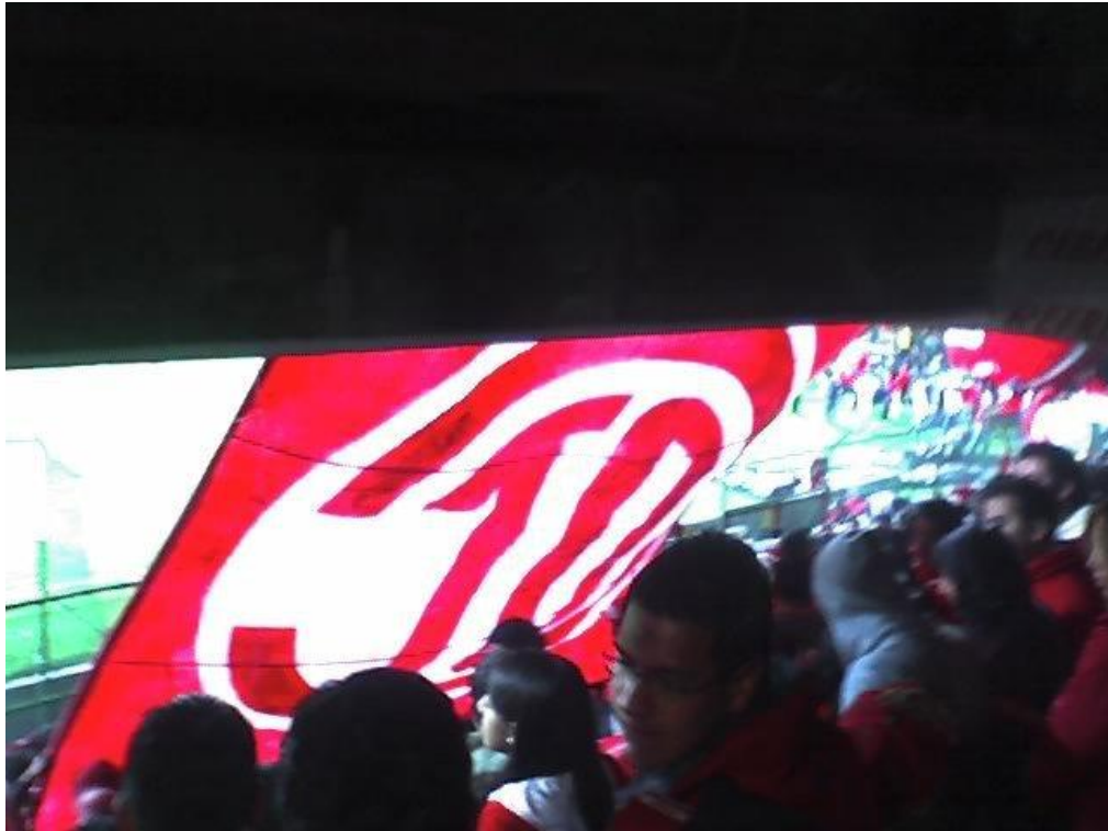
Telón en un partido Toluca vs América

especial, te vas empapando del ambiente que se vive; es decir los gritos, los festejos de goles, las porras o canticos entonándolos a todo pulmón, el ondear las banderas, intentar hacer que las demás tribunas cantaran alguna porra hacia el equipo, o pedirles a una sola voz: ¡Otra copa! Haciendo referencia a otro título para el equipo, para la gente, para su afición.