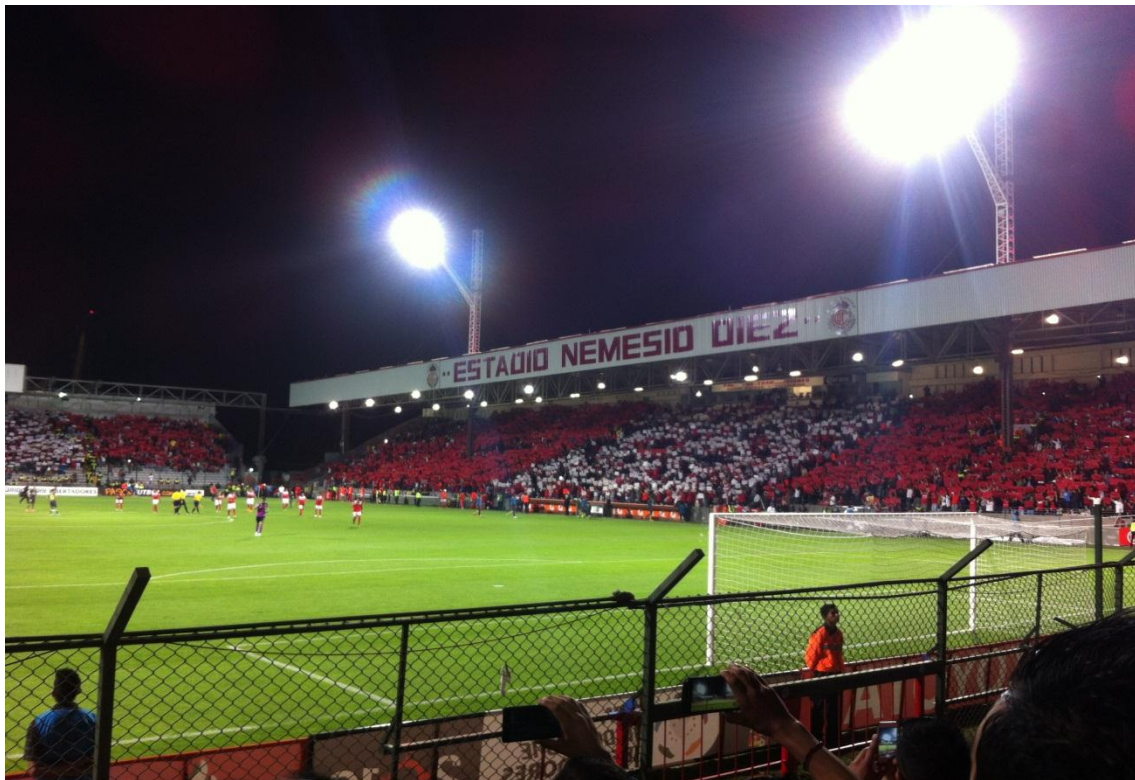
Título: Mosaico

“En la historia personal de un hombre ordinario en México los litros de cerveza bebidos en relación al futbol, la cantidad de risas y abrazos motivados por él, las fiestas y satisfacciones, las frustraciones y los corajes, son centrales y abundantes”. Galindo (2011, p. 72-73).