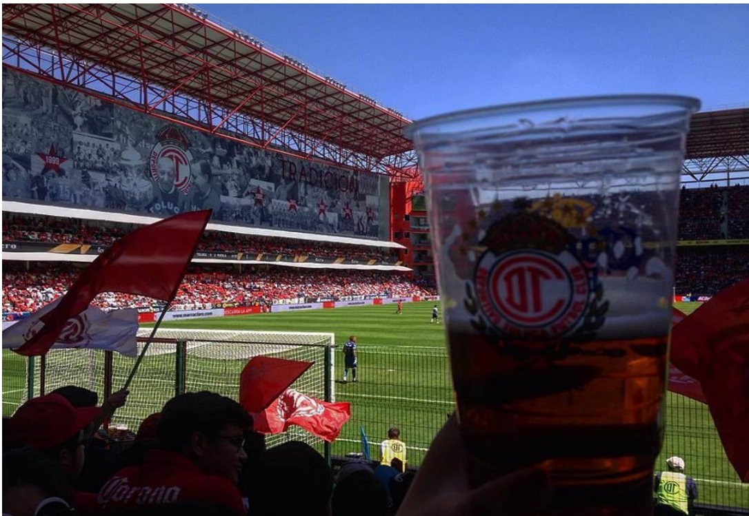
Título: La victoria no es para cualquiera Fuente: Erick Baruch Bastida Pérez 29/08/17

Como señala Galindo (2011) aquella vez que salió campeón tal o cual equipo, o que casi salió campeón o cuando hizo el ridículo. Son acciones que en la memoria social tienen un lugar central, en el contexto Toluqueño más, pues es consideradas unas de las ciudades más frías del país y por ende su entorno social también lo es o la gente lo encuentra así, y en el caso de la afición del Toluca no se salvan de ese calificativo en el contexto barrista o barra brava, pues ha habido casos en los que La banda, abandona al equipo, lo abuchea, le da la espalda, no le canta, no viaja, no se hunde con el equipo cuando tiene rachas malas, hay veces en las que lo hunde más. “En un hecho insólito, una de las porras de Toluca, llamada "La Banda del Rojo" abandonó al medio tiempo parte de la tribuna que ocupaba en la cabecera de sol del Estadio Nemesio Díez, como protesta contra la Directiva choricera” (Cruz, 2009)