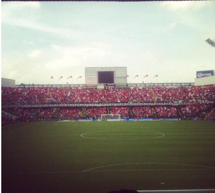
Foto: La Banda de frente.

Ahí me di cuenta que era algo más que un simple sentimiento, una simple afición, era una gran identidad y amor hacia el equipo, y que poco a poco sin querer adopte algunas situaciones que observaba en la cancha, normalmente yo asistía con mi hermano a la cabecera contraria a sol. Pero poco a poco nos empezaba a llamar la atención el hecho de ver la manera de apoyar de la cabecera de sol, así que muchas veces cambiábamos de localidad en partidos futuros, con tal de ver cómo era el ambiente que se vivía dentro de ese espacio, es decir; la fiesta, los canticos, los trapos, el alcohol, los festejos al grito de gol, abrazar al de alado, saludarse por el simple hecho de portar el color del equipo de la ciudad entre muchas cosas más.