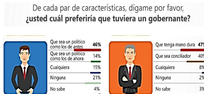
“Perfil ideal de un candidato”

En una encuesta realizada en 2017 por la empresa Demotecnia se aprecian los dos valores que nos tienen atados a este sistema presidencialista; el anhelo de los viejos tiempos y la centralización del poder que distingue a los presidentes, y que, según sus resultados, el perfil del candidato ideal del mexicano debe ser: un político como los de antes y que tenga mano dura, como se aprecia en el siguiente gráfico (Demotecnia, 2017):