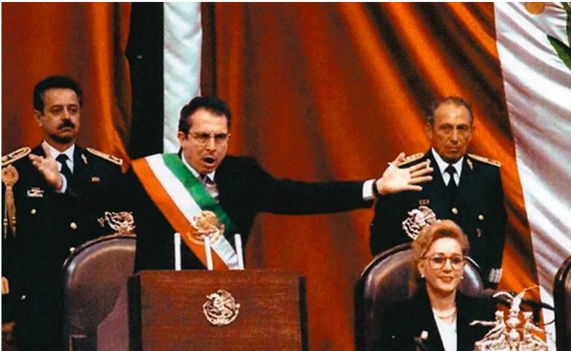
Ilustración 6.

El presidente Ernesto Zedillo llegó al poder a finales de 1994 producto de un trágico hecho para la historia de la vida política de la nación, el homicidio del candidato del PRI, Luis Donaldo Colosio durante un acto de campaña.