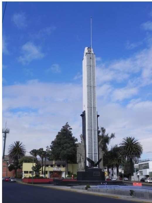
(5) Vista general del Monumento a la Bandera

Ubicado en la antigua entrada a Toluca viniendo de la Ciudad de México. Se tiene entendido que el coronel Wenceslao Labra hizo una campaña al nivel nacional para dedicar un día a la Bandera Nacional, para ello gestionó la construcción de un monumento singular que encargó al ingeniero Harmodio de Valle. Logró construir una alta y esbelta torre de concreto armado, en su tiempo no se había hecho una tan alta y esbelta con esta tecnología. Ver fotografía (5). Además de superar los retos estructurales, logró un conjunto armonioso en cuanto a la arquitectura y la escultura dentro de un estilo “Art Decó” En su origen contaba con detalles significativos como la iluminación indirecta por medio de bloques de vidrio especialmente diseñados y fabricados para el caso. Logró un equilibrio sorprendente entre la forma, el color y la textura. El concreto según cada componente contaba con atributos diferentes. A pesar de que se ha procurado dar mantenimiento a este monumento algunos detalles se han perdido y ya requiere de trabajos de reparación importantes. En el año de 1940 se inauguró el monumento precisamente el 24 de febrero con la presencia del presidente de la república, iniciándose de esta manera el “Día de la Bandera” al nivel nacional. En sus orígenes la fuente en su parte frontal contaba con dos hipocampos de concreto de cuyas trompas salían surtidores de agua. Se ignora cuál fue el destino de esas curiosas esculturas.