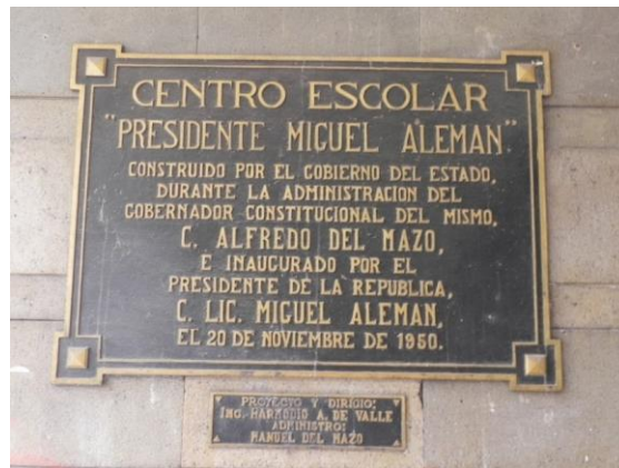
(12) Placa conmemorativa. Abajo se da crédito del proyecto y dirección a don Harmodio