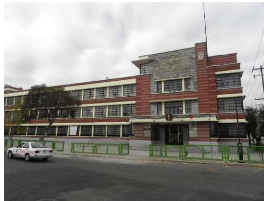
(11) Fachada principal del Centro Escolar Miguel Alemán

El edificio tuvo algunos daños durante el movimiento sísmico del 19 de septiembre de 2017, en opinión del que esto escribe se debieron a la modificación de las juntas contrastivas que propiciaron el choque de los cuerpos del edificio