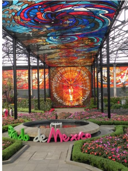
(2) Cosmovitral, antiguo Mercado 16 de Septiembre

Se tiene entendido que la primera obra de concreto armado en Toluca fue la cimentación del Mecada 16 de Septiembre hoy Cosmovitral. Ver fotografía (2). En 1909 se construyó la cimentación y se montaron las columnas metálicas. La cimentación consistente en zapatas de dos cuerpos con una superficie de contacto de aproximadamente ocho metros cuadrados Ver fotografía (3). La obra de este edificio se suspendió por varios años por falta de recursos hasta que en 1933 se pudo continuar y se le dio el uso originalmente proyectado de mercado público.