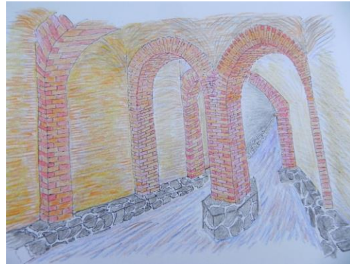
(8) Representación de la bóveda del río Verdiguel por abajo del Edificio Antonio Abraham