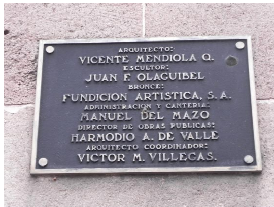
(10) Placa que registra a los participantes en la obra