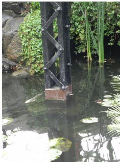
(3) Dentro del agua se puede distinguir una de las zapata de concreto