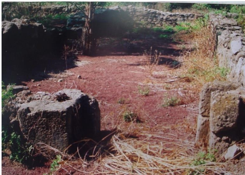
(1) Elementos de concreto totonaca en el Fuerte de Corte. Villa Rica, Veracruz

Las culturas americanas utilizaron varios materiales a manera de puzolana, como ceniza volcánica, piedra de tezontle molida y el nejayote que es un subproducto en la nixtamalización del maíz para hacer tortillas. El Ing. Raymundo Rivera Villarreal en la UANL realizó un estudio de las características químicas y mecánicas de los materiales cementantes antiguos y demostró que la inclusión de materiales puzolanicos fue intencional y no fortuita como establecían investigadores que no daban crédito a los adelantos tecnológicos de las culturas antiguas de América.