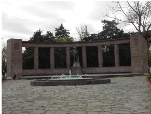
(9) Vista general del Hemiciclo a Juárez

En este caso don Harmodio participó como funcionario ya que el proyecto es del arquitecto Vicente Mendiola pero es de suponerse que con sus influencias don Harmodio logró la conjunción del equipo de trabajo y participó en la solución de complejos problemas constructivos y estructurales. Las altas columnas y los cuerpos laterales en forma de paralelepípedo se construyeron huecos para disminuir su masa y su costo, fue la primera ocasión, que se conozca, en que se utilizó en Toluca el sistema constructivo de la cimbra deslizante. Ver fotografías (9) y (10)