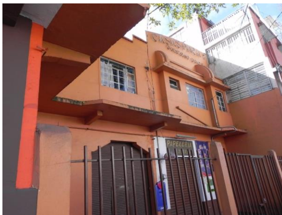
(4) Casas para trabajadores. Fachada principal

El edificio se encuentra en el barrio de Santa Clara, enfrente de “La gota de Leche” se puede establecer que fue el primer desarrollo multifamiliar en Toluca. Destacan detalles estructurales como las ménsulas para soportar las losas voladas, lo cual indica que don Harmodio conocía el fenómeno del flujo plástico del concreto por el que las deformaciones se incrementan con el tiempo al actuar una carga permanente como el peso propio. El conjunto habitacional en su fachada hacia la calle de Hidalgo fue alterada hace algunos años (Toluca no ha sido especialmente respetuosa de su patrimonio edificado) Ver fotografía (4). El ingeniero a cargo en su oportunidad comentó que el concreto original estaba durísimo, al grado de que algunos albañiles ya no quisieron seguir trabajando.