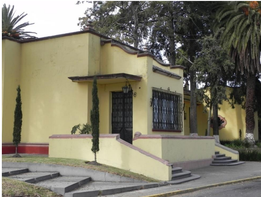
(6) Museo de Arte Popular hoy Biblioteca José María Heredia