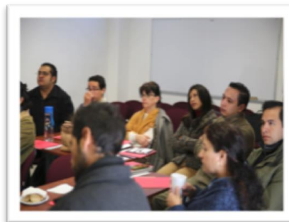
Docentes en música en materias prácticas