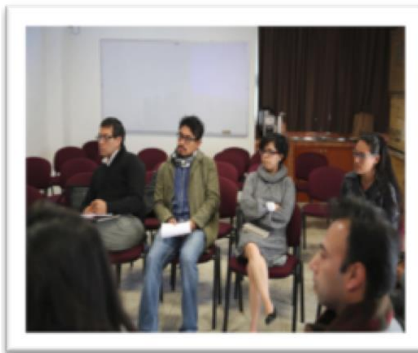
Docentes de cine, materias teóricas y prácticas