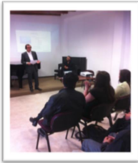
Clase maestra para alumnos de cinematografía