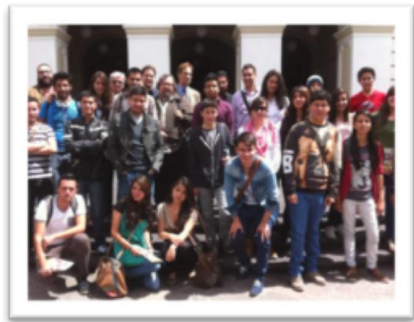
Alumnos de la Licenciatura en Estudios Cinematográficos (Autor R. León)