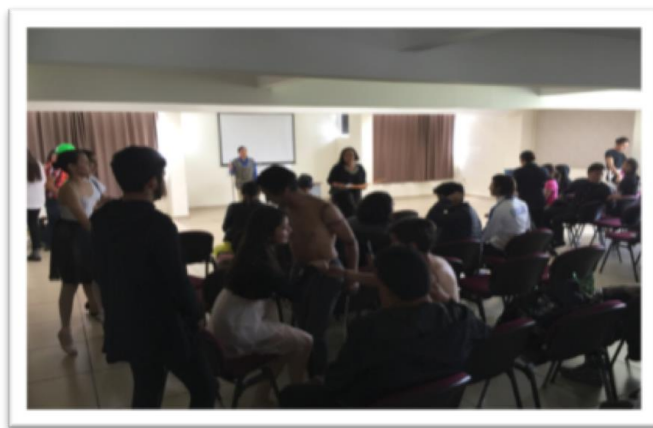
Presentación alumnos de la Licenciatura en Danza