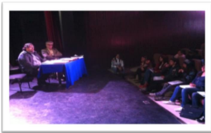
Clases en la Sala “Esvón Gamaliel”, instalaciones de Rectoría

En esa misma idea, luego de varios meses deambulando impartiendo las clases por diferentes espacios universitarios, el 26 de agosto de 2014, el Rector Dr. en D. Jorge Olvera García, inaugura en el Municipio de Zinacantepec, el primer predio rentado a la Universidad. Dichas instalaciones dan cabida por primera vez a la Escuela de Artes Escénicas.