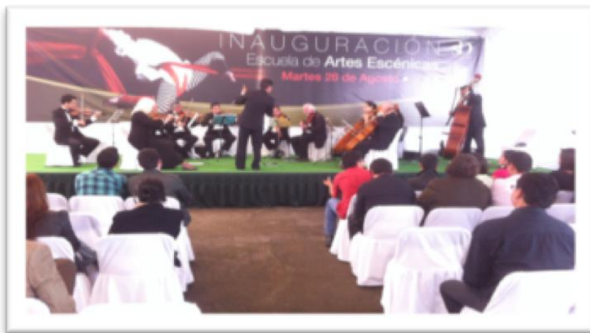
Inauguración de instalaciones en el Mpio. de Zinacantepec, Méx.

En esa misma idea, luego de varios meses deambulando impartiendo las clases por diferentes espacios universitarios, el 26 de agosto de 2014, el Rector Dr. en D. Jorge Olvera García, inaugura en el Municipio de Zinacantepec, el primer predio rentado a la Universidad. Dichas instalaciones dan cabida por primera vez a la Escuela de Artes Escénicas.