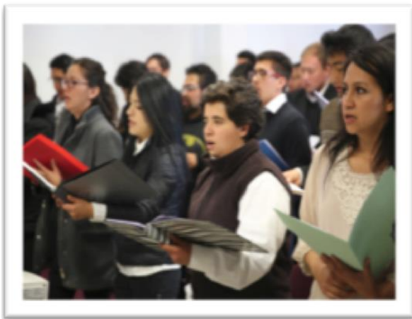
Alumnos de la Licenciatura en Música (Autor R. León)

En la Licenciatura en Estudios Cinematográficos, realizaron solicitud de inscripción 177 jóvenes, de los cuales 156 fueron examinadas bajo la siguiente modalidad: se les realizaron dos exámenes específicos, “apreciación cinematográfica” y “creatividad cinematográfica”. De esa selección, pasaron a una segunda ronda 40 probables alumnas y alumnos, mismos a los que se les realizó una “entrevista”. Del resultado de las evaluaciones generales de la Universidad y de los exámenes específicos realizados en la Licenciatura, solo se aceptaron a 25 integrantes, y en una segunda etapa, 5 alumnos más, para un total de 30 estudiantes que finalmente conformaron un grupo principal.