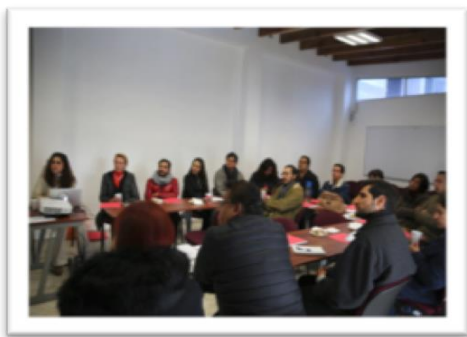
Docentes en música de materias teóricas (Autor R. León)