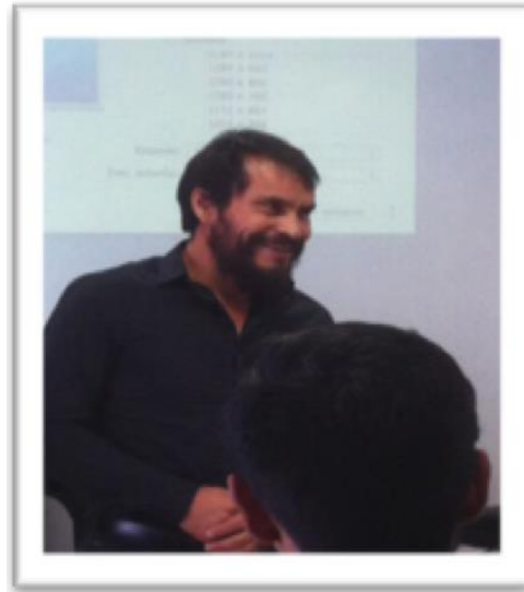
Noé Hernández en clase maestra

A la inauguración acudieron autoridades del Gobierno Municipal y Estatal, así mismo, también asistió un exalumno sobresaliente de la UAEMex perteneciente al ramo del medio artístico, el actor de fama nacional e internacional, Noé Hernández, orgullosamente egresado de la Facultad de Humanidades, de la Licenciatura en Artes Teatrales. El mismo día del evento, se debe acentuar que el actor Noé Hernández llevó a cabo una clase magistral para los alumnos de la Licenciatura en Estudios Cinematográficos, con un tema relevante para los estudiantes de Cinematografía: “La importancia de la participación de un Director de Cine en la realización de una película”.