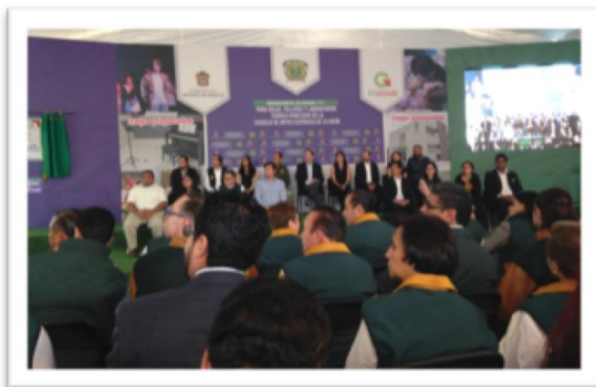
Inauguración de las nuevas instalaciones de la Escuela de Artes Escénicas en el Mpio. de Toluca (Autor R. León)

historia de este espacio universitario pues se lleva a cabo la construcción y rehabilitación del inmueble.