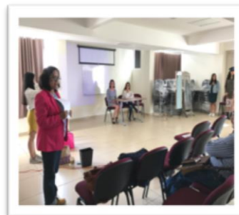
Docentes y alumnos en clase práctica de danza