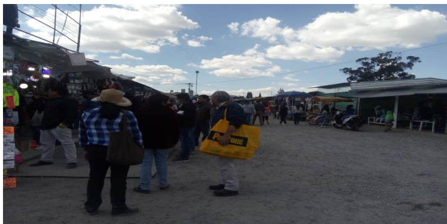
Zona de terracería en El Piojo

un mercado en donde venden cosas de segunda mano, no es un mercado de antigüedades, aunque sí se encuentran libros antiguos, pero no llega a ser un mercado como el de “La Lagunilla”, en donde los turistas van porque tienen sus características, a veces se puede encontrar una joya, a veces se puede encontrar uno una falsedad, hay muchos riesgos; por ejemplo, comprar algo que no tiene una procedencia muy clara (Novo, 2019).