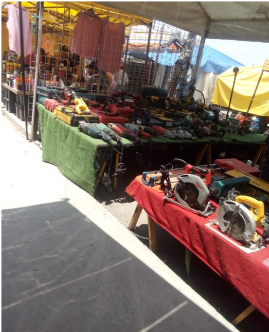
Mercancía de segunda mano.

adquirir un poco más económica recurriendo al regateo, y así con todo lo que se vende, todo depende del proceso comunicativo que se esté empleando entre vendedor y comprador. En palabras de Briz, “la comunicación verbal y, por tanto, el éxito de esta depende no solo del proceso de codificación-descodificación, sino de lo adecuada, efectiva y eficaz que sea la mostración e interpretación de la meta o propósito” (Briz, 2001: 49). Puede llegarse a un acuerdo o una negociación para adquirir un producto sin que el vendedor salga especialmente afectado.