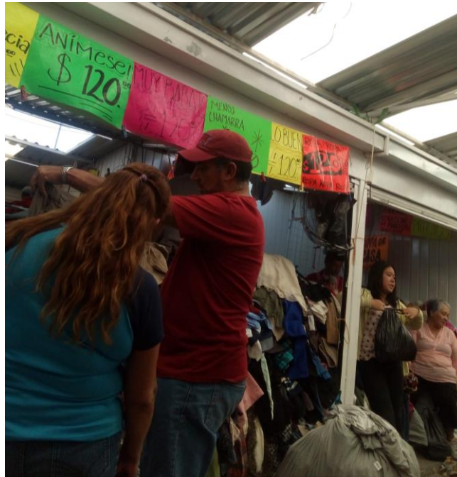
Carteles en El Piojo.

En la siguiente tabla se concentra la información sobre los cuatro tipos de pregones identificados: con vocativo, con predominio de función fática, con predominio de función conativa y con expresiones monetarias coloquiales; así como la frecuencia, es decir, la cantidad de ocurrencias en el corpus, seguida del porcentaje correspondiente.