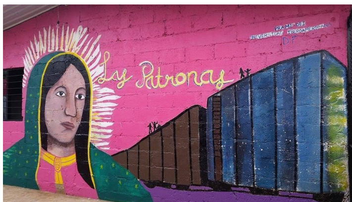
Imagen 3. Mural en el comedor “La esperanza del migrante” Fotografía por Michel Cuenca, trabajo de campo 2016

Actualmente a la entrada de la localidad, a una distancia de 20 metros de las vías del tren, se encuentra el comedor cuyo exterior pintado de rosa mexicano se hace visible para toda y todo aquel que va en busca de Las Patronas y su quehacer. El comedor funge como el espacio que las congrega en el día a día para llevar a cabo las actividades correspondientes que consisten en limpiar el lugar, preparar los alimentos, embolsar la comida, recibir a las personas que llegan buscando ayuda y a quienes buscan conocer su labor, a las y los voluntarios que asisten para apoyar en actividades y aprender de estas mujeres. Durante el tiempo que transcurre en el lugar se espera oír el silbato del tren, que les llama a dirigirse apresuradas hacia las vías con los lonches que repartirán.