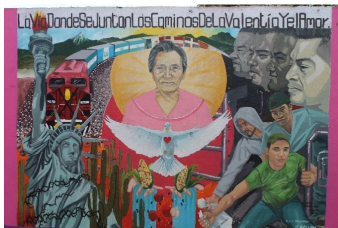
Imagen 5. Mural en el comedor Fotografía por Michel Cuenca, trabajo de campo 2018

Mucha de la población en movilidad que transita por la ruta del Golfo tiene conocimiento y esperanza de encontrar en el camino a Las Patronas debido a que entre ellos se corre la voz “...en un pueblo hay unas mujeres que le dan comida a uno” (Cristian, hondureño, trabajo de campo 2016); historias que se cuentan en las casas de migrantes, sobre el tren o desde sus países de origen, entre aquellos que ya conocen a estas mujeres y quienes viajan por primera vez. Lo anterior ha propiciado que algunas/os migrantes que van en busca de ayuda, anden por las calles de la comunidad para poder llegar a pie al comedor “La esperanza del migrante”. Aunque su presencia no es del todo grata para la comunidad de vecinos/as, dado el ambiente de xenofobia y discriminación que en parte han coadyuvado a atizar los medios de comunicación, sociedad civil y en más de una ocasión funcionarios públicos, al criminalizar a la población migrante adjudicándole y generalizando sin sustento la permanencia de delincuencia, comercio sexual y homicidios.