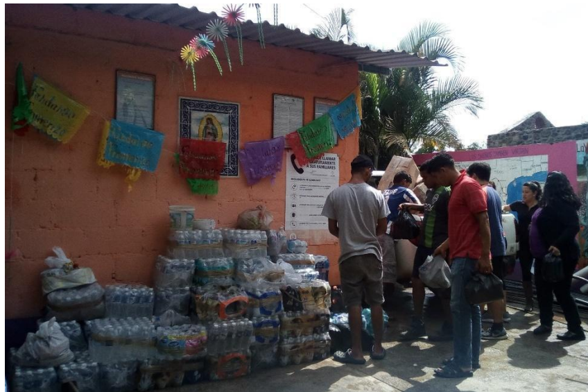
Imagen 2. Donación de víveres Fotografía por Michel Cuenca, trabajo de campo 2018

Agradezco mucho a la gente que nos ha donado el frijol, el arroz, el aceite, el atún, bolsas, ropa, zapatos, medicamentos, mochilas, todo eso a ellos les hace falta, porque llega un migrante y a veces no tienen zapatos..., que viene otro migrante que está enfermo y necesita medicamento y lo que la gente dona es lo que se les da a ellos (Rosa, trabajo de campo 2018).