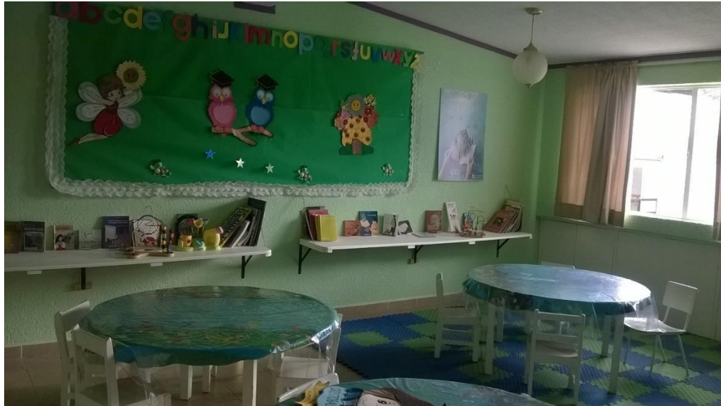
área de psicología ATRI

Una institución que apoya a los niños es el CREE, (centro de rehabilitación y educación especial), quienes les otorgan a los niños terapias de lenguaje, al igual que por parte de las psicólogas,