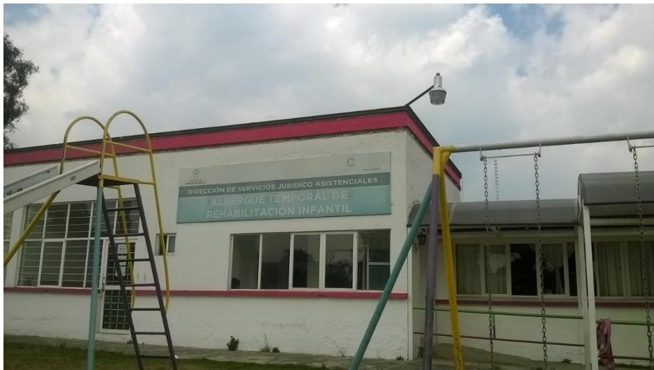
Albergue ATRI, DIF, Toluca

El ATRI (atención temporal de rehabilitación infantil), del DIF (desarrollo integral de la familia), que se encuentra en la calle colon, pasando torres, en donde se encuentran demás departamentos, como villa hogar, el ATI, en la cual se dedican a dar atención a niños, que sufren diferentes deficiencias tanto de necesidades básicas, como biológicas, y desintegración de familia.