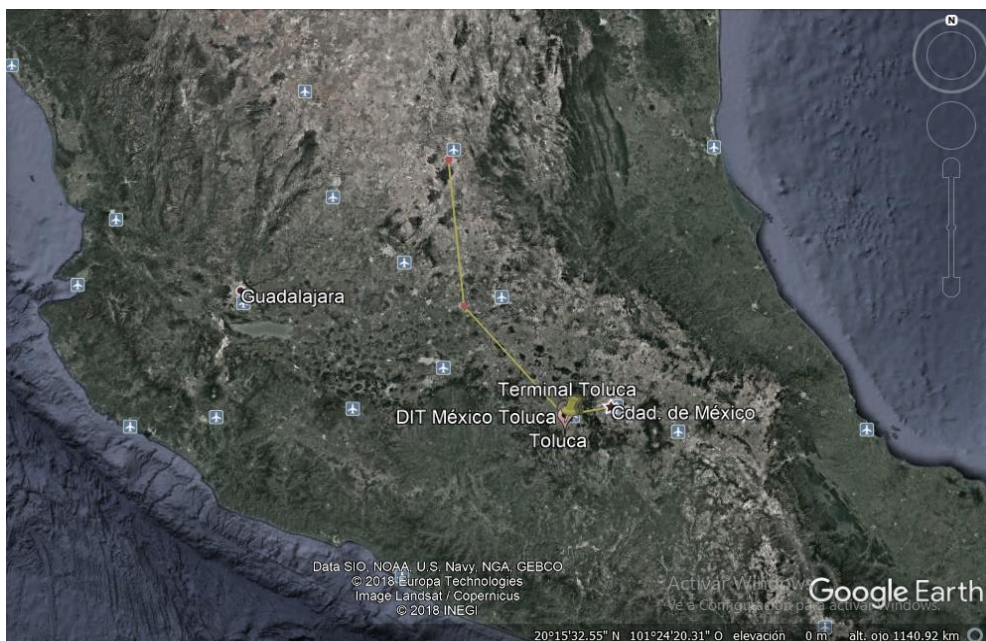
Imagen 2. Ruta hacia la ciudad de Toluca

A continuación, se muestra en el mapa la ruta que es a partir de la ciudad de México, para llegar a la ciudad de Toluca. Con base en el trabajo de campo se conoció, que llegando aquí todos eligen diferentes vías, ya que hay quienes se vienen caminando o en autobús sobre Tollocan hasta llegar a pilares, pero hay migrantes que se dirigen hacia Metepec o la terminal de Toluca.