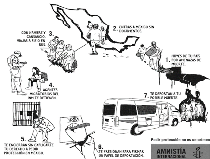
Imagen 1. Recorridos y vivencias por las que pasa un migrante

Las vivencias, los retos y los recorridos de los migrantes, parecieran un cuento donde todo se pinta de rosa, pero la realidad es que no, ellos mismos mencionan que no es nada comparado con lo que los medios de comunicación envían, pues en ese momento lo único en lo que piensan es llegar a su lugar de destino y cuidarse para poder lograrlo. A través de esta imagen, se plasma una idea o ejemplo de lo que puede llegar a pasar un migrante durante su trayecto migratorio. Asimismo, a veces piden ayuda a los llamados “polleros” o “coyotes” (son personas que se dedican a transportar migrantes de manera ilegal). Pero no les garantiza que lleguen a su lugar de destino, y que en el transcurso los detenga migración, los asalten o realicen llamadas de extorción a sus familiares.