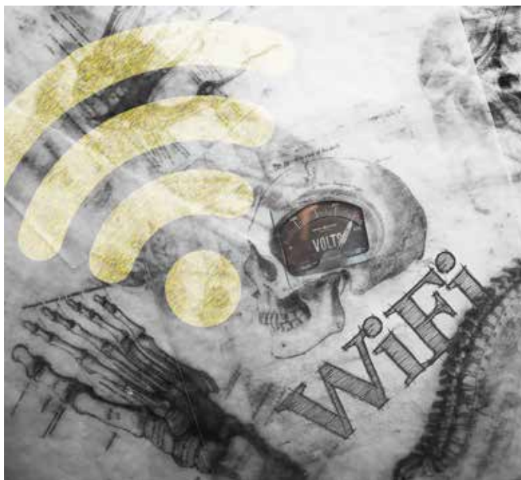
Montaje: Gerardo Mercado

Es importante tener presente que a estos jóvenes les falta madurez para