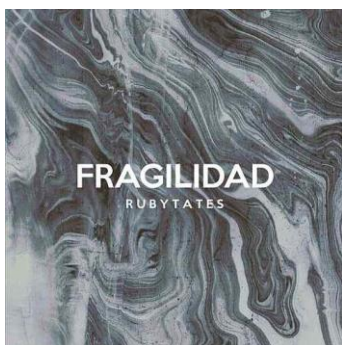
Figura III El álbum del sencillo de “Fragilidad” en donde nos muestra un collage de líneas que simulan ser el viento

“Fragilidad” interpretada por Rubytates Banda originaria de Toluca, Estado de México su estilo psicodélico rock indie gano la admiración de muchas personas en la capital mexiquense y este es uno de sus temas más populares. Esta canción salió en el año 2016 como un sencillo de la banda. Actualmente en la plataforma de youtube cuenta con 668,000 reproducciones el video oficial, y en spotify cuenta con 1,800,000 reproducciones