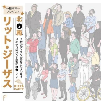
Figura IV. Álbum “Norte” lanzado en el 2014, contiene 15 sencillos y la portada nos habla sobre la ciudad oriental y las letras japonesas hacen referencias a la cultura

“Norte” interpretada por Little Jesus banda originaria de la ciudad de México que cuenta con un público fiel. Esta canción se lanzó el año 2014 en su álbum Norte que cuenta con 7,000,000 de reproducciones en spotify y 4,000,000 en youtube.