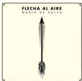
Figura 1. Álbum “Nadie se salva” lanzado en el año 2017 cuenta con 5 sencillos. Solo muestra una flecha al aire

“La puerta” interpretada por “Flecha al aire”. Una banda que es originaria de la Ciudad de México, esta banda ha tenido reconocimiento por uno de sus integrantes y vocalista de la banda “Yayo Gutiérrez” bloguero de la plataforma de Youtube. La canción fue estrenada en el 2017 incluida en el álbum “Nadie se salva” con aproximadamente 63,000 reproducciones en youtube y 193,000 reproducciones en spotify.