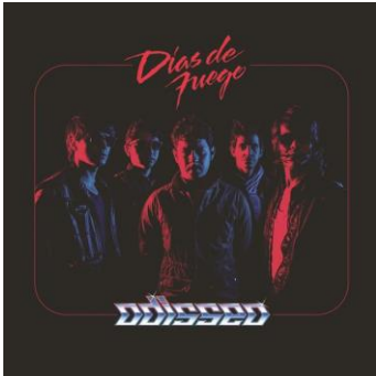
Figura V. Álbum "Días de Fuego" lanzado en el año 2014 donde simplemente están los miembros de la banda con un tono azul y rojo.

4,900,000 de reproducciones en youtube y 5,500,000 de reproducciones en spotify este tema forma parte de su álbum lanzado en el año 2014 "Días de fuego"