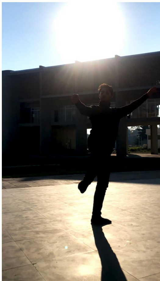
Fig. 1.- Inauguración dancística en el foro “La escalinata”.