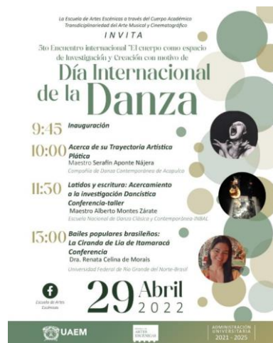
Fig. 7.- Flyer de las actividades referentes al Día Internacional de la Danza 2022. Diseño del Departamento de Difusión Cultural de la EAE.

Es gratificante tener la oportunidad de celebrar el Día Internacional de la Danza, después de un largo periodo lleno de incertidumbre, agradezco la participación de los ponentes que nos acompañaron en esta mañana de trabajo, compartiendo con nuestra comunidad estudiantil su experiencia. Exhorto a docentes y alumnos a continuar el festejo año con año y reivindicar con ello, el lugar que merece la danza en la sociedad y en nosotros mismos. “Patria, Ciencia y Trabajo”.