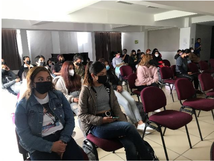
Fig. 4.- Presencia del alumnado de las cuatro primeras generaciones de la Licenciatura en Danza. Fotografía JITR.

Sin embargo, lo más interesante consistió en la puesta en escena de diferentes rutinas donde el alumnado experimentó diversas convencionalidades al respecto del ritmo, es decir, el condicionamiento reflejo del ritmo que presume alguna secuencia de sonidos conocida, y la ruptura que puede hacerse de ese condicionamiento reflejo, cambiando o alterando el ritmo original, obligando al cuerpo a manifestarse en una convencionalidad distinta.