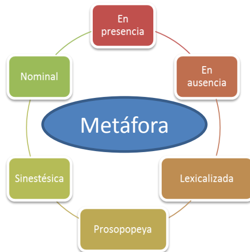
Figura 1.1.: Tipos de Metáfora.

En general, de este modo podría clasificarse las metáforas de acuerdo a este apartado, esto con el fin de entender un poco más sobre esta figura retórica.