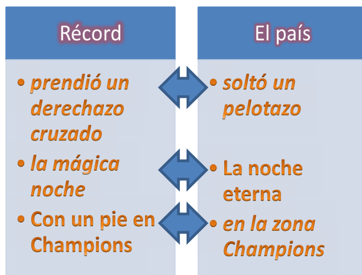
Figura 3.1.: Algunas metáforas consideradas comparables

Estas metáforas como se mostraron anteriormente se compararon fácilmente por el suceso o hecho que estaba sucediendo en aquel entonces, también para ser visible su comparación entre dos metáforas, es decir, en ambos periódicos se fijó el mismo día, mes y año, obviamente con diferente título sin perder la información relacionada con el evento de ese mismo día. A continuación se observa el siguiente cuadro donde se muestra algunos ejemplos respecto a que pueden ser comparables unos con otros.