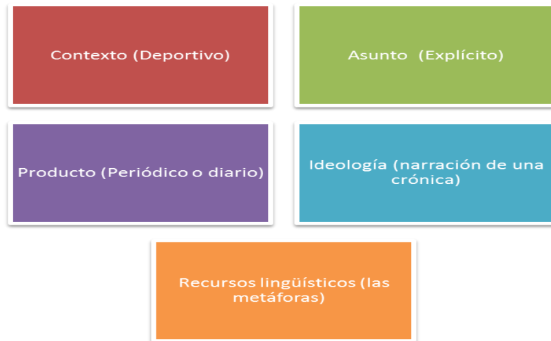
Figura 1.3.: Elementos importantes para el análisis del discurso

En dicho procedimiento relacionado al análisis del discurso se tomará los siguientes elementos que se mencionaron en este capítulo para revisar las metáforas que se encontraron en este proyecto: