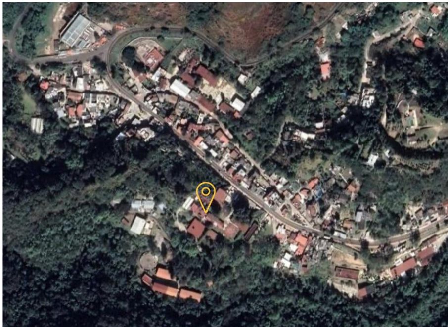
Figura 3. Localización Geográfica del Centro Universitario UAEM Temascaltepec

El experimento se desarrolló en la Unidad Metabólica de Nutrición Animal del Centro Universitario UAEM Temascaltepec, de la Universidad Autónoma del Estado de México, en Temascaltepec, la cual se ubica al sur poniente del Estado de México, México. La región presenta un clima templado subhúmedo con lluvias en verano y una precipitación promedio de 1160 mm anuales y temperatura media anual de 22 °C.