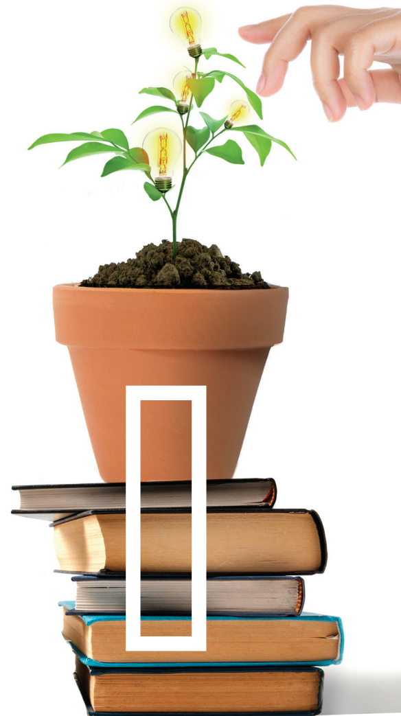
Ilustración: Luis Ángel Velazquez

Para comprender mejor el progreso, es importante mencionar que la Agenda 2030 se presentó en el 2015, y, para el 2021, la universidad ha incrementado el número de personas empleadas, además, a los trabajadores con baja categoría se les han asignado dos o más