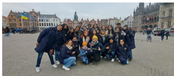
Brujas, Bélgica.