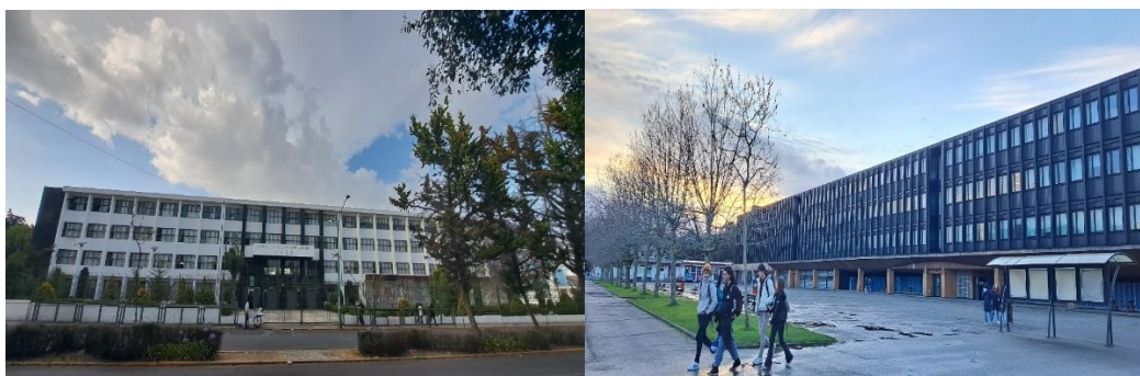
Izquierda Plantel “Lic. Adolfo López Mateos” de la Escuela Preparatoria de la UAEMéx. Derecha, Liceo Colbert, en Lorient, Francia.