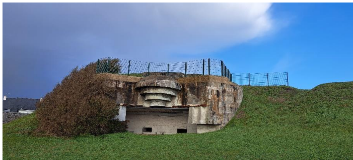
Superior. La Abri de Défense Passive, en el centro de Lorient. Centro. Las alumnas y alumnos por las calles de Rennes. Inferior. Ruinas del Muro del Atlántico sobre Larmor-Plage.