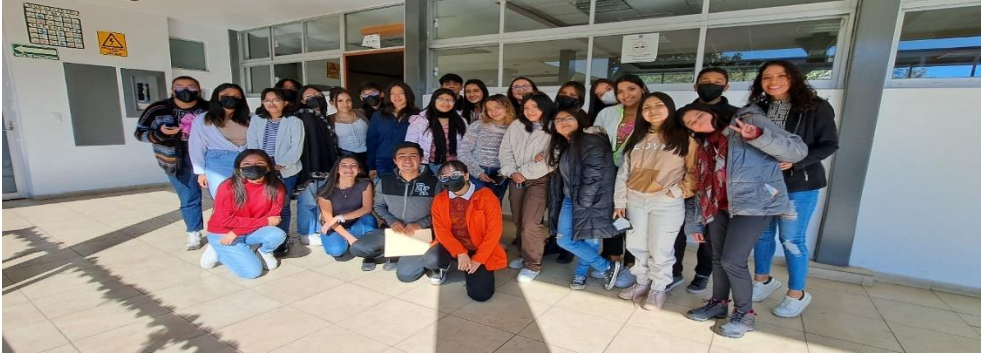
Superior. Alumnos egresados de la Prepa 1, hablando de sus experiencias del intercambio a Francia en el año 2019. Inferior. Cierre de curso de francés en las instalaciones del Plantel.

"Hasta los mayores artistas de la historia, aquellos que se estudian en los libros y se visitan en los museos, fueron una vez aprendices que tuvieron que dejarse aconsejar por otros que sabían más que ellos" -Anónimo.