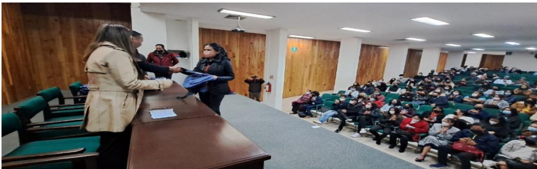
Entrega de boletos de avión y seguro de vida, por parte de la Agencia V.I.P. Viajes.