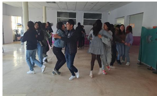
Izquierda: Preparando crepas dulces y saladas. Derecha: Bailando Bretón, ambas actividades en La Cantine del Liceo Colbert.