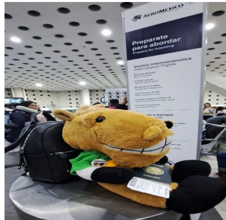
Izquierda: Director dando palabras de despedida a los alumnos del intercambio. Derecha: Potro viajero en sala de espera del Aeropuerto Internacional Benito Juárez de la Ciudad de México.

Después de esperar unas horas en el aeropuerto, llenando los formatos de migración, los identificadores de grupo y personales de las maletas, que los de la aerolínea se quisieran poner especiales con los documentos de dos alumnos, nos fuéramos a comer, que se fuera por cuestión de segundos la luz, de observar y escuchar a algunos viajeros tocar el piano de la sala de espera, que en grupo de alumnas se tomaran fotos con los pilotos del vuelo AeroMéxico con destino a Londres y que nos enteramos de que uno de ellos había egresado de la prepa 3 de nuestra máxima casa de estudios, por fin estábamos abordando el vuelo con destino la ciudad de París. Ya en pista, y esperando despegar, de pronto escuchamos al piloto en cabina decirnos