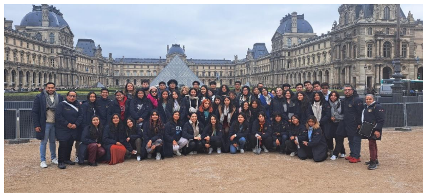
Fotos. Superior. Saliendo con el equipaje del hotel Ibis Paris Tour Eiffel Cambronne. Inferior. Penúltimo sitio que se visitó durante el viaje, el Museo de Louvre.