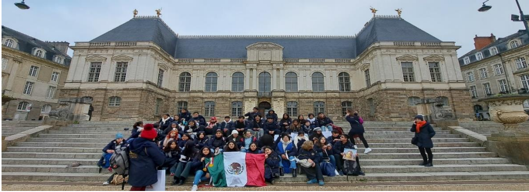
Parlamento de Rennes, Francia.