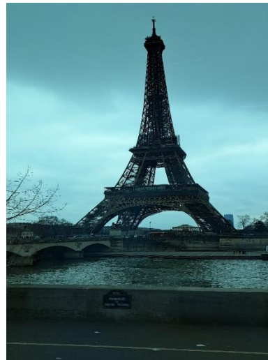
La Torre Eiffel y el Río Sena, París Francia.

Considero que todos los días en París fueron especiales, a pesar de las largas caminatas, pero sin ellas no habiéramos conocido Notre Dame y el avance de su restauración, justo con la intención de estar lista para las Olimpiadas Paris 2024, el Panteón, el exterior del Museo Georges Pompidou, la iglesia y distrito de San Germain, el Moulin Rouge, los Campos Eliseos, El arco del Triunfo, la Plaza de la Concordia, bailar en el barrio latino las canciones de “La Chona” y “Payaso de Rodeo”, con el gusto de observar cómo se agregaban otros mexicanos; entre otros sitios. Siempre será insuficiente el tiempo para la visita en sitios como Versalles, el Museo de Louvre, considerando que no es una época de turismo de masas de la ciudad, aun así, son espacios concurridos la mayor parte del año. Aquí algunos comentarios de las alumnas: