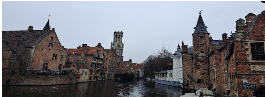
Brujas, Bélgica.