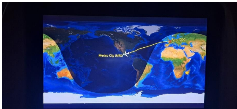
Superior. Llegando a la Ciudad de México desde París. Inferior. Pantalla del trayecto del vuelo AMX4 París-México.

Termino con esto “Que los viajeros encuentren la felicidad donde quiera que vayan, y sin mayor esfuerzo cumplan cualquiera que sea su cometido. Y habiendo regresado salvo a la orilla, puedan reencontrarse alegremente con los suyos” Dalai Lama.