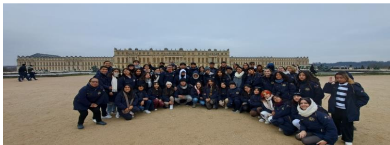
Castillo de Versalles, París Francia.