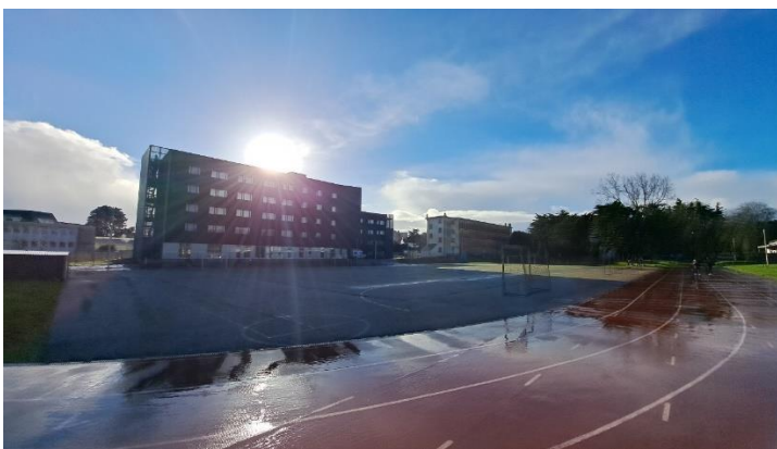
Área del internado y pista de atletismo, al interior del Liceo Colbert. Fotografía. D.R.E.

Desde ese momento hasta las 5 o 6 de la tarde podíamos volver a entrar, los fines de semana nadie se quedaba en el internado, porque por lo regular allí se quedaban franceses que vivían a 1 hora o más de la escuela, y los fines de semana se iban a sus casas. Estaba adaptado a todo tipo de necesidades, ha sido una experiencia muy grata estar en ese lugar porque es muy distinto a todo lo que he visto aquí en México.