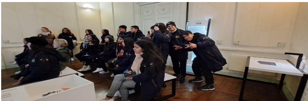
Superior. Actividad Conociendo las instalaciones del Liceo Colbert. Inferior. Visita al Museo Li-Mur en Vannes.

El jueves 19 de enero, visitamos Vannes, la capital de Morbihan, una región de la Bretaña cercana al mar atlántico, ciudad amurallada desde la época medieval, actualmente sede de los duques de Bretaña 9 a la cual nos trasladamos en bus, llegando a la estación del tren como punto de referencia, tuvimos oportunidad de caminar por sus calles empedradas, de conocer su mercado donde había un local de comida mexicana, de contar con visita guiada en español y conocer la historia de la catedral, casas medievales, exposiciones de arte contemporáneo y museo Li-Mur. Como olvidar aquel día de los más fríos que tuvimos en nuestra estancia en la Bretaña, pero un cafecito en la estación del tren ayudo a no sentirlo tan fuerte y comenzar de la mejor forma los recorridos guiados, fue tanta mi admiración por una de las