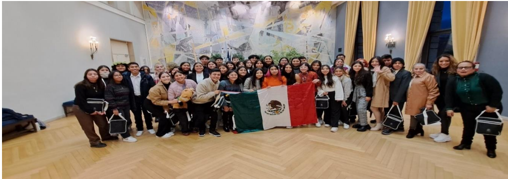
Delegación Mexicana en el Ayuntamiento de Lorient, Bretaña Francesa.