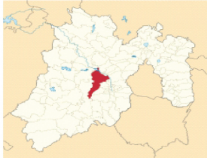
Figura 1. Mapa del municipio de Toluca