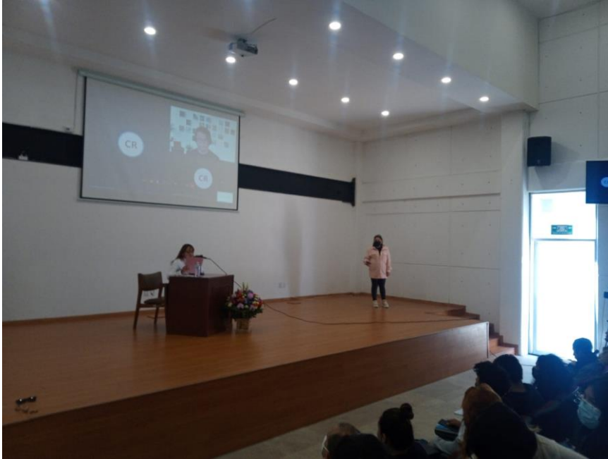
Encuentro con egresados de la Licenciatura en Arte Digital.