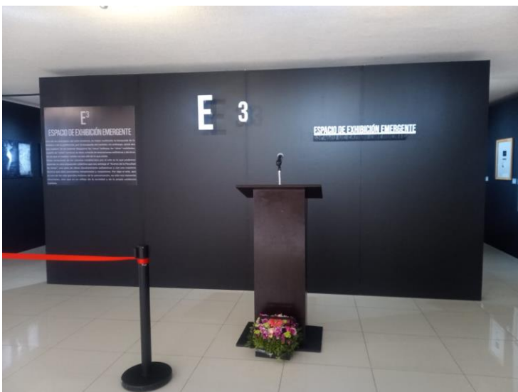
Inauguración del Espacio de Exhibición Emergente del Museo del Barro en Metepec, Estado de México.

Así mismo, el Museo del Barro, ubicado en el municipio de Metepec, inauguró su sala emergente con obra que es parte del patrimonio universitario; también, fue sede de la muestra oficial de los alumnos seleccionados en el XX Salón Anual de la FA. La colaboración con este municipio además incluyó la participación en el Festival Internacional de Arte y Cultura de Quimera 2022 .