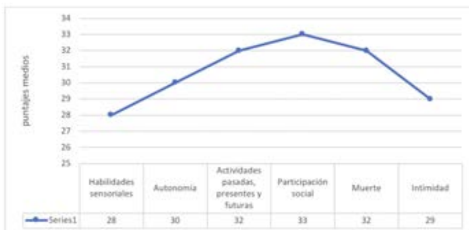
Gráfico 1. Resultados medios para cada dimensión del estudio según la percepción de los AM de comunidad rural, Estado de México (2003)