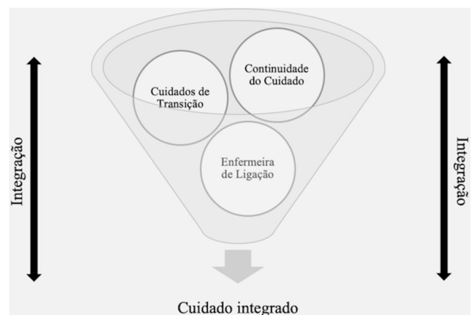
Figura 2. Conceito em análise e sua relação com outros termos. Curitiba, PR, Brasil, 2021.

Outras relações entre o conceito Cuidados de Transição com os termos Enfermeira de Ligação, Continuidade do Cuidado e Integração podem ser apontadas. Por exemplo, as atividades desenvolvidas pela Enfermeira de Ligação para a Continuidade do Cuidado sugerem que a articulação com os serviços minimiza a descontinuidade no cuidado 6,23 ou, ainda, que os problemas relacionados aos Cuidados de Transição da assistência hospitalar para o domicílio levaram à forte recomendação da introdução do papel de Enfermeira de Ligação 6 . As Enfermeiras de Ligação são essenciais na alta hospitalar e garantem adequado planejamento