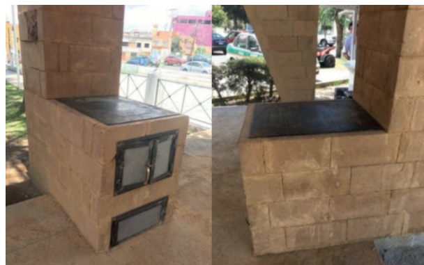
Prototipo 1 de estufa de leña