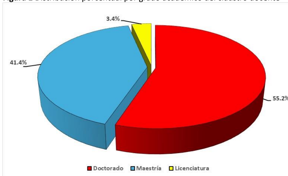
Figura 1 Distribución porcentual por grado académico del claustro docente

acuerdo con su grado académico, se identificaron: 1) 16 doctores (uno de ellos se encuentra realizando su posdoctorado en la Maestría Gestión Sustentable del Turismo de la Factor, 2) 12 con el grado de maestría y 3) un catedrático con licenciatura. El 27.6 por ciento pertenecen al Sistema Nacional de Investigadoras e Investigadores (SNII) del Consejo Nacional de Humanidades, Ciencias y Tecnologías (CONAHCYT).