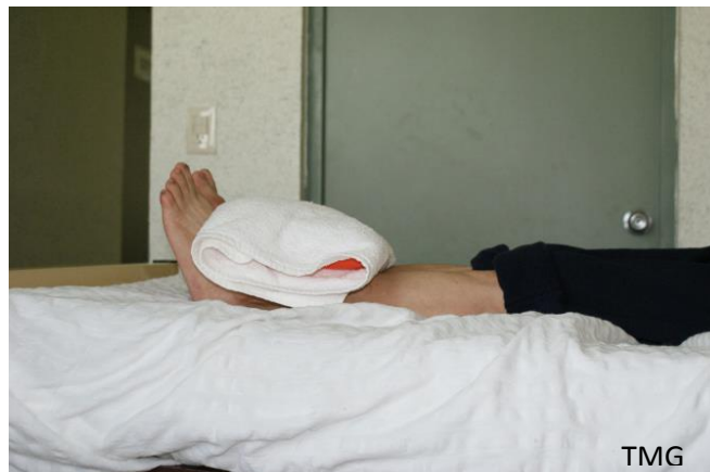
21. Paciente en decúbito supino con compresa húmedo caliente en las extremidades pélvicas (tobillos)

Etapa 3 El paciente permanece durante 5 minutos en decúbito dorsal con las piernas horizontales, envueltas en un cobertor de lana y calentadas mediante botellas o fomentos de agua caliente. De este modo, se mantiene el rubor reaccionario que se logró de los ejercicios de la etapa 1 y 2.