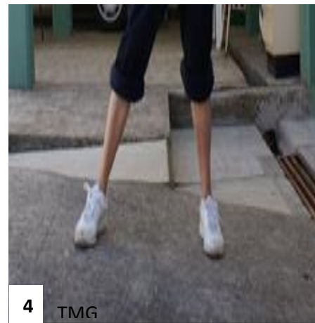
17. Figura 1. Paciente subiendo rampa. Figura 2. Figura bajando escaleras. Figura 3. Paciente subiendo escaleras de lado. Figura 4. Paciente subiendo rampa de lado.