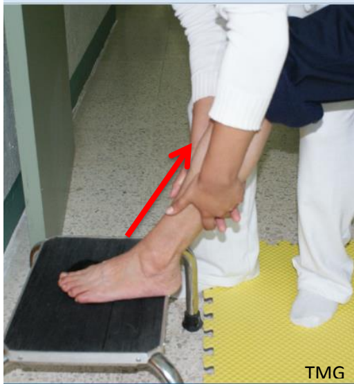
5. b Frotaciones ascendentes