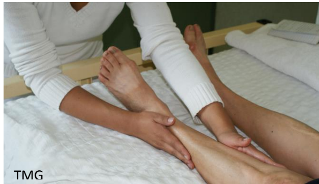
22. effleurage en miembro inferior izquierdo.