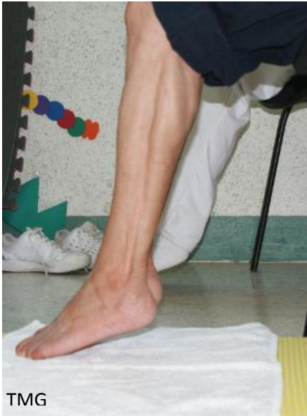
12. b. Pisa puntas