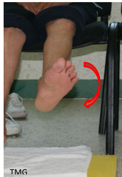
11. a Circunferencia hacia la izquierda