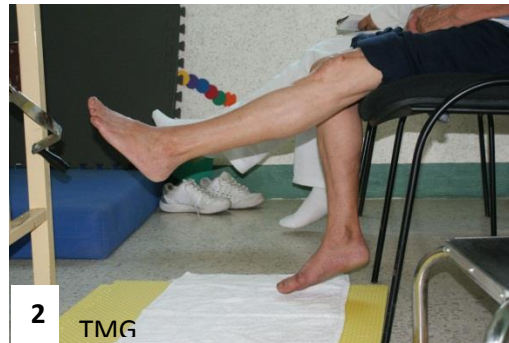
15. d. En la figura 1. Extensión de rodilla derecha. Figura 2. Extensión de rodilla izquierda