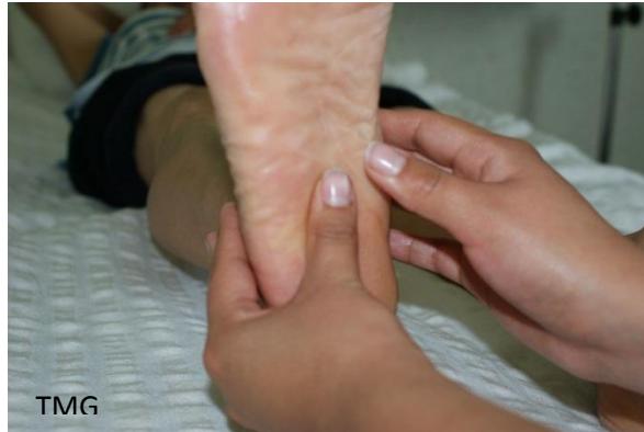
28. Figura 1 amasamiento palmodigital en planta de pie.

8) Finalmente, se realiza la misma maniobra de effleurage, descrita al inicio.