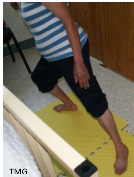
Fig. 4. a Estiramiento de aductores