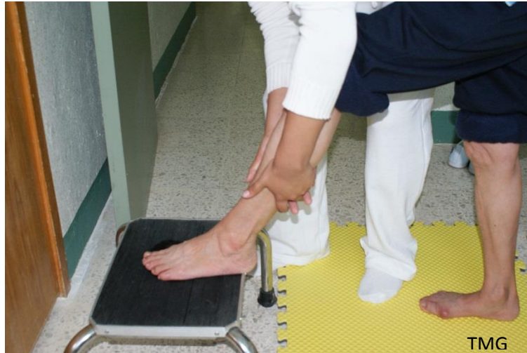
18. Relajación de musculatura mediante pequeñas frotaciones ascendentes

Acabar relajando la musculatura de la pantorrilla mediante estiramientos, pequeñas sacudidas y frotaciones ascendentes y descendentes para favorecer la circulación de retorno y de aporte arterial respectivamente. Para ello se eleva el miembro en un taburete. (38)