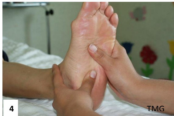
24. Figura 1. Amasamiento palmodigital en gemelos. Figura 2. Amasamiento nudillar suave en gemelos. Figura 3.y 4. Amasamiento digital en planta de pie y dedos.