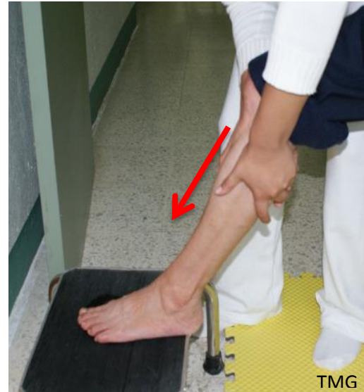
6. b Frotaciones descendentes