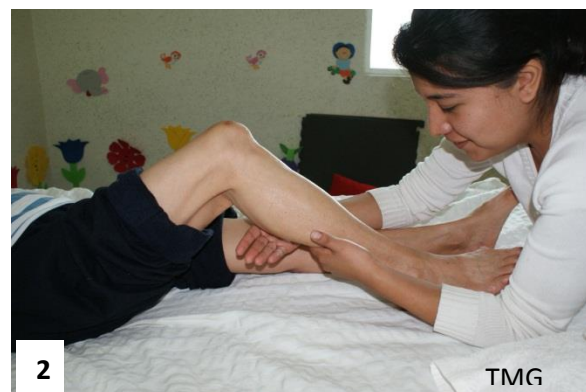
26. Figura 1 y 2 Percusiones nudillares suaves en gemelos