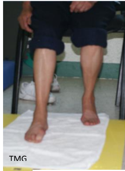
9. a Flexiones de los dedos