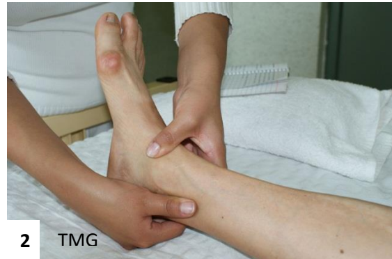
25. Figura 1 y 2 Amasamientos en zona perimaleolar interna y externa