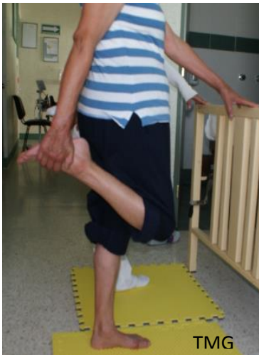
Fig. 1. a Estiramiento de cuádriceps