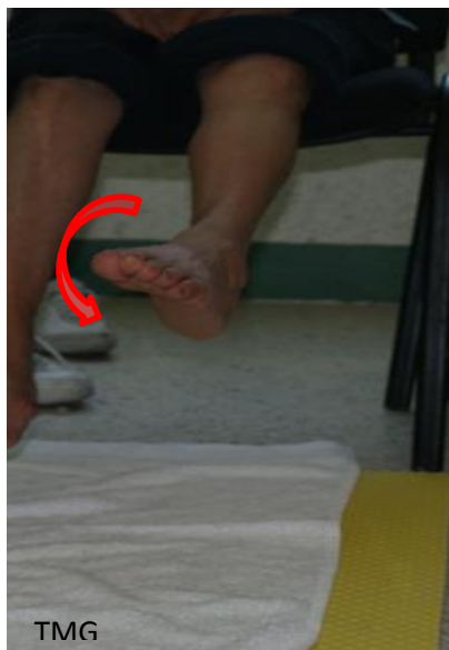
10. a Circunferencia hacia la derecha

a) Hacer circunferencias con los tobillos, en un sentido y en el otro.