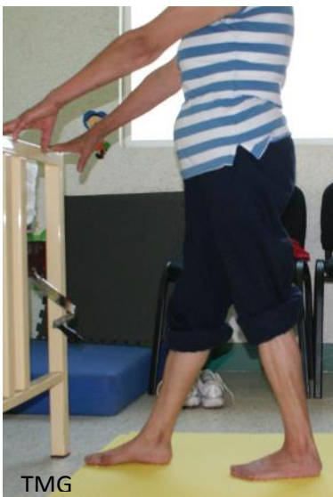
Fig. 3. a Estiramiento de tríceps sural