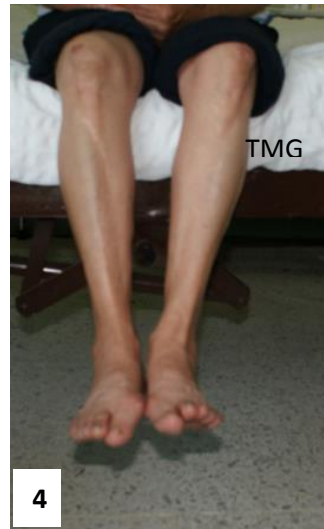
20. Figura 1. plantiflexión de tobillos. Figura 2. Dorsiflexión de tobillos. Figura 3. Pies separados. Figura 4. Pies juntos

Etapa 3 El paciente permanece durante 5 minutos en decúbito dorsal con las piernas horizontales, envueltas en un cobertor de lana y calentadas mediante botellas o fomentos de agua caliente. De este modo, se mantiene el rubor reaccionario que se logró de los ejercicios de la etapa 1 y 2.