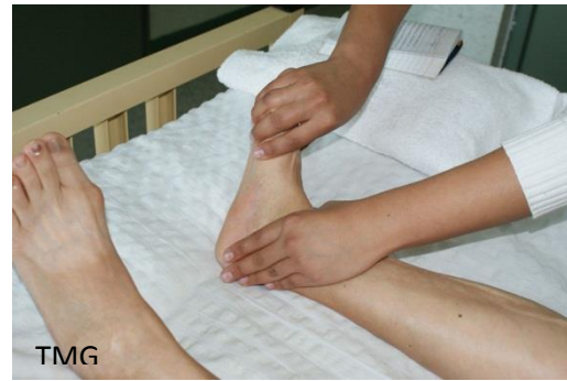
23. Fricciones suaves de distal a proximal en miembro inferior.

3) Se suman diferentes modalidades de amasamiento en las zonas distales y musculares