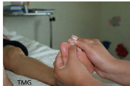
27. Figura 1 Maniobra de abrazadera en sentido descendente Figura 2. Amasamiento en los dedos