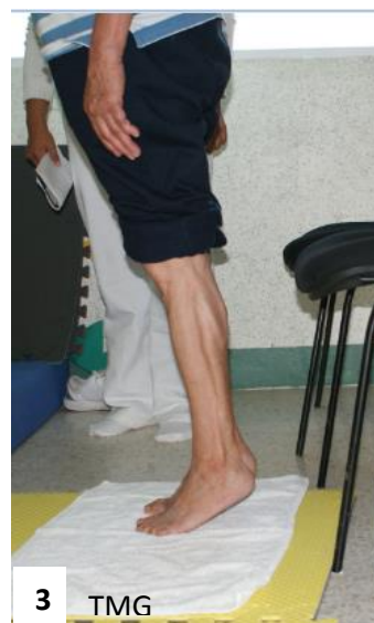
16. a. En la figura 1. Paciente en sedestación. Figura 2. Levantarse e inclinarse .Figura 3. Paciente de puntillas.