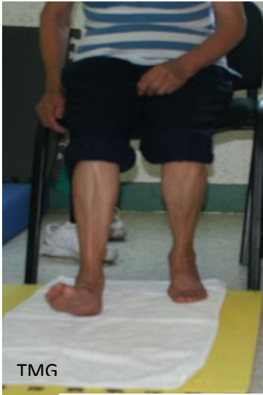
8. a Extensiones de los dedos