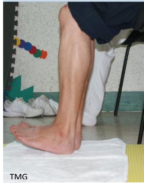
13. b. Pisa talones