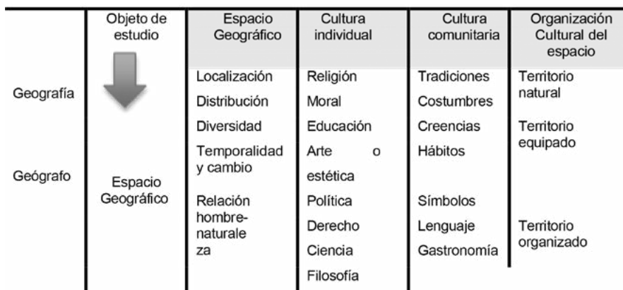
Cuadro 5: Estructura general de la geografía cultural