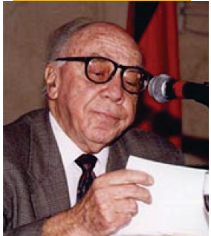
Fig. 1. Ángel Bassols Batalla. Imagen tomada de Humaindex, UNAM. Consultado el día 16 de febrero de 2026.

El texto destaca la relevancia de Ángel Bassols Batalla como figura central de la geografía económica en México y como un académico comprometido con la realidad social. Su sólida formación internacional y su amplia experiencia de campo enriquecieron su labor docente, integrando investigación y enseñanza como un proceso inseparable. La visión de Bassols es importante en la enseñanza de la geografía porque propone comprender el espacio como resultado de la interacción entre sociedad y naturaleza. Además, impulsó el análisis crítico de la desigualdad, la regionalización y el desarrollo, formando estudiantes con conciencia social y enfoque integral. Su legado consolidó una geografía práctica y transformadora, orientada no solo a describir el territorio, sino a entenderlo para mejorar la realidad colectiva.