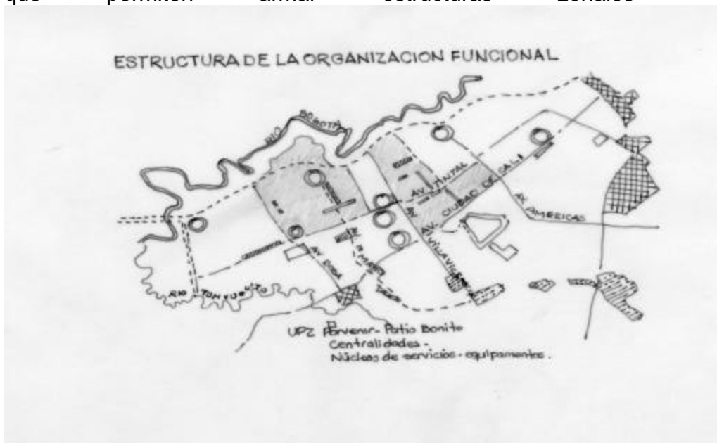
Figura 3 Organización Funcional Pieza Borde Occidental

Existe un nivel complementario de nodos de actividades reconocidos al interior de las UPZ que permiten armar estructuras zonales y vecinales.