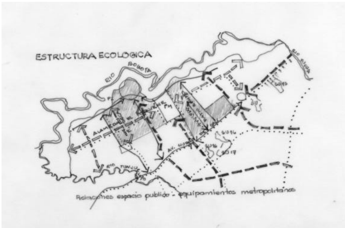
Figura 1 Estructura Ecológica y espacio publico, Pieza Borde Occidental

La estructura Ecológica de la pieza Borde Occidental Sur está definida por la franja compuesta por los parques metropolitanos de las plantas de tratamiento de la Magdalena y de la Isla, que recogen los afluentes del río Fucha y del río Tunjuelito, por la zona de manejo y preservación del río Bogotá y por el espacio de recuperación del botadero de Gibraltar constituido en el Parque Metropolitano del Porvenir. Esta estructura ecológica es la misma que cobija a la UPZ Patio Bonito