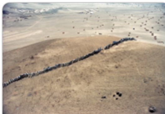
Francis Alÿs. Cuando la fe mueve montañas, 2009

Asimismo, muchas de las producciones que se presentan en Festivales internacionales como Zona Maco, dan cuenta de que esta tendencia se mantiene vigente tanto para circular en museos como para ser comercializadas.