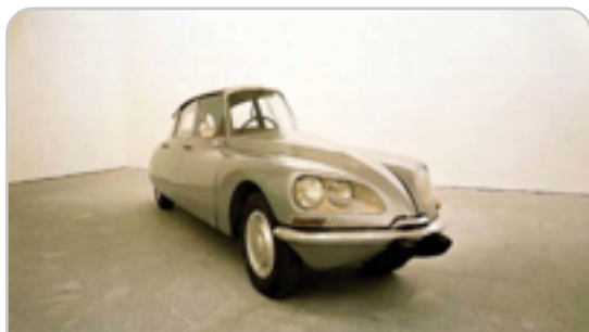
I. conceptualismo "estética de las ideas"