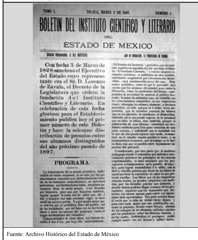
Figura 2. Portada del primer boletín del Instituto Científico y Literario del Estado de México, marzo 1898.