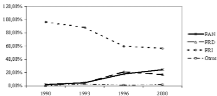
GRÁFICA 2 TENDENCIAS SEGÚN EL NÚMERO DE MUNICIPIOS GANADOS POR PARTIDO POLÍTICO 1990-2000

FUENTE: Elaboración propia con datos de la CEEM y del IEEM. (Estado de México, México)