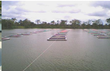
Figura 3. Jaulas flotantes, 2011