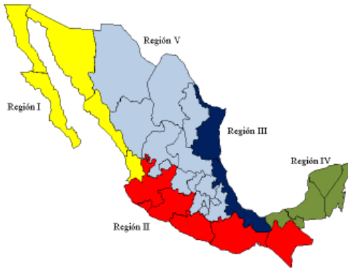
Figura 1. Regiones pesqueras de la República Mexicana, 2008