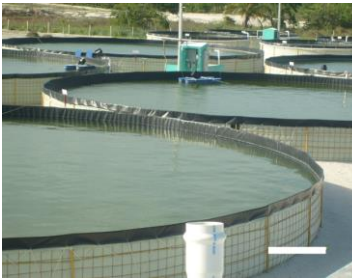
Figura 2. Tinas de geomembrana, 2011