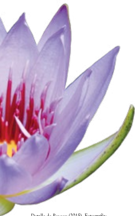
Detalle de Renacer (2015).

Estás a mi lado, sin embargo, me parece verte desde lo alto. Quizás porque, leyendo, miras hacia abajo, hacia aquel punto donde te has retirado sustrayéndote de mí. Justo por esto avanzo lentamente, como al borde de un precipicio. Es por esto que me asomo hacia el vacío en cuyo fondo puedo a duras penas figurarte.