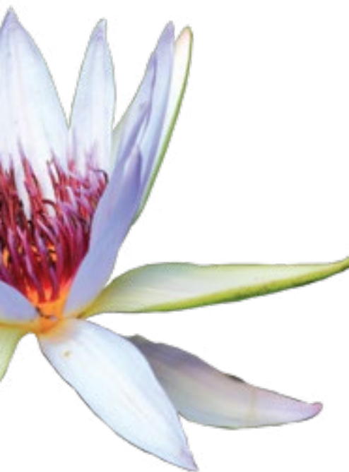
Detalle de Manantial (2015). Fotografía: Celene Salgado-Miranda.