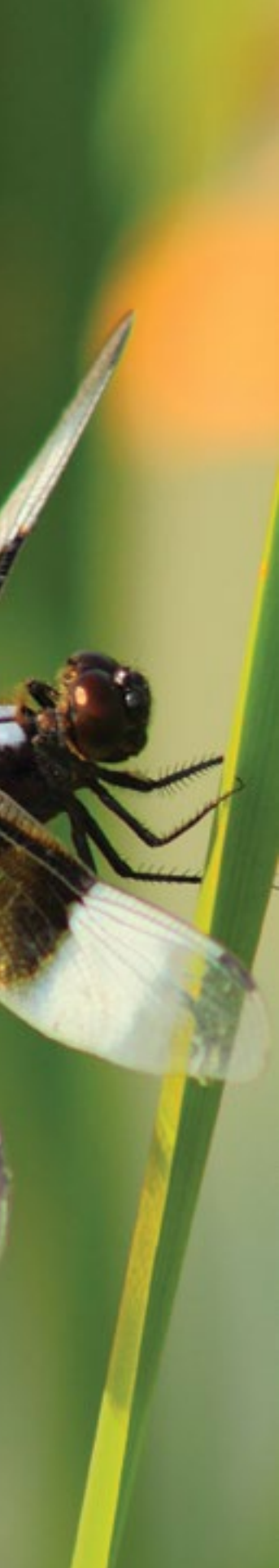
Detalle de Vida (2012).