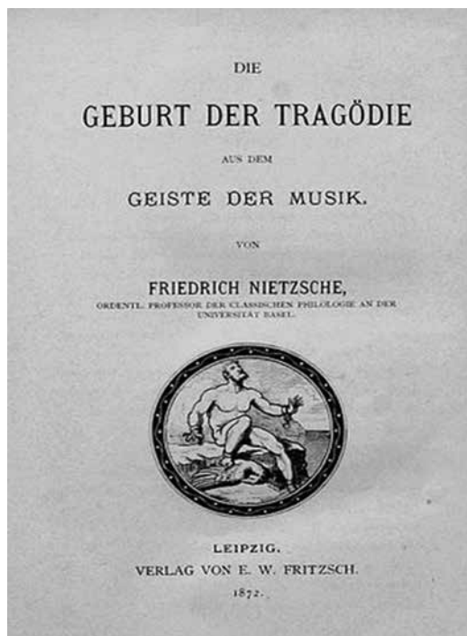
Portadilla de la primera edición de El nacimiento de la tragedia en el espíritu de la música .

de la consideración siguiente: el poder mágico y transfigurador que manifiesta la música —lo que en años muy tempranos Nietzsche denominó lo ‘demoniaco’— no corresponde con lo humano, puesto que la experiencia musical incitaba a creer en una especie de “estar dominado por fuerzas”, por una intromisión de las divinidades (démones) en el fuero interno del hombre. De esta manera, con el culto lo que se intentaba hacer era seducir a sus dioses de la misma manera en que éstos lo hacían con los hombres: