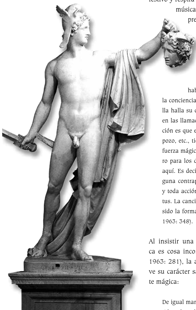
Perseo, de Antonio Canova, tomado de La Colmena 64, 2009.

esenciales: como canto (es decir, como lengua viva), dotado de un lenguaje sonoro y rítmico, y como danza, símbolo del cuerpo, corporeización de la posesión demoníaca y manifestación del éxtasis dionisiaco. Tomando esto en consideración, el culto griego parece haber tenido entonces un doble propósito: como rito religioso, una manera de seducir y complacer a los dioses; y como festividad, una forma de animar a los hombres hacia el regocijo por la vida, pues aquí, en una religión de la vida, no del deber, o de la ascética, o de la debilidad, el hombre es festivo y respira con alegría la existencia. Entretanto, la música junto con la palabra jugaron un papel preponderante en el culto: