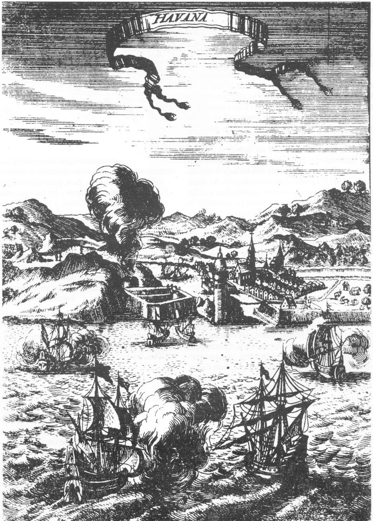
Havana. Anónimo del siglo XVIII •