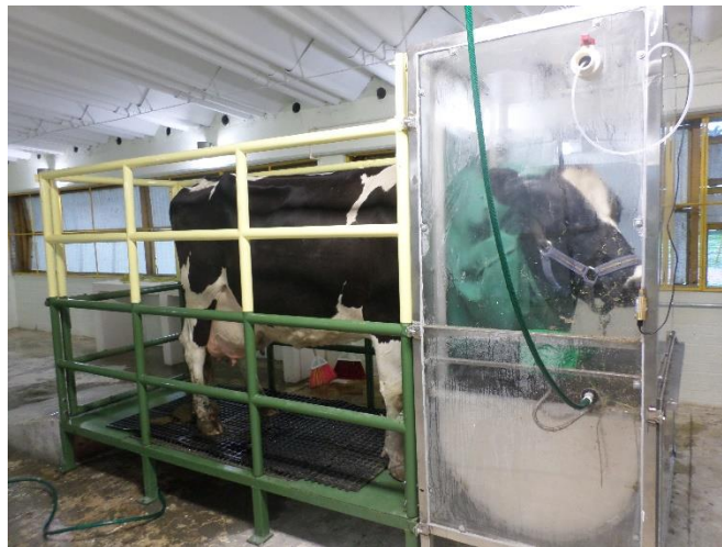
Imagen 1: caja de cabeza del Laboratorio de Ganadería, Medio Ambiente y Energías Renovables de la Universidad Autónoma del Estado de México.

Suzuki et al. (2008) realizaron la construcción de una cámara de este tipo para llevar a cabo un experimento y así estimar el balance de energía de ganado Brahman con un peso corporal de 372.8 \pm 34.4 , alimentado con pasto Pangola. Las tasas de recuperación de \text{CO}_2 estuvieron entre 96,5 % y 101,8 %. El volumen medio de la producción de \text{CH}_4 era de 228,3 L/día y la pérdida de energía en forma de \text{CH}_4 fue de 0.097 respecto a la ingesta de energía bruta.