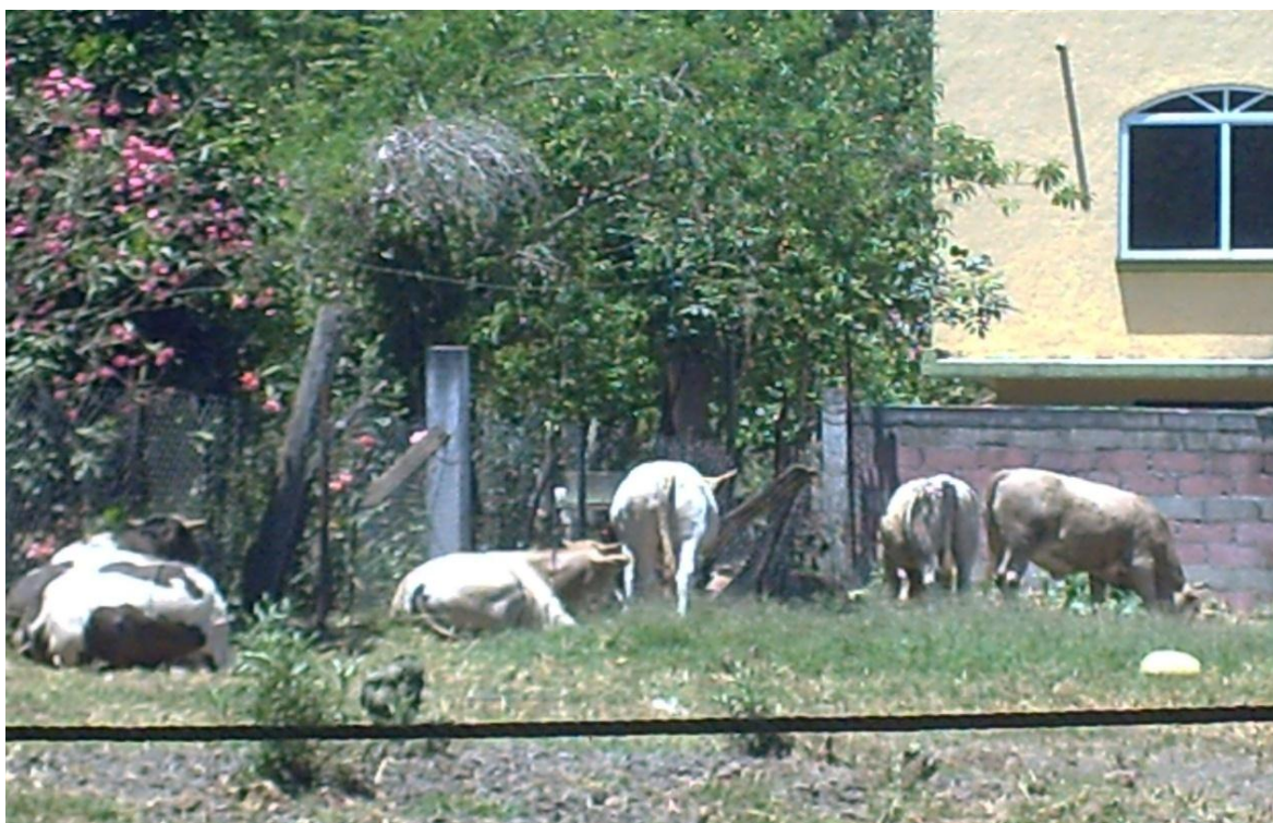
Figura 8. Corral típico de una engorda en confinamiento. Sur del Estado de México. Imagen propiedad de los autores.

Para este nivel tecnológico, al cual se elaboró el proyecto, se consideró que la mayoría de las engordas en corral en el sur del Estado de México, se construyen con material rústico; es decir, la superficie de terreno se habilita y se circunda con postes de madera, a una distancia de dos metros cada uno, alambre de púas, un portón o puerta de acceso también de alambre de púas y postes de madera, con una pileta (provista de agua) al centro u orilla del terreno, más un embarcadero rústico para subir los animales finalizados al transporte-rastro. Se estimó un gasto por este rubro (Figura 4) (visto como inversión fija), aproximado de $3,000.0.