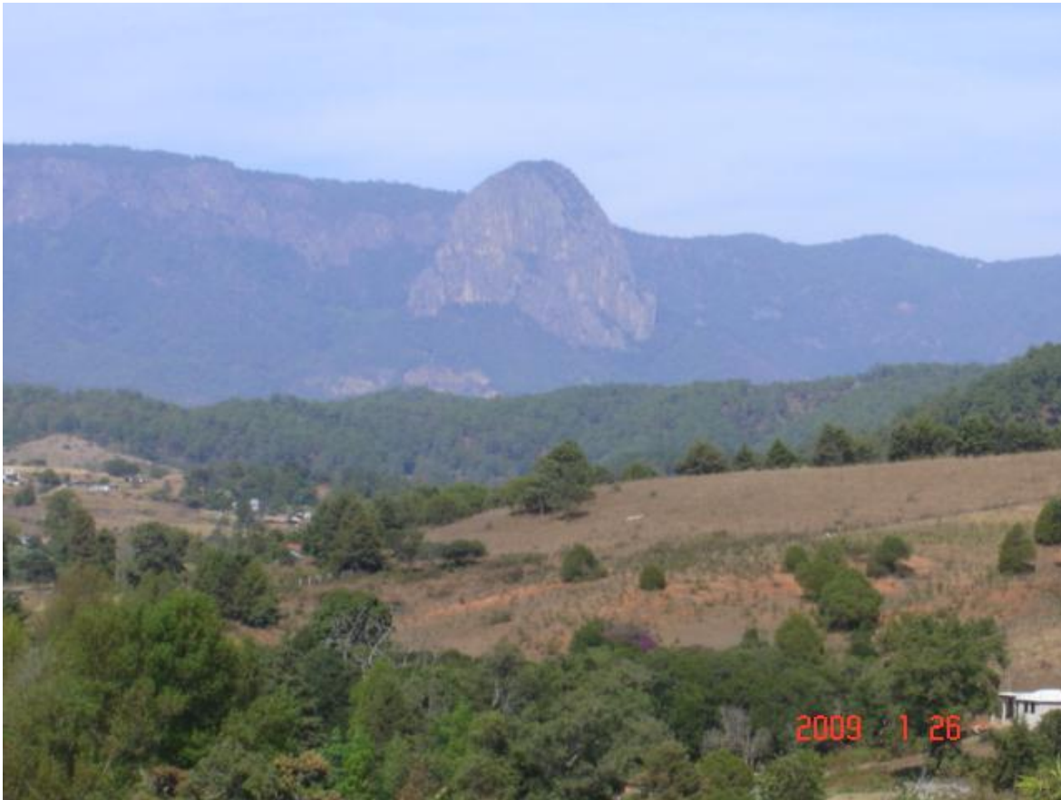
Figura 1. Vista del pueblo de Almoloya de las Granadas, Tejupilco, Estado de México.

Esta comunidad, tiene una altitud de 1,550 msnm (con GPS). Su población es, aproximadamente, 1,300 habitantes (58% mujeres, 42% hombres) (Com. Personal con Delegado Municipal). Dispone de vías de acceso primarias y secundarias, es decir, una carretera regional, pavimentada Tejupilco-Almoloya, desviación a partir de carretera pavimentada estatal, con un tramo de terracería, en buen estado; que conecta a la comunidad de Río Grande; energía eléctrica con cableado de la CFE, acceso a telefonía fija con capacidad para comunicación inalámbrica de Internet en casa. Algunos pueblos de importancia e influencia a la comunidad son: Tenería, Río Grande, Ojo de Agua, Cerro Alto y Los Martínez.