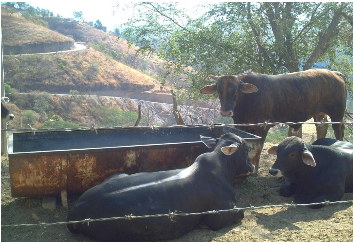
Figura 9. Comederos rústicos en un sistema de engorda en corral. Sur del Edo. Méx.