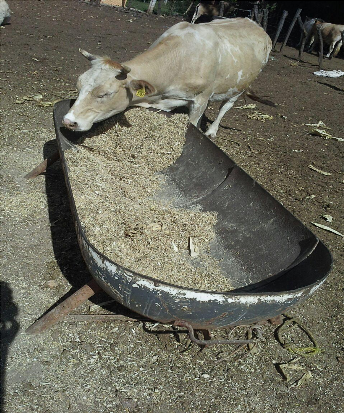
Figura 4. Comedero típico para una engorda en corral. Sur del Estado de México. 2016.