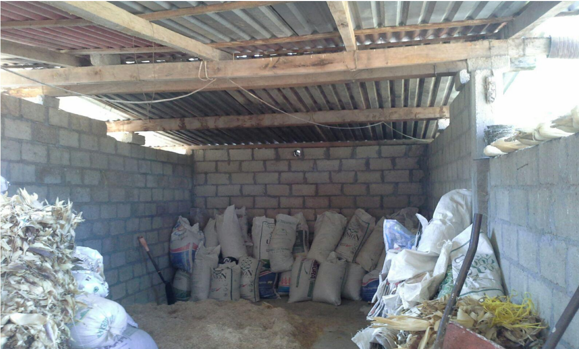
Figura 6. Bodega típica, para almacenar el alimento en engorda en corral. Enero, 2016.

al. (2011a) y Rebollar et al. (2011b), un bovino de tal naturaleza, durante 90 días de engorda en corral, para alcanzar un peso vivo final de aproximadamente, 500.0 kg, requiere consumir 990 kg de alimento. Por tanto, previo a la engorda, se necesita tener, en bodega, todo el insumo alimento, necesario para que el sistema opere sin problemas de este tipo.