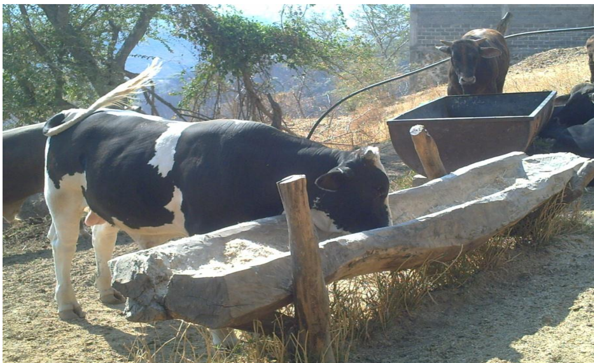
Figura 7. Dieta típica para una engorda en el sur del Estado de México.

Estimaciones propias con información de campo. Diciembre de 2015.