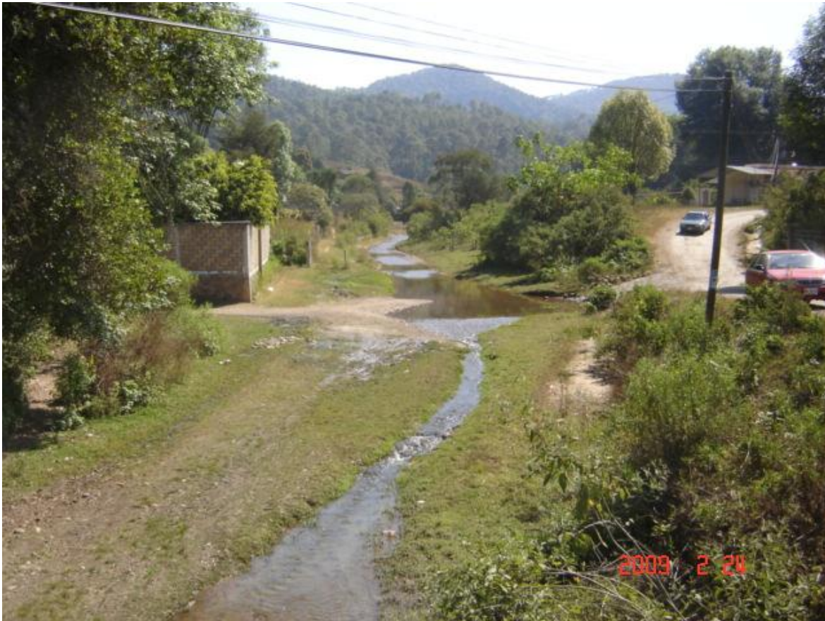
Figura 3. Arroyo principal de Almoloya de las Granadas en la época de secas.

Lo accidentado del municipio hace que tenga escurrimientos que al sumarse unos a otros forman arroyuelos y ríos, el río Temascaltepeces el más importante porque conserva su caudal todo el año, este río corre de norte a sur, desemboca en el río Cutzamala, éste a su vez vierte sus aguas en el río Balsas.