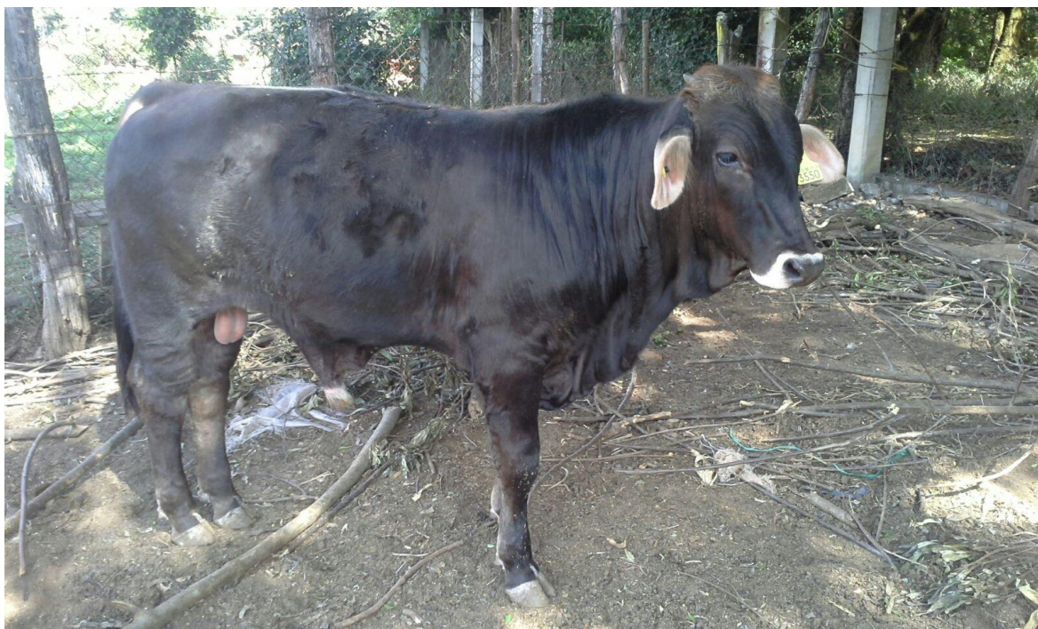
Figura 6. Torettes destinados a engorda en corral, Tejupilco, enero de 2016.

Se planeó adquirir 50 toretes por periodo de engorda, dos engordas al año; total 100 cabezas. El ganado que se someterá a la engorda en corral, provendrá de la misma región. El peso vivo a entrada en corral será, en promedio, 350.0 kg. El precio, hasta el momento de la investigación (diciembre de 2015) que se consideró para adquirir los animales fue de 42.0 $/kg in vivo . Lo que equivale a un desembolso por este rubro de: (100 \text{ cab}) \times (350 \text{ kg}) \times (\$42.0) = \$1, 470,000.0 , mismos que serán aportados por el socio o socios.