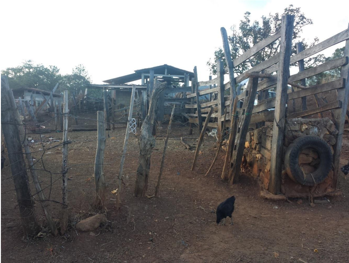
Figura 5. Corral rústico en una engorda intensiva de bovinos carne. Tejupilco, enero 2016.