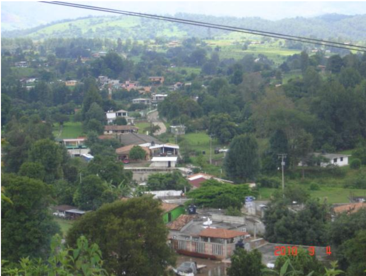
Figura 2. Almoloya de las Granadas, Tejupilco. Estado de México.

El Pueblo de Almoloya de las Granadas, representa grandes abismos, profundas barrancas y depresiones que determinan parte del sistema montañoso de Tejupilco.