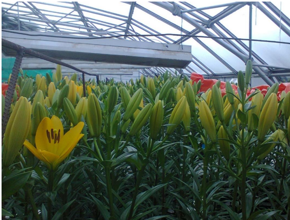
Fig. 1. Punto de corte, cuando el botón floral central estaba pigmentado (Franco et al. , 2009) y sin eclosionar las 2 primeras flores inferiores (Bañón et al. , 1993)