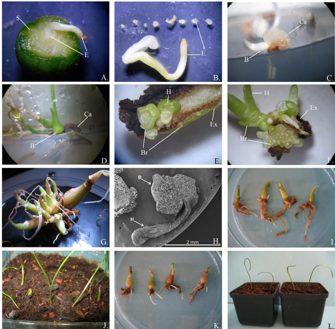
Figura 3. Micropropagación de Hymenocallis harrisiana (Herb.). A. Corte transversal de la semilla para la extracción de los embriones. (S) semilla; (E) embrión. B. Embriones extraídos de una semilla. C. Germinación a los 30 DDIC en el tratamiento 12 con 1.0 mg L -1 de AIB + 1.0 mg L -1 de TDZ + 60 g L -1 + 1 g L -1 CA. (B) bulbo; (Ca) Callo. D. Desarrollo de bulbo y raíz a los 60 DDIC, en el tratamiento 5 con 1.0 mg L -1 de AIB + 0.5 mg L -1 de TDZ + 30 g L -1 + 1 g L -1 CA. E. Formación de bulbillos adventicios en una sección de escama de bulbo cultivada en el tratamiento con 1.0 mg L -1 de AIB + 1.0 mg L -1 de TDZ, 120 DDIC. (H) hoja; (Br) bulbillo. (Ex) explante. F. Desarrollo de bulbillos adventicios en una sección de callo cultivado en el tratamiento con 2.0 mg L -1 de ANA + 0.5 mg L -1 de TDZ. 120 DDIC. G. Desarrollo de bulbillos de 10-25mm de longitud a los 180 DDIC. H. Microfotografía de la formación directa de un bulbillo a los 180 DDIC. Barra = 2mm. I. Bulbillos enraizados a los 60 DDIC, en medio MS al 50%, con 30 g L -1 de sacarosa, 7 g L -1 de agar, adicionando 0.5 mg L -1 de ANA. J. Bulbillos de 25 mm de longitud en adaptación ex vitro . K. Bulbos a los 30 días de transferirlos a condiciones de invernadero. L. Bulbos trasplantados a macetas de 3 a los 30 días de transferirlo a condiciones de invernadero.