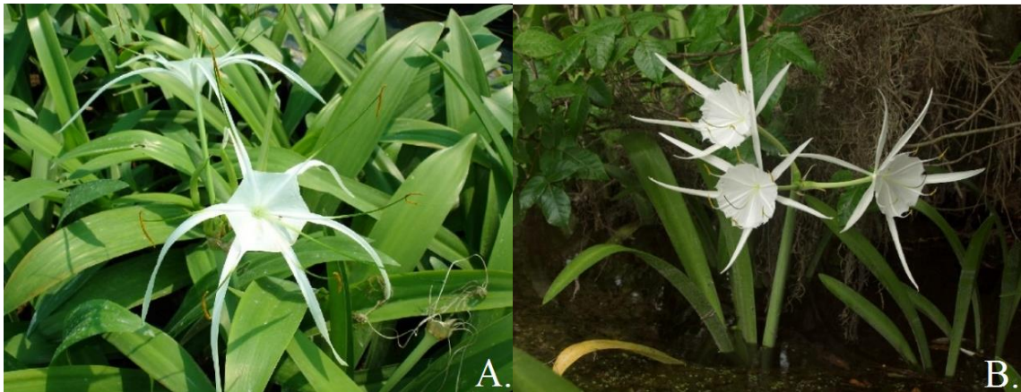
Figura 1. Especies de Hymenocallis . A. Hymenocallis littoralis Salisb., de uso comercial. B. Hymenocallis rotata en su hábitat natural.

El crecimiento de las especies de este género está relacionado con los ambientes donde se desarrollan, ya sean ambientes boscosos, selva nublada, etc. (Raymúndez et al. , 2005). El follaje persiste en algunas especies, mientras que en otras es estacional y lo pierden durante el período de sequía. Muchas especies de Hymenocallis son muy raras en la naturaleza, tienen una distribución muy restringida o son endémicas de una sola localidad (CONABIO 2009).