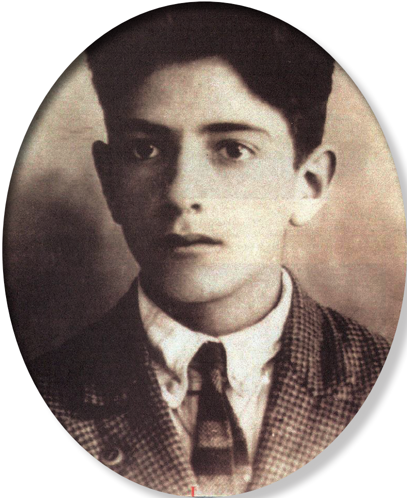
Egresado del Colegio Francés