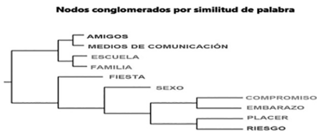
Figura 3. Nodo conglomerado por similitud de codificación.