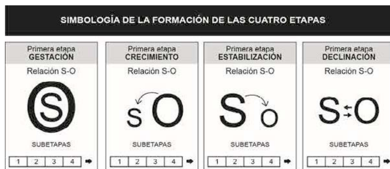
Figura 1. Simbología de la formación de las cuatro etapas y subetapas de la evolución de la conciencia.

Una vez comprendidos los elementos del esquema, se puede advertir que existen Objetos Mayores y Menores, el acceso a los primeros se da a través de la relación con objetos menores, asibles para el sujeto e inteligibles para la mente humana. Conforme se avanza en el proceso de conciencia se puede establecer relaciones con objetos cada vez más grandes. Asimismo, el proceso de la evolución de la conciencia se sigue tanto a nivel individual como colectivo. En ambos niveles sólo a través de la conformación de Masa Crítica son posibles los cambios de época (primitiva, agrícola, industrial, sociedad consciente); en otras palabras, la evolución de la consciencia como relación Sujeto – Objeto, es un proceso histórico (Figura 1).