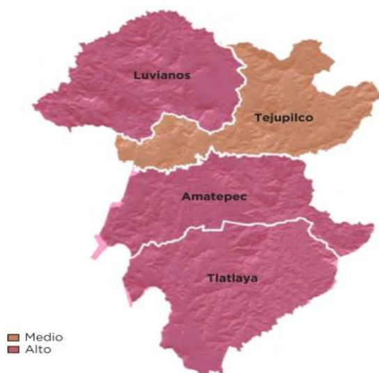
Figura 3. Grado de Marginación en la región X Tejupilco