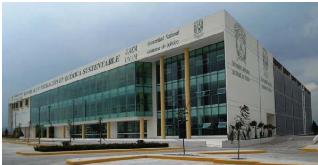
FIGURA 1. Fachada del CCIQS, UAEM-UNAM.