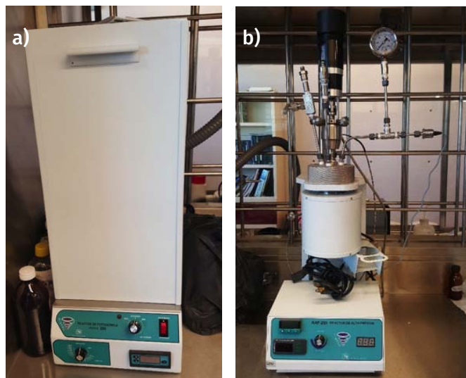
FIGURA 5. a) Reactor de fotoquímica con lámpara UV; b) reactor de alta presión marca Prendo.