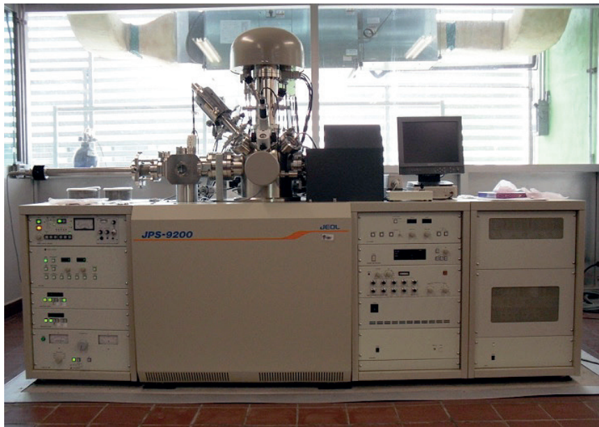
FIGURA 4. Espectrómetro fotoelectrónico de rayos X.

Características: Marca JEOL JPS-9200, fuente dual de magnesio y aluminio para modalidad estándar, en modalidad monocromática opera con fuente de aluminio y un cristal de cuarzo. Potencia máxima de 500 watts con la fuente de magnesio y de 600 watts con la de aluminio. Equipado con pistola de iones argón para etching y depth profile . Áreas de análisis de 1 mm, 0.2mm y 0.03 mm. Resolución de 0.75 eV (fuente de magnesio) 0.85 eV (fuente de aluminio) y 0.45 eV (fuente monocromática). Rango de medición de energía de enlace ( binding energy ) de 0 a 1480 eV. Cuenta también con cañón de electrones para neutralizar la carga superficial en muestras aislantes.