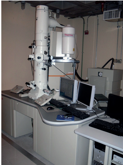
FIGURA 2. Microscopio electrónico de transmisión con detector Noran para análisis elemental mediante EDS, y dos detectores STEM para campo claro (STEM-BF) y anular de campo oscuro (STEM-ADF).

Características: JEOL-2100 de 200 kV con filamento de LaB6. Con una resolución de 0.23 nm punto a punto y 0.14 nm línea a línea. Alcanza magnificaciones de 2000x a 1.5 Mx, en modo normal, y de 50x a 6000x, en modo de baja magnificación. La adquisición de las micrografías se lleva a cabo de manera digital a través de una cámara CCD de Gatan, modelo SC200. Se tiene acoplado un detector de rayos-X para análisis por dispersión de energía (EDS) marca NORAN. Está también equipado con dos detectores para STEM, de campo claro (BF-detector) y anular de campo oscuro (ADF-detector). Es posible también realizar difracción de electrones de área selecta.