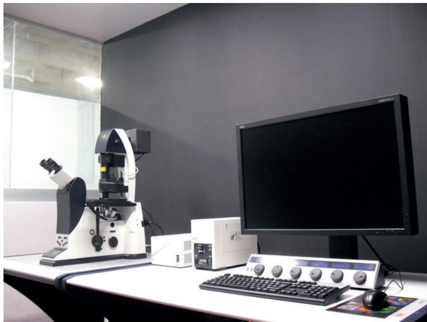
FIGURA 3. Sistema confocal espectral, modelo TCS SPE dmi 4000, Marca Leica.

Características: El microscopio confocal LEICA TCS SPE cuenta con 8 canales secuenciales, 4 láseres de estado sólido que cubren todo el rango de longitud de onda, con emisiones en: 405 nm (violeta), 488 nm (azul), 532 nm (verde) y 635 nm (rojo). Las fuentes de excitación láser tienen nuevos lentes de corrección para el desfaseamiento del haz láser; y un escáner totalmente automatizado, con prismas para la detección espectral, con obturador de alta velocidad para el cambio de excitación de manera automática con IFW y el sistema de iluminación EL6000, cuya lámpara tiene un tiempo de vida de 2000 h. El control de láser es totalmente automatizado (AOTF), con lo cual se regula la intensidad del láser ajustando de 0 a 100% dando una óptima iluminación, para la preservación de la muestra disminuyendo el blanqueamiento, no tiene partes móviles, lo que nos da un resultado con mayor rapidez y precisión. Pieza Z-Galvo de alta precisión en Z, funciona con todos los objetivos, la plataforma modular con interfaces predeterminadas, el diámetro de campo de los oculares es de 10x/25mm.