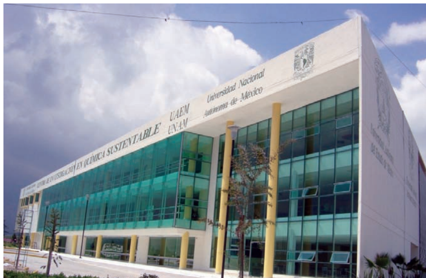
IMAGEN 1. Edificio principal del CCIQS UAEM-UNAM.

Una relación donde ambas universidades comparten riesgos, afrontan problemas y colaboran en actividades académicas de docencia e investigación, todo lo anterior de manera conjunta. En este modelo se concibe a la UNAM como una institución de apoyo y no de competencia con la Facultad de Química de la UAEM durante un tiempo determinado en el convenio de colaboración.