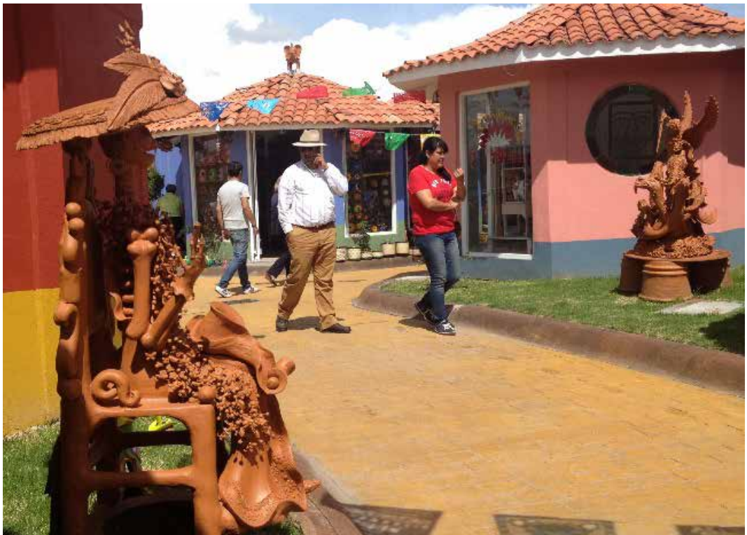
Figura 3: Turistas en el Mercado de Artesanías.

El trabajo en el Mercado Artesanal y la atención a los turistas y demás clientela, no exime a las mujeres de cumplir también con las tareas que socialmente se les suele asignar al interior de las unidades domésticas, como: preparar los alimentos para los miembros de la familia, limpiar, lavar, planchar, entre otras. Las mujeres con hijos pequeños también están al pendiente de la crianza y en muchas ocasiones las niñas y niños salen de la escuela y pasan las tardes en los locales, jugando, haciendo tareas escolares o ayudando a sus mamás o abuelas con pequeñas labores. Es común que las hijas o hijos adolescentes y jóvenes, que siguen estudiando, contribuyan en tareas de elaboración de piezas pequeñas, pintado, decorado o venta en el local.